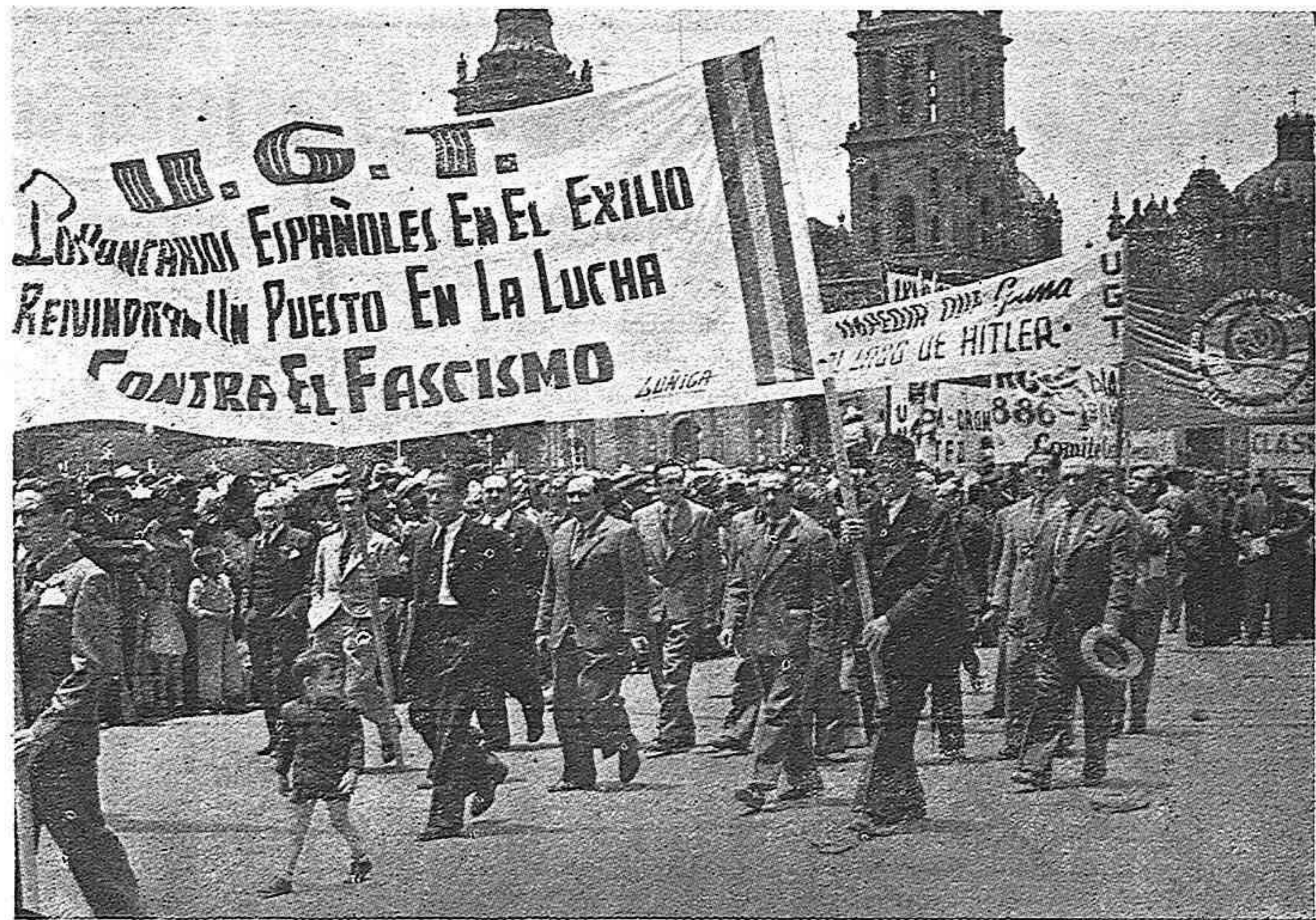
Una pancarta de la U. G. T. en el desfile del 10. de Mayo.