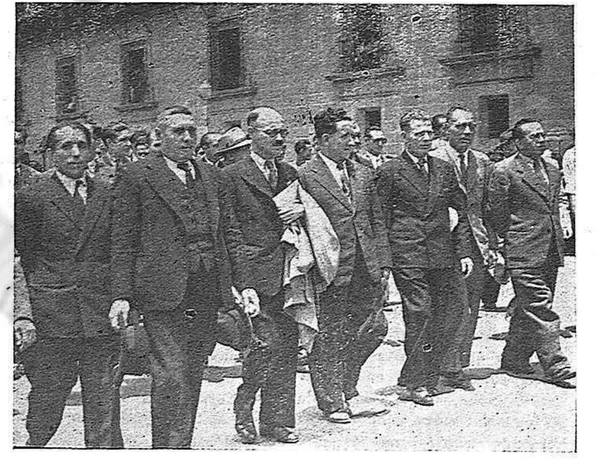
Un aspecto de la Presidencia de la columna de los españoles en el desfile del 1o. de Mayo.