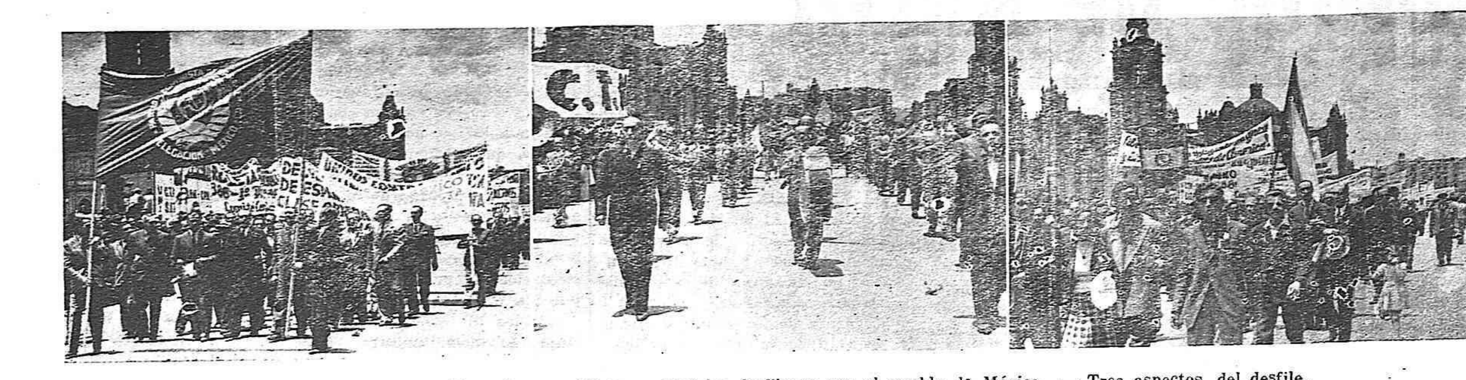
El día 1o. de Mayo los republicanos españoles desfilaron con el pueblo de México. — Tres aspectos del desfile.

A las nueve de la mañana empezaron a llegar los diferentes grupos españoles que habían de participar en la manifestación mexicana, con sus pancartas y banderas. Había sido fijado como punto de concentración la calzada izquierda de la Avenida de Juárez frente al monumento del insigne patrio Benito Juárez. A cada minuto que transcurría aumentaba la animación. La solemnidad y responsabilidad del acto no escapaba a nuestros compatriotas. Sabían que no era una simple manifestación. Les constaba que esta jornada había de ser aprovechada para intensificar la lucha contra Franco y Falange. Para hacer avanzar la unidad. Sabían también que nuestro pueblo, nuestros presos y nuestros muertos exigen de nosotros una preocupación constante, una mayor ayuda en su permanente combate, contra el