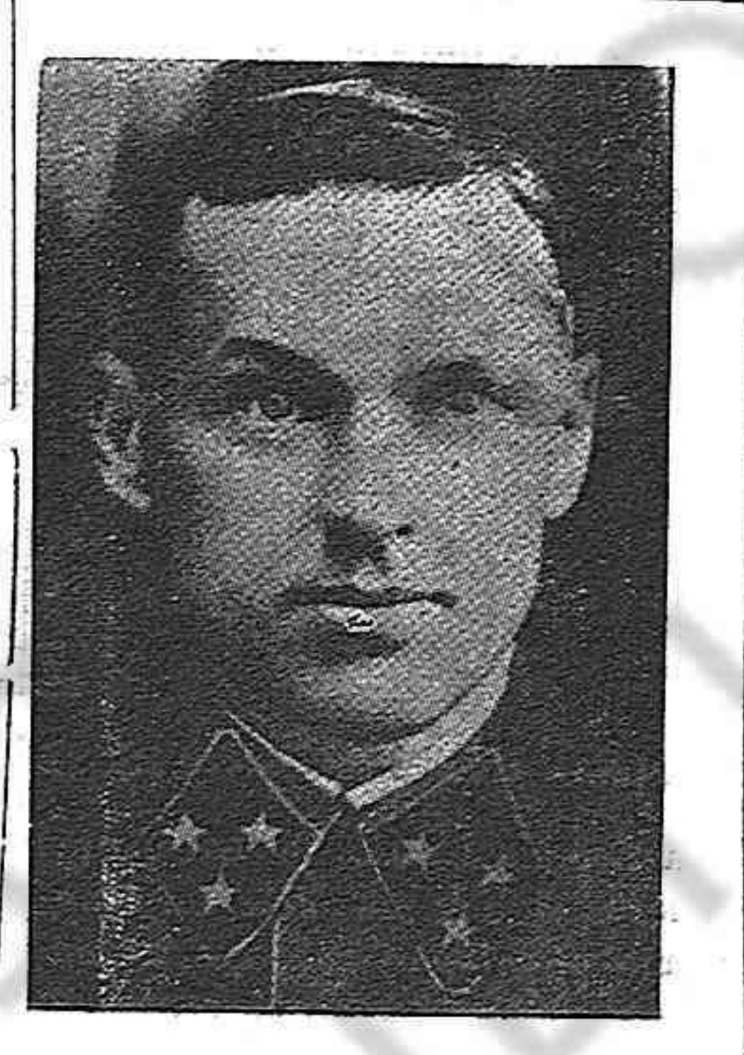
El Coronel General Rokossovsky, una de los grandes jefes militares de la Unión Soviética, héroe de Stalingrado.

padecen bajo la bota del cruel y despótico fascismo. Ese es nuestro criterio y por esta causa somos acérrimos partidarios de la unidad. Otra cuestión que pone de relieve que tales resoluciones están de espaldas a las preocupaciones vitales de la clase obrera, es la carencia de propuestas concretas sobre el problema de la unidad sindical. Vosotros debéis de conocer que todas las luchas, planteadas por los obreros de Vizcaya, Barcelona, Asturias, Levante, etc., tienen un profundo carácter unitario. Los obreros van forjando, en la más terrible situación, su propia unidad sindical, porque ésta es una necesidad para hoy y mañana y la mejor forma de superar los errores de ayer que tenían su base en la división que existió en las filas del movimiento sindical en España. Las experiencias de unidad que conocemos se producen en fábricas y talleres, en minas y puer-