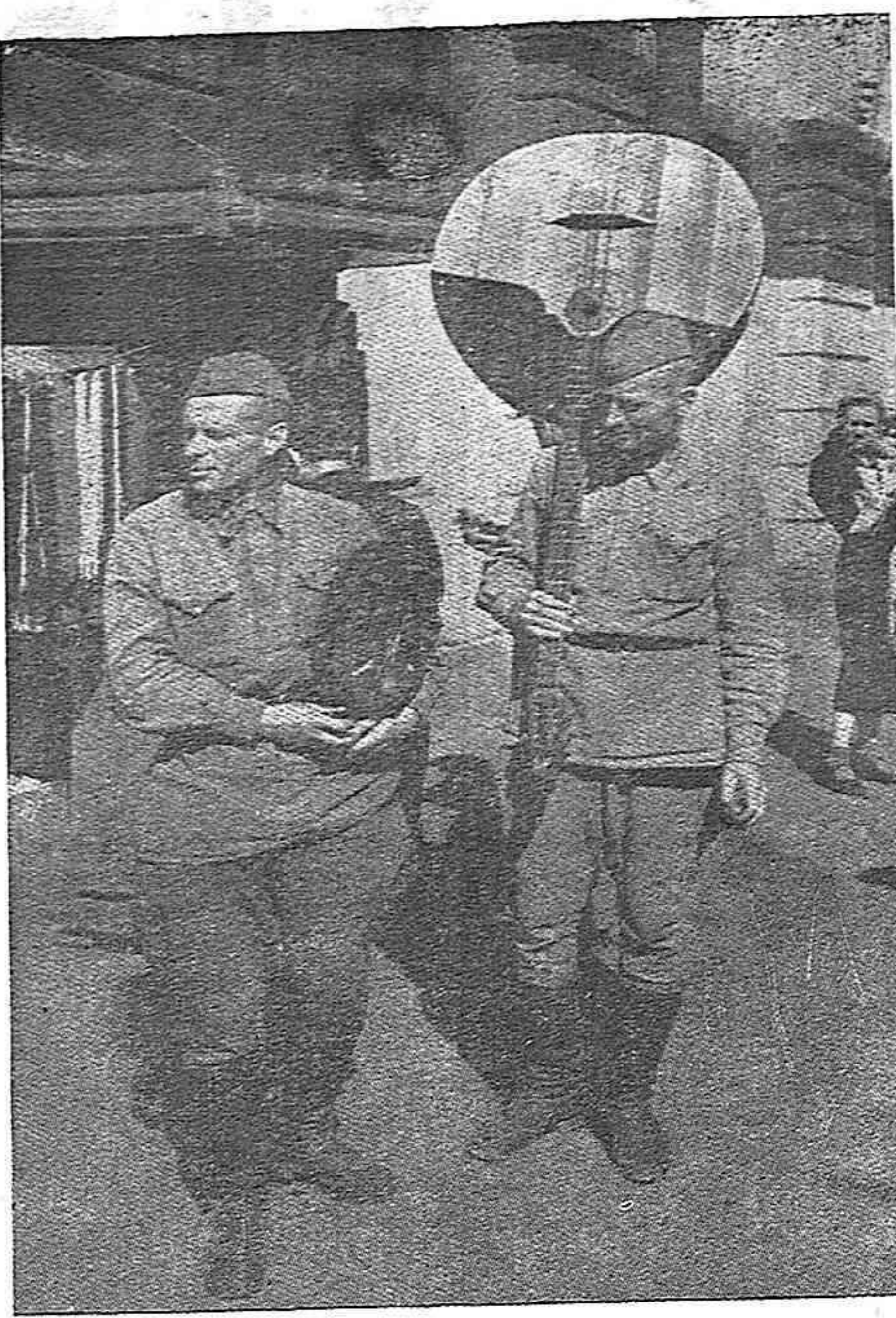
En las calles de una ciudad soviética, soldados del Ejército Rojo en día de descanso.

Los crímenes son muchos, ¡muchos! En nuestro próximo número esta mujer martirizada, símbolo de la España bajo Franco y Falange continuará su ¡Yo acuso!