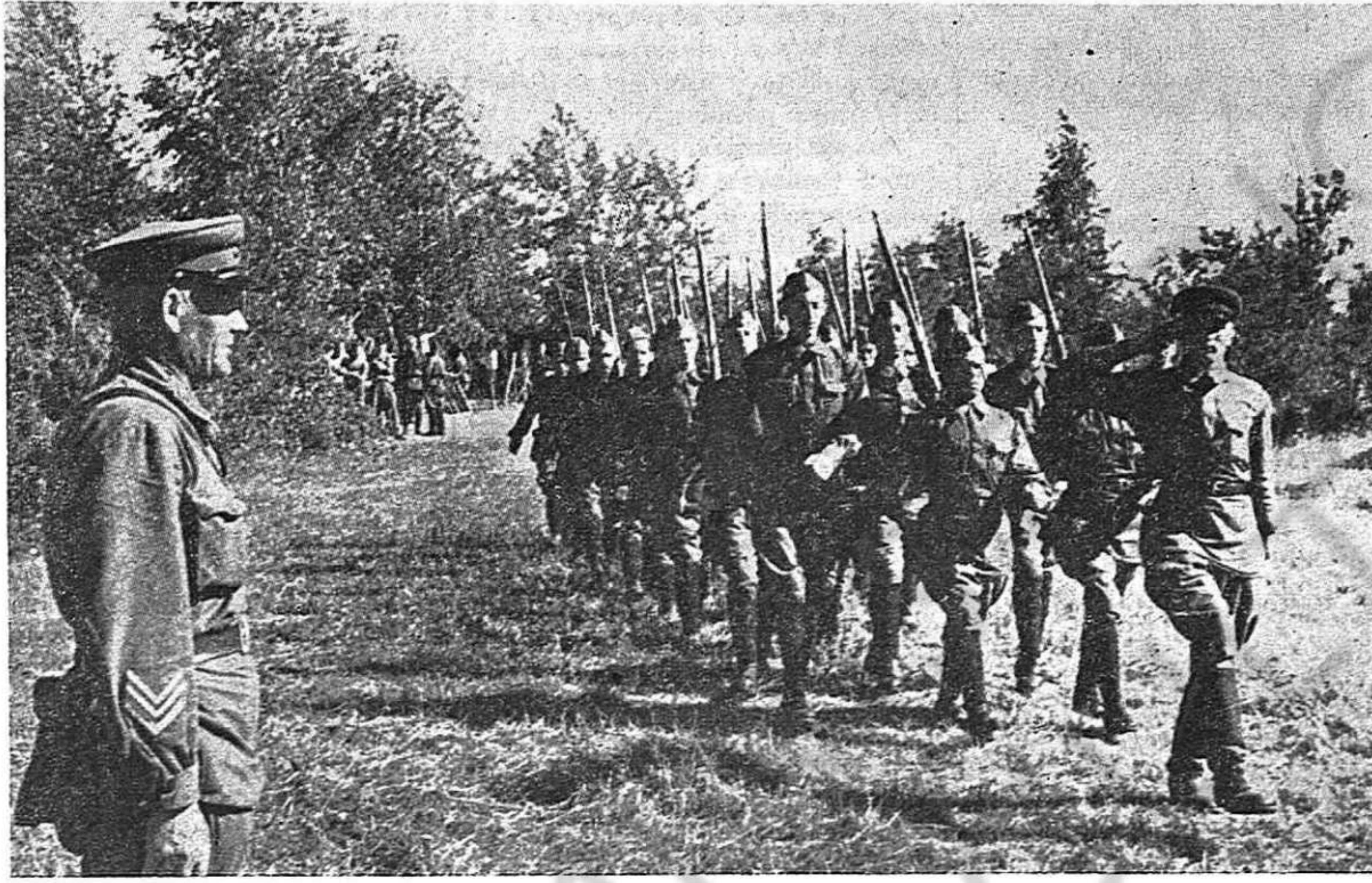
Instrucción de nuevos soldados en la URSS.

¡Únicamente así, los que nos llamamos hoy al abrigo del salvajismo nazi, seremos dignos, el día de mañana, de la victoria tan dura y heroicamente lograda!