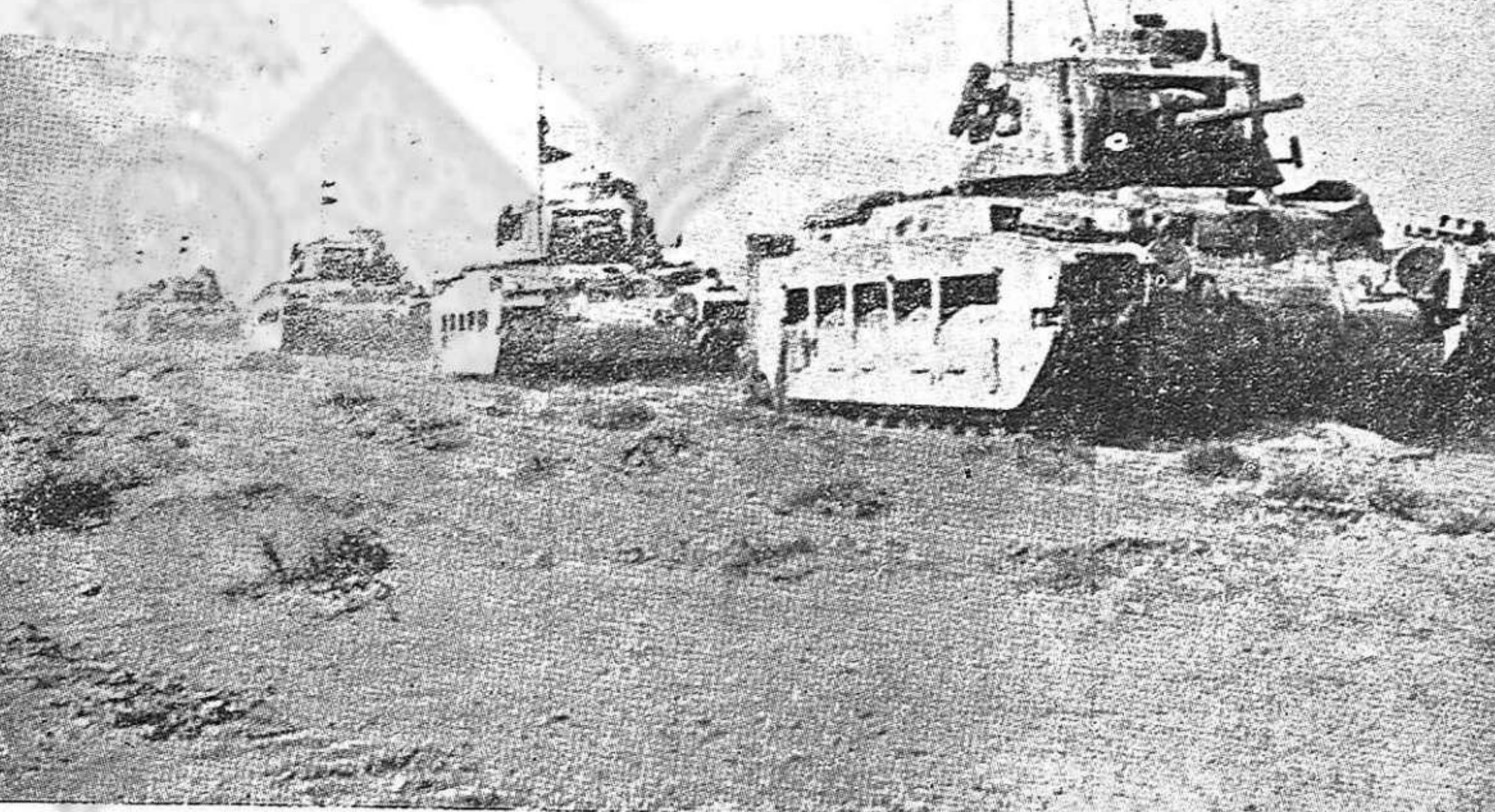
Tanques británicos en los desiertos de Libia.

Falange carece del menor prestigio entre la población. Se entra en un café. Todo el mundo habla de Falange, pero todo el mundo habla mal. Aunque interesantes y reveladoras de un estado de opinión poco valdrán las murmuraciones y las críticas por sí solas. Se hace preciso que la parte más consciente y activa del pueblo se esfuerce por canalizar ese descontento. En la Unión Nacional caben todos aquellos que están dispuestos a luchar por la independencia de España, por el derrumbamiento de Franco, contra los nazis que se ensañan del país. En ese frente nacional todos los que se hallen en esa disposición tienen un puesto para la acción antihitleriana y patriótica.