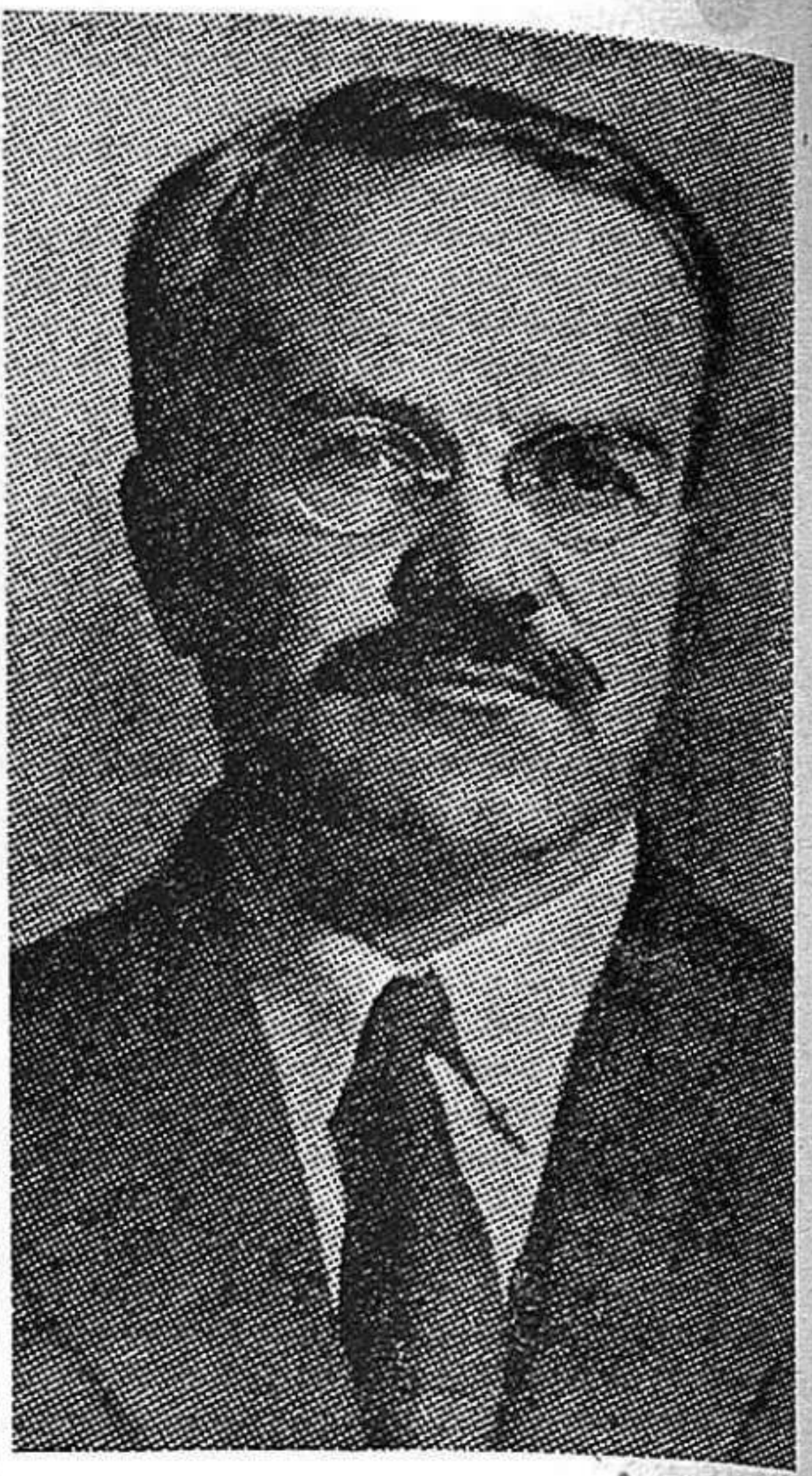
M O L O T O V