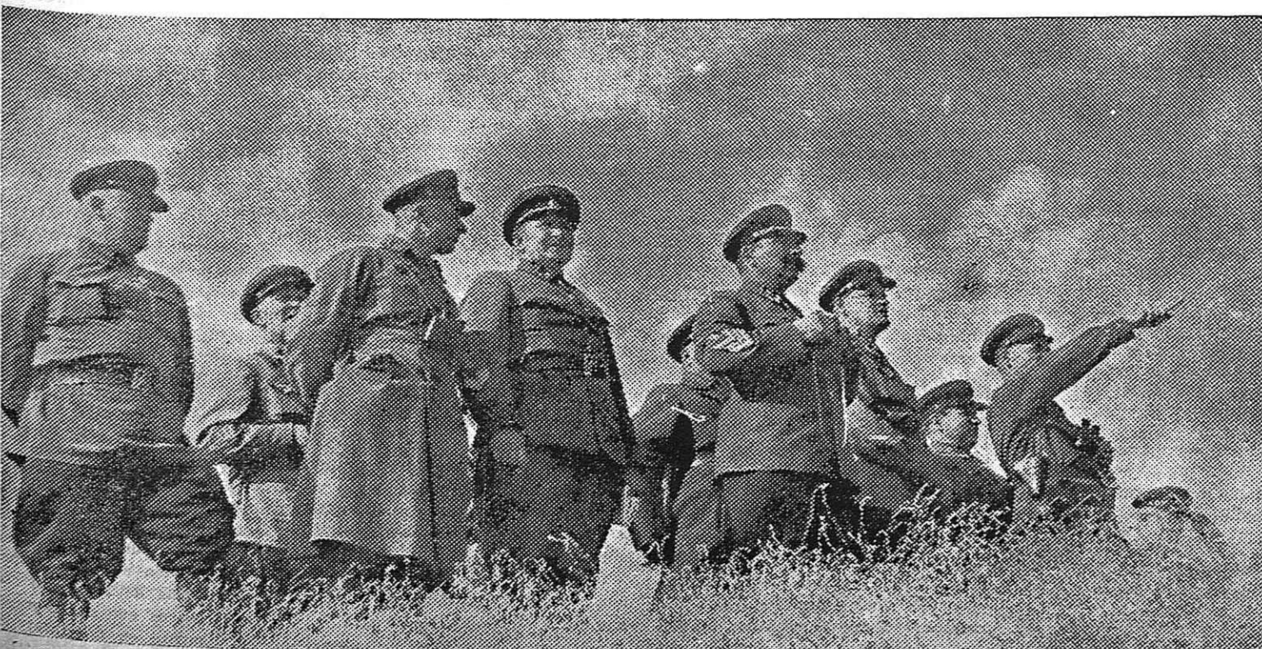
El mariscal Budionny con altos jefes soviéticos, dirige unas maniobras.