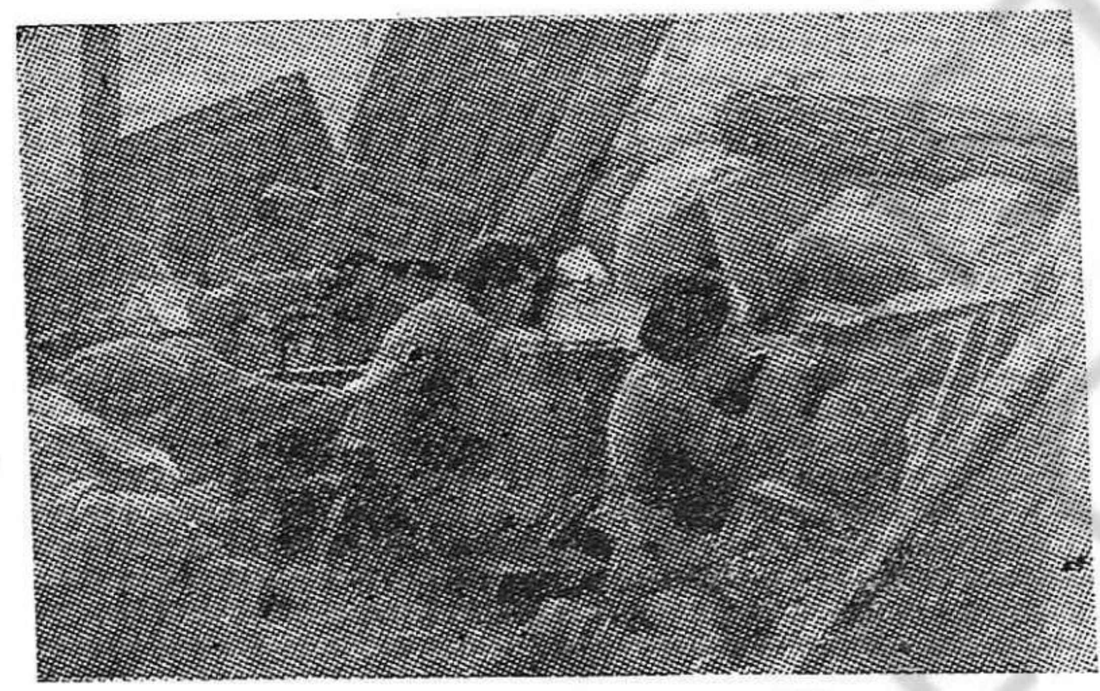
Con la fe y el ardor de las jornadas de nuestra guerra, luchemos hoy en defensa de la Unión Soviética.