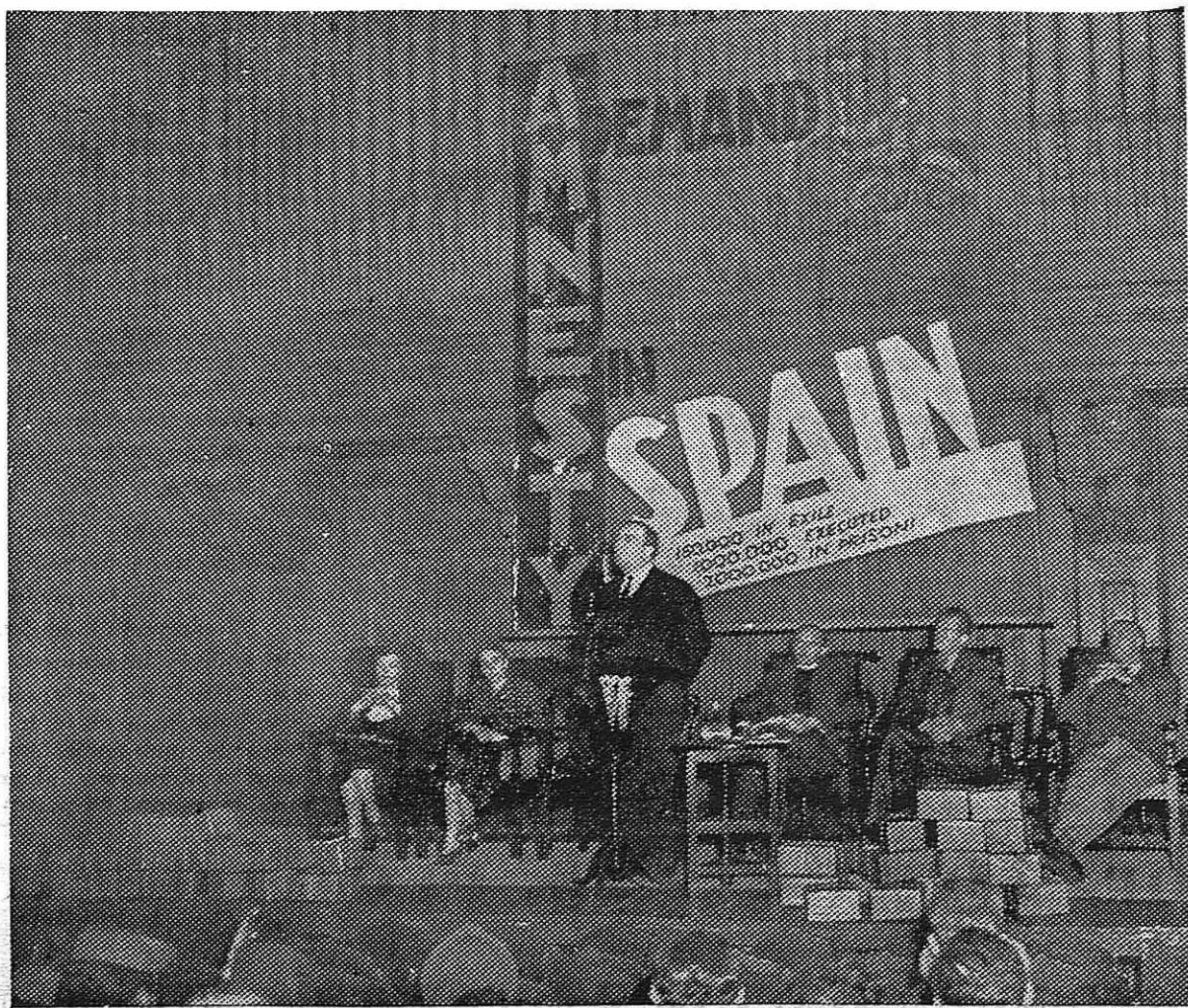
Para protestar contra las deportaciones de refugiados españoles al Sahara, días pasados se celebró un gran mítin en Brooklyn, N. Y.

mos hecho, los agentes del franquismo y la Falange, que con mil disfraces y fuertes fondos de repitiles merodean por la República Mexicana, propician acciones provocadoras que tengan por virtud dar falsos fundamentos para descreditar políticamente a la emigración española. Basta leer con detenimiento las publicaciones que enmascaradamente hace aparecer Falange española en México y otros órganos a los que llegan los hilos de inspiradores y remuneradores de la Falange, para convenirse de a quién interesan hechos de esta índole, quién los prepara moralmente, y quién mueve y alimenta la campaña de ataque y calumnias contra toda la emigración. La propia emigración debe mostrar una vigilancia permanente y aguzada que frustre toda acción de las gentes miserables de Falange, avanzadilla en tierras americanas del sangriento régimen franquista y de las bestias carniceras nazis.