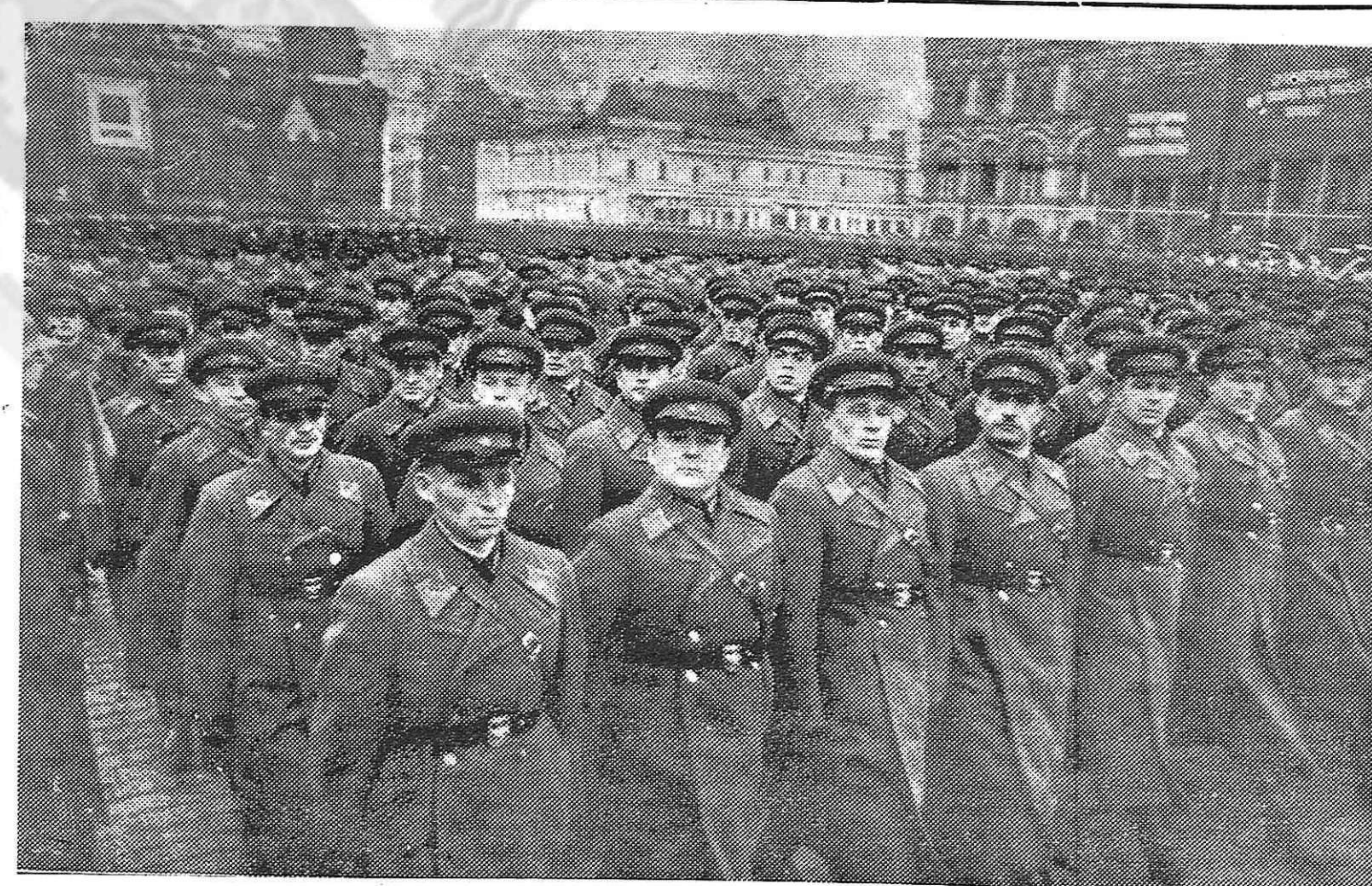
Un desfile de oficiales del Ejército Rojo.

narlos en la sombra. En defensa del pueblo español, en defensa del gran pueblo sovié tico, en defensa de todos los pue blos americanos, todos los emi grados españoles al lado y del brazo de los obreros y campesinos americanos, deben infringir gol pes exterminadores a esa horda de criminales, espías y saboteado. des que lleva el exacerado nombre de Falange. Sin minuto de reposo, con reso lución y firmeza, en bien de nues tro pueblo, en bien de los pueblos de América, en bien de la gran, diosa lucha del pueblo soviético, ¡APLASTEMOS A LA FALAN GE Y A LOS AGENTES NAZIS SIN MIRAMIENTOS!