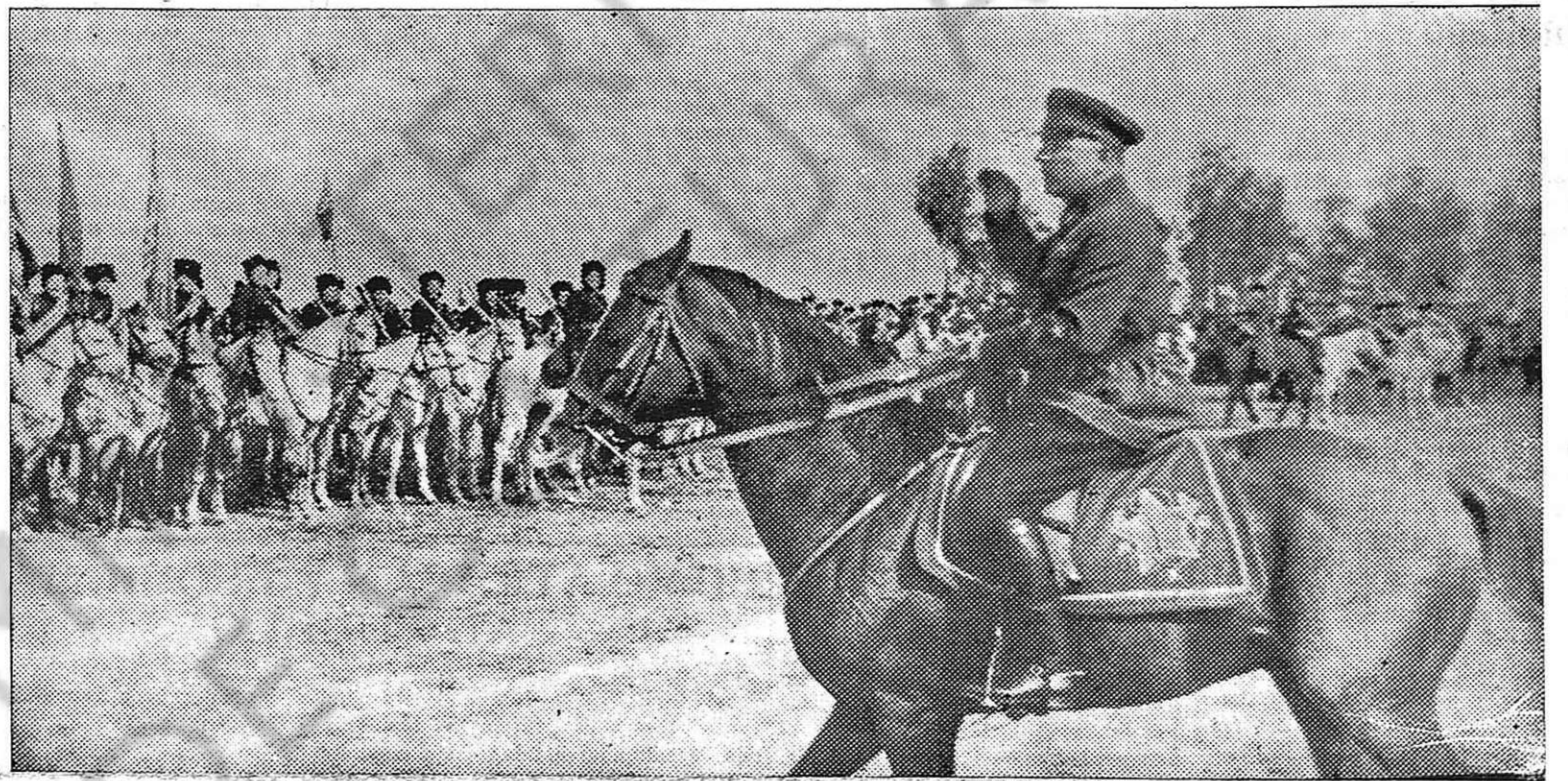
El mariscal Vorochilov durante una revista.