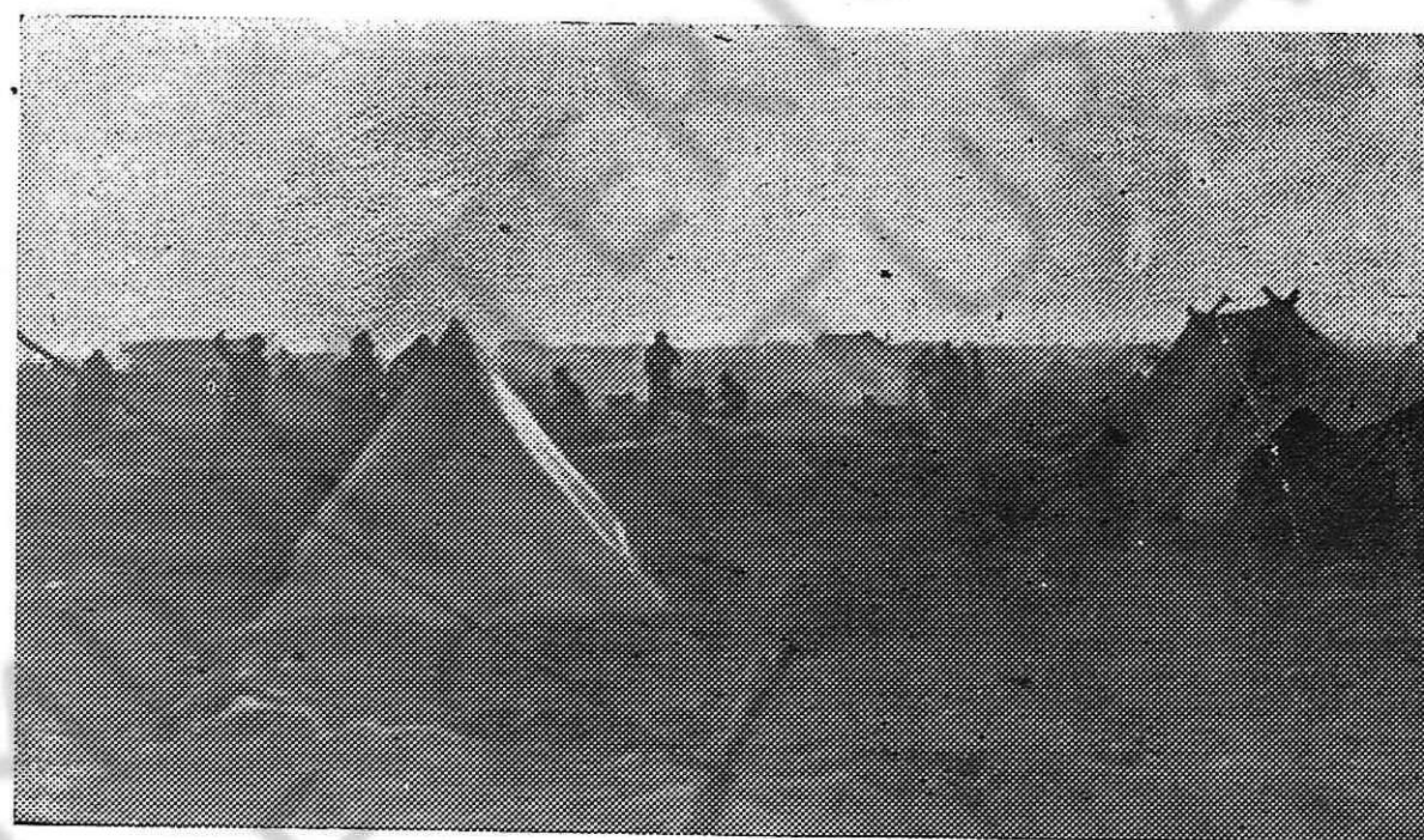
EL CAMPO DE ARGELES EN LOS PRIMEROS TIEMPOS.

El semanario reaccionario 'Gringoire' al servicio de los nazis pide que nuestros compatriotas sean físicamente eliminados