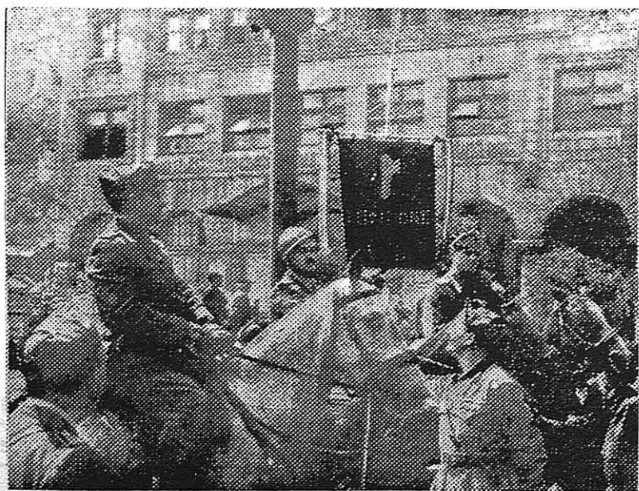
Soldados italianos de la División Littorio, en Santander.