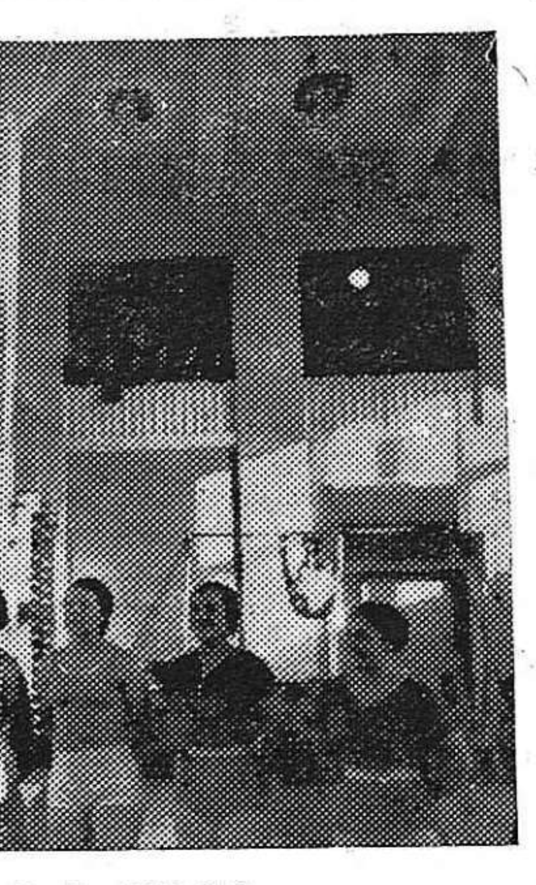
Un gimnasio de la U.R.S.S.

importancia, en nuestro próximo número dedicaremos un artículo a examinar detalladamente las experiencias y conclusiones que de este panorama que ofrece Cataluña es necesario extraer).