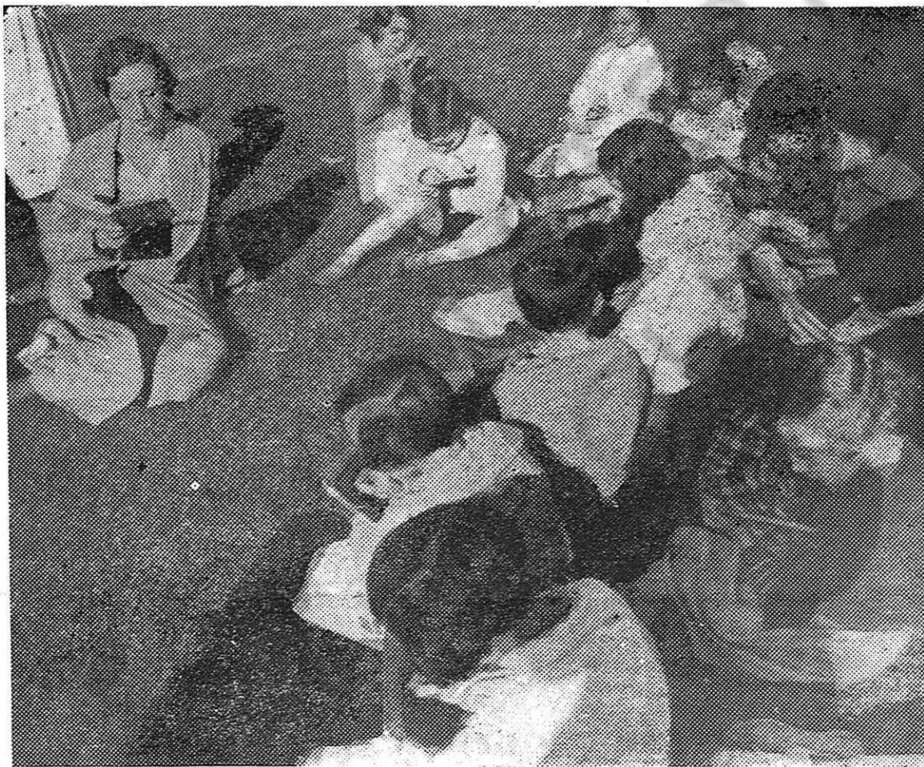
Durante nuestra guerra las madres españolas disponían de guarderías donde eran atendidos

Ya conocemos por repetidas informaciones cómo las mujeres españolas no se resignan con esta situación y cómo luchan valerosamente por abatir al régimen, causa de su dolor y su miseria. Nuevamente en uno de nuestros próximos números, a la vista de las últimas noticias, consignaremos la situación actual en que se encuentran las mujeres de nuestro país, el alcance de su lucha ejemplar y sus reivindicaciones fundamentales.