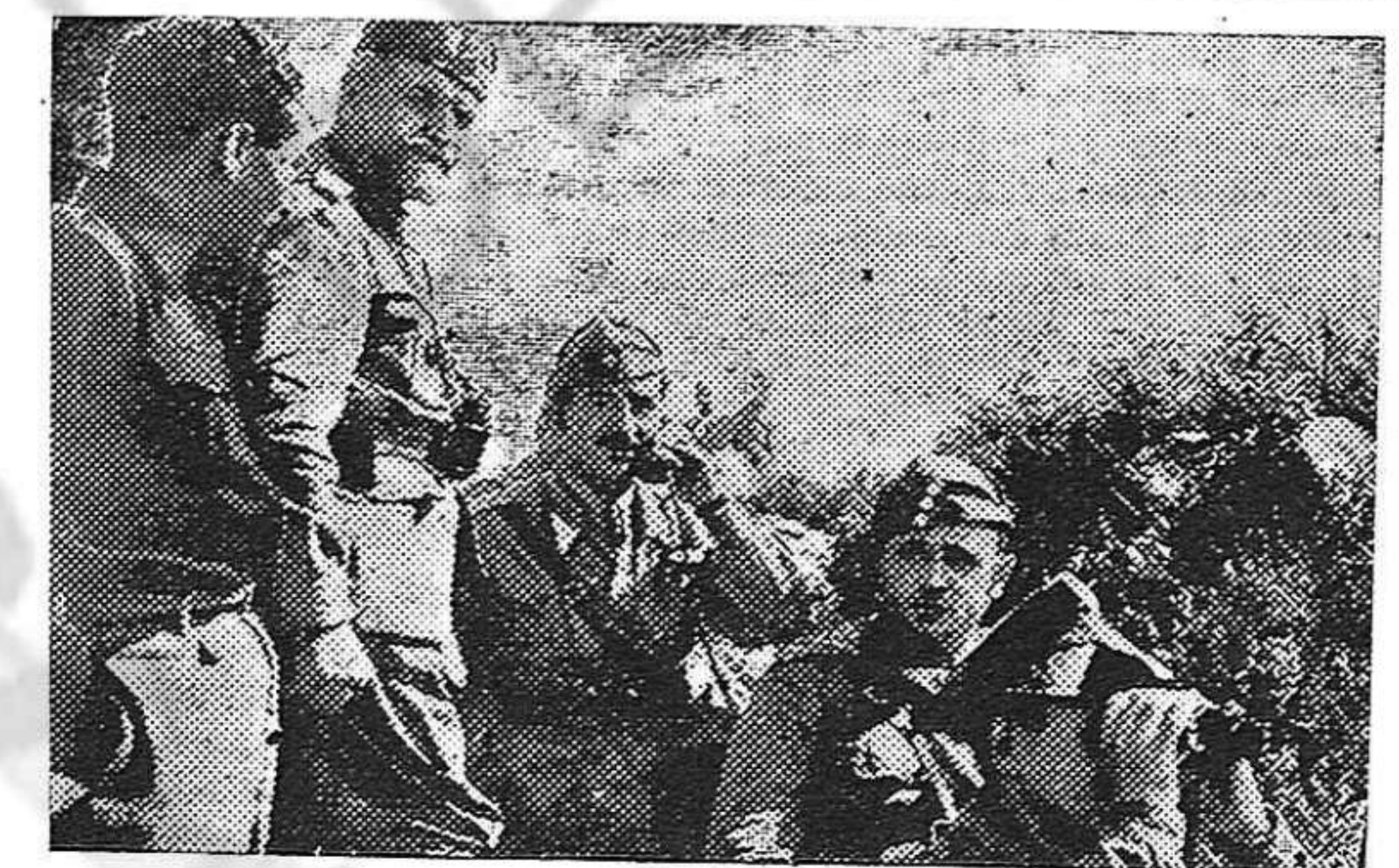
Jefes del Ejército italiano operando en los campos invadidos de Cataluña

Las carreteras que conducen a Barcelona son recorridas por multitudes demacradas y hambrientas que buscan algo que comer. A las mujeres y a los niños se han agregado los hombres. Caminan cuarenta, cincuenta kilómetros. A veces más. Han de burlar los controles de vigilancia. Si vuelven cargados, cosa no muy fácil, han de hacerlo de noche, a campo traviesa. Y cuando han