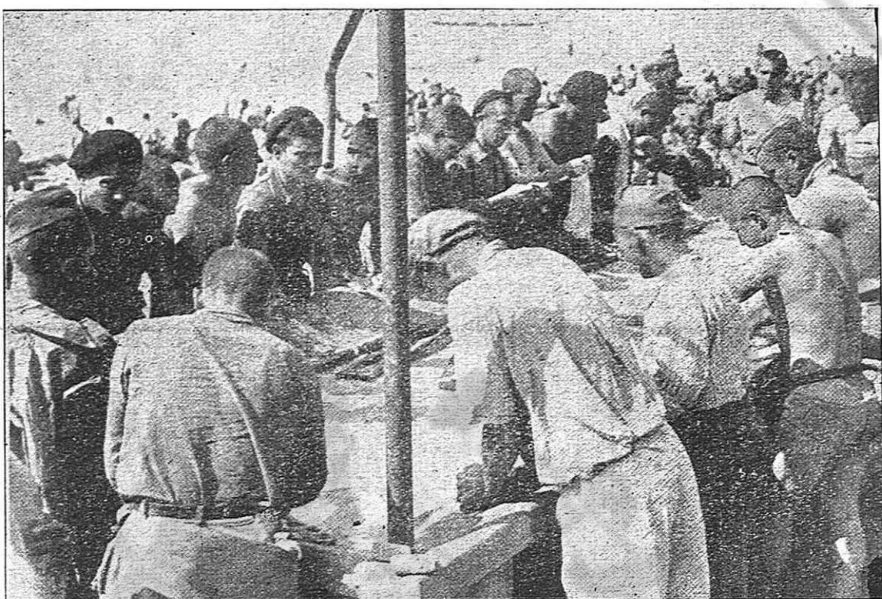
Combatientes de la República española en un campo de concentración de España. Su liberación, como la de todos los españoles prisioneros de Franco, ha de ser una cuestión de honor para todos los pueblos de América.

mente en dónde y en qué radican sus intereses. ¿Qué podría darle la guerra imperialista, si no es más muerte y más ruina aún en el caso de que España formara en el bando de los imperialismos que hasta hoy aparecen como victoriosos? Absolutamente nada. Se beneficiarían, en todo caso, los capitalistas españoles; EN TODO CASO, porque el precedente de los capitalistas italianos, apartados del reparo del botín por sus aliados al ser firmados los tratados de paz de 1918, es un precedente que seguramente no habrán olvidado. Pero no el pueblo. Con victoria franquista o sin ella; con colonias o sin colonias; con Gibraltar y sin Gibraltar, el obrero español seguiría a merced de la explotación de "su" patrono, el campesino entregado