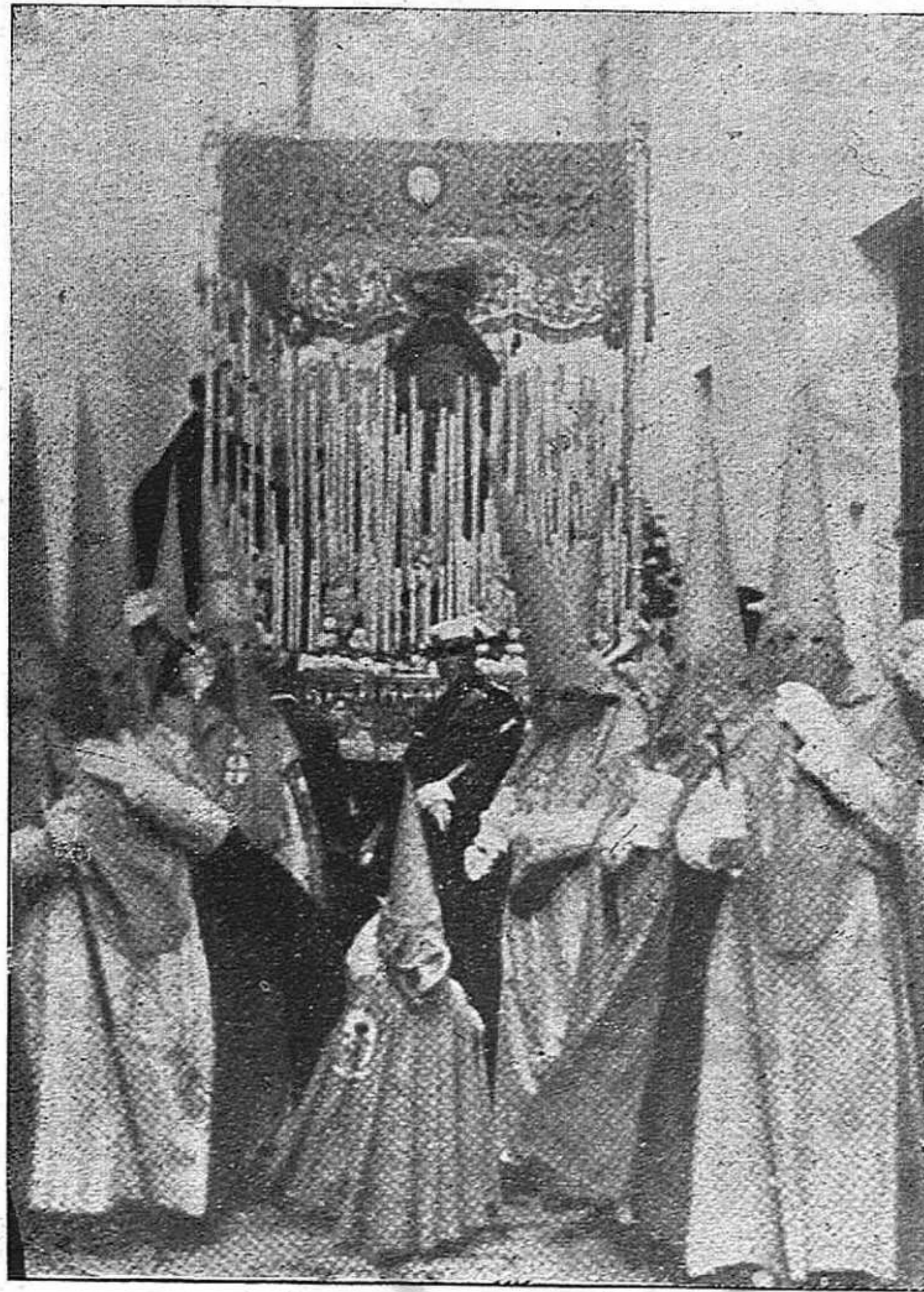
Desfile de guardias civiles, santos, curas y penitentes, por las calles de una ciudad de España. La estampa no es de la época fernandina, corresponde a la España negra de Franco.