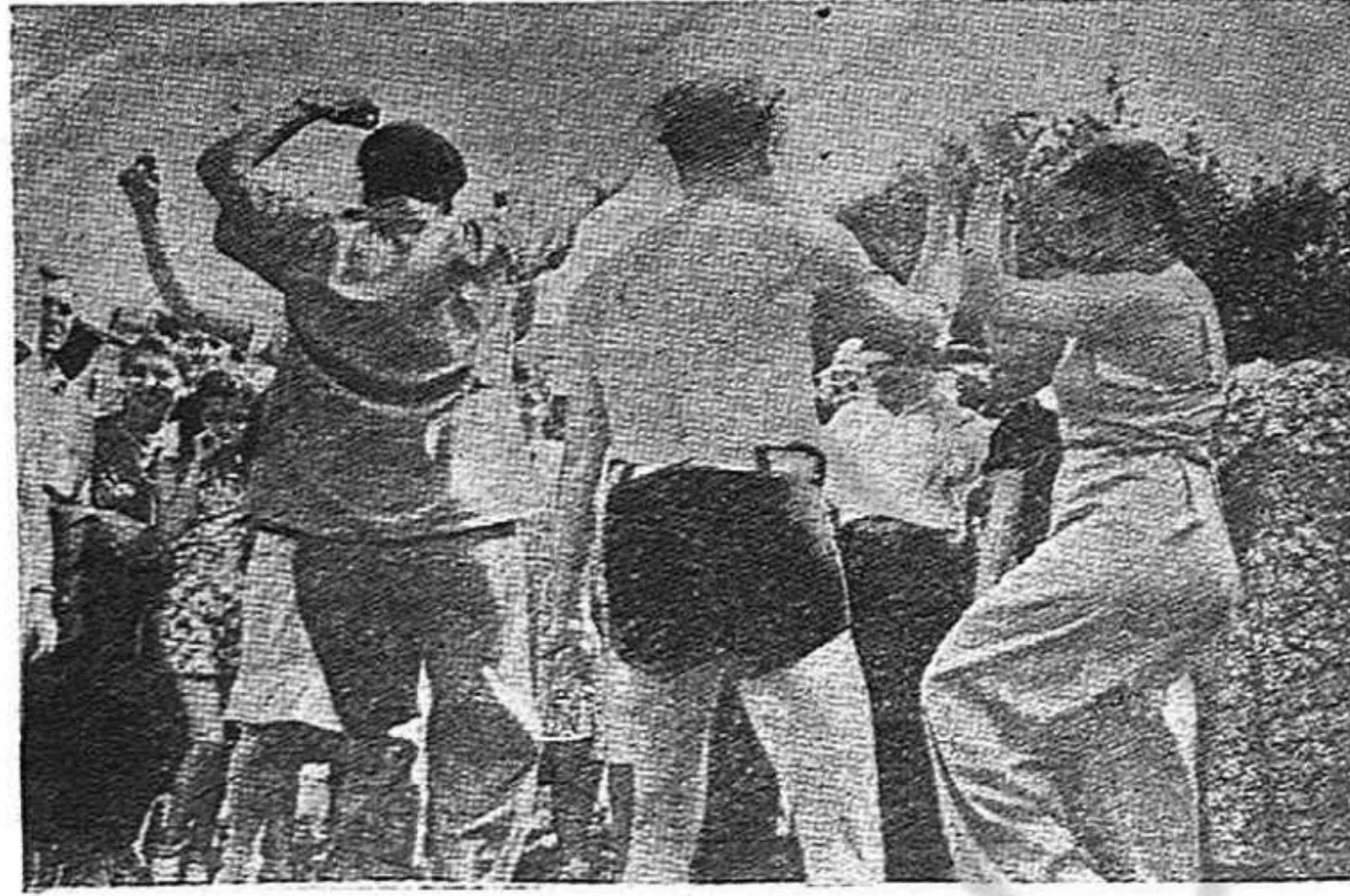
Aspecto de un festival de ayuda a los refugiados españoles en Francia, celebrado recientemente en Nueva York. La solidaridad americana debe ser redoblada para salvar de la muerte segura a decenas de miles de combatientes de la República.

"La solidaridad con los perseguidos es algo maravilloso; obreros, pequeños comerciantes y artesanos ayudan cuanto pueden. Millares de perseguidos viven ayudados por familias con escasísimos medios de existencia, pero que comparten con ellos, en muchos casos incluso sin conocerlos. Por todos los sitios se hacen colectas para los presos y perseguidos; en las fábricas, en las casas, entre los comerciantes, y si ésta no se desarrolla más es porque es difícil encontrar alguien que no tenga que atender a los suyos. Los pueblos de Galicia, Santander, Asturias y León ayudan a los guerrilleros que se encuentran en los montes a los que, en muchos casos, alimentan, atienden a sus enfermedades". (Continuará)