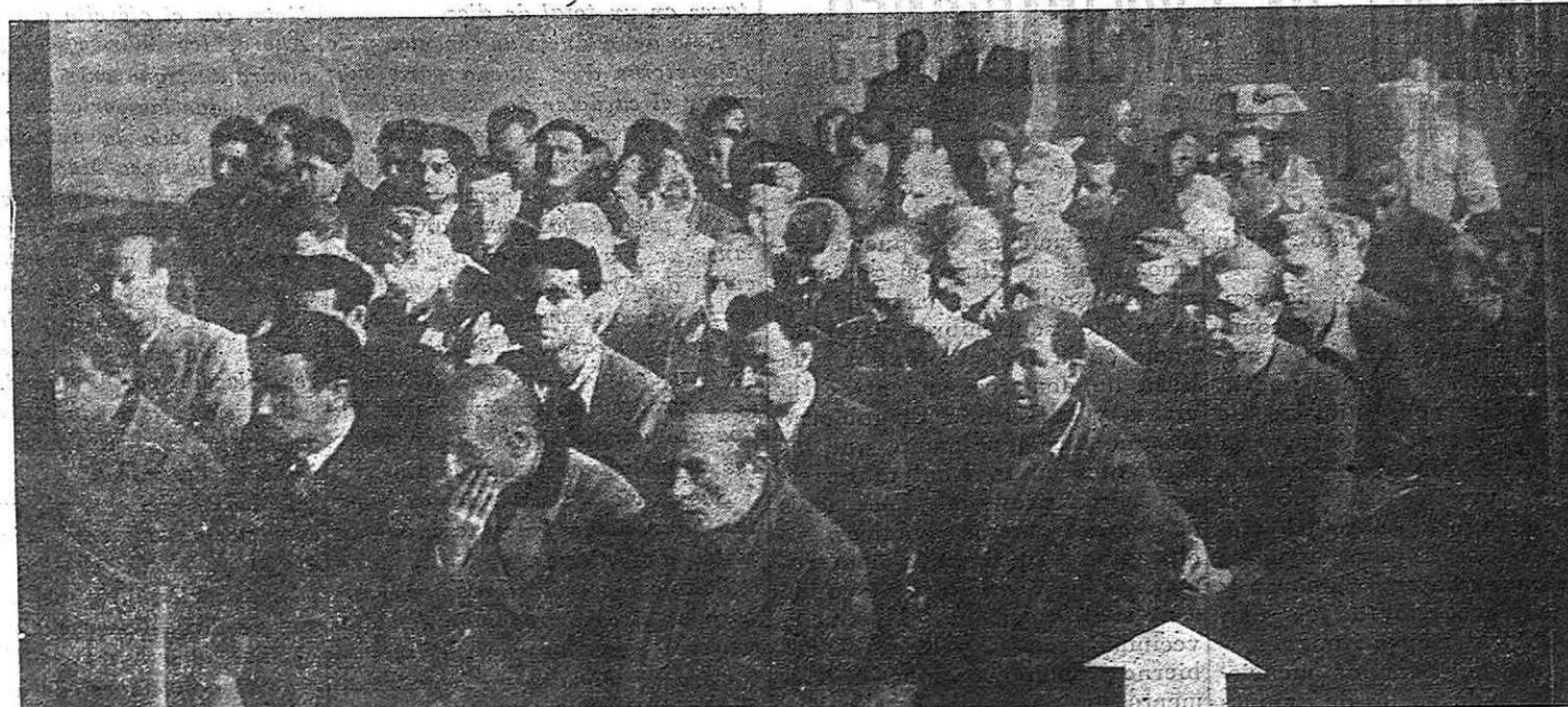
Un considerable grupo de obreros e intelectuales de Madrid, comparece ante un Consejo de Guerra franquista, el cual dictó pena de muerte para todos los acusados. Pero este crimen monstruoso, este trato salvaje que recibe nuestro pueblo martirizado, ni le hace ceder ni capitular en su lucha heroica y gigantesca contra Franco y su régimen. Al final, la victoria será suya.

La hora es grave para el pueblo español. A la miseria y a la bestial represión que se le impone, se añade, cada día más, el peligro de la guerra. Y hay que evitarlo, hay que trabajar fuera de España por impedir este crimen monstruoso como nuestros compatriotas luchan dentro de ella para evitarlo. Hay que hacer todos los esfuerzos, hay que poner en juego todos los medios, para conseguir que España quede fuera de la matanza imperialista.