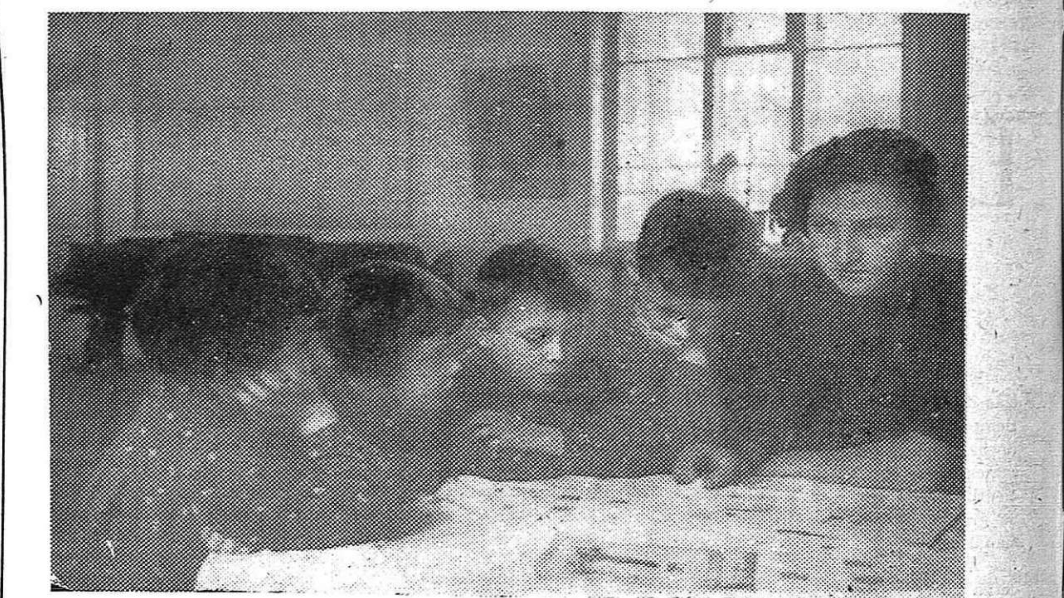
En los países capitalistas, la guerra de rapiña y exterminio, no distingue de víctimas. Miles y miles de niños inocentes pagan con sus cuerpos destruidos por la metralla, las cuentas a saldar entre los bandidos imperialistas. Mientras la infancia de media Europa vive y padece en esta situación, la de la Unión Soviética se desarrolla cada día más fuerte, alegre y feliz por la ruta dichosa del socialismo, que es la ruta de la paz.