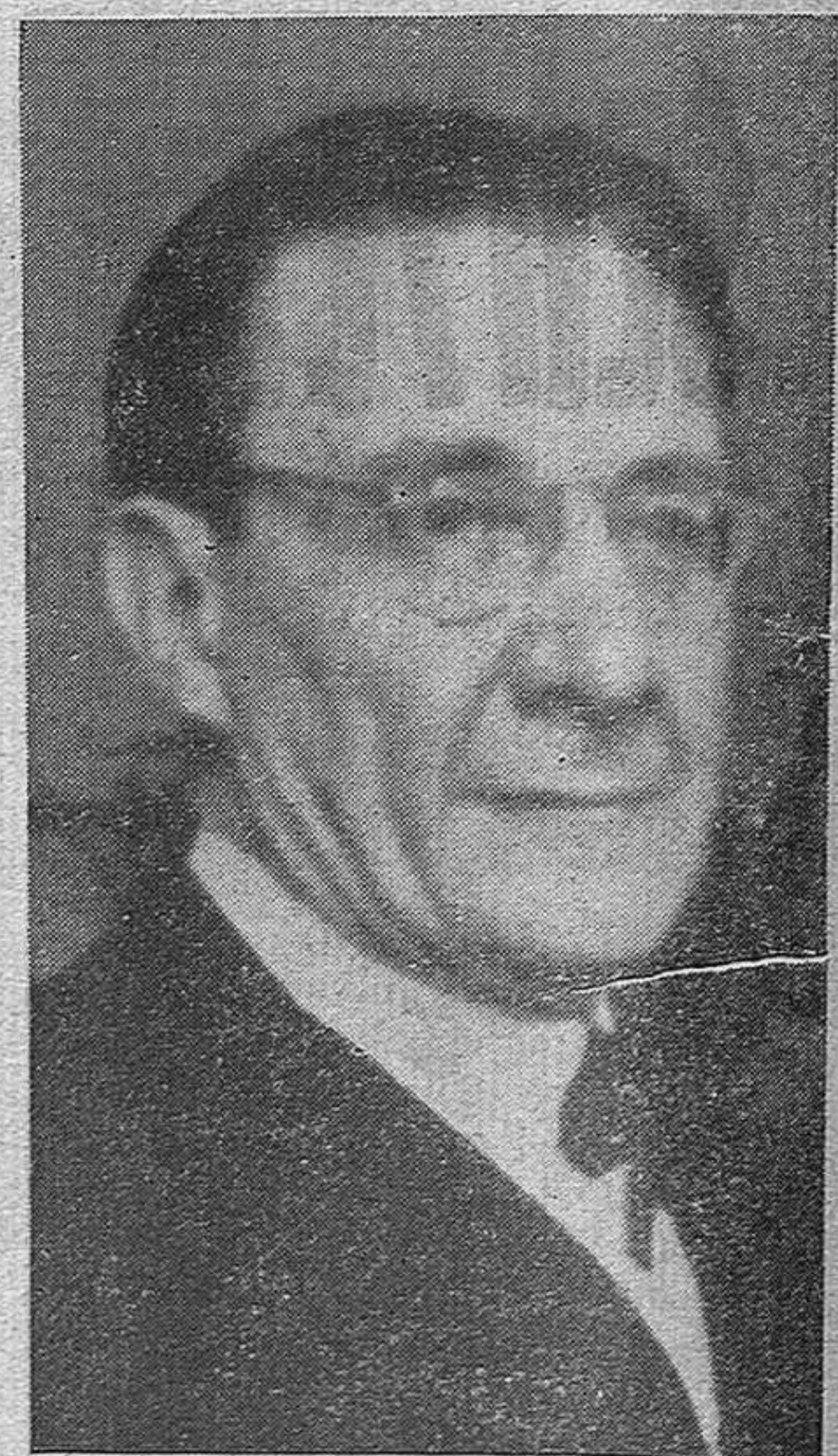
Excm. Sr. Lluís Nicolau d'Olwer, Embaixador de la República Espanyola a Mèxic.

Catalans a Mèxic" i agraeix i es fa seves les expressions de l'Excm. Embaixador d'Espanya, a la vegada que promet