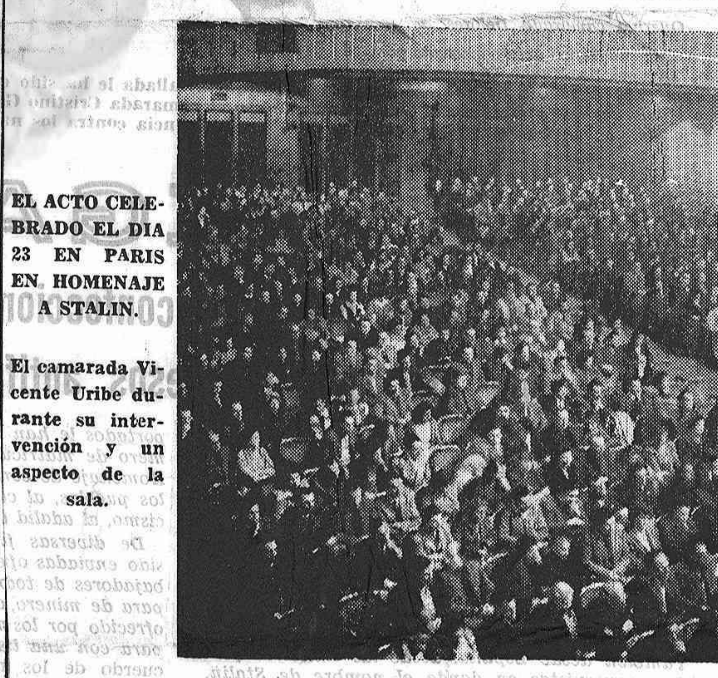
EL ACTO CELEBRADO EL DIA 23 EN PARIS EN HOMENAJE A STALIN.

El Comité Central del Partido Comunista (bolchevique) de la U. R. S. S. El Consejo de Ministros de la U. R. S. S.