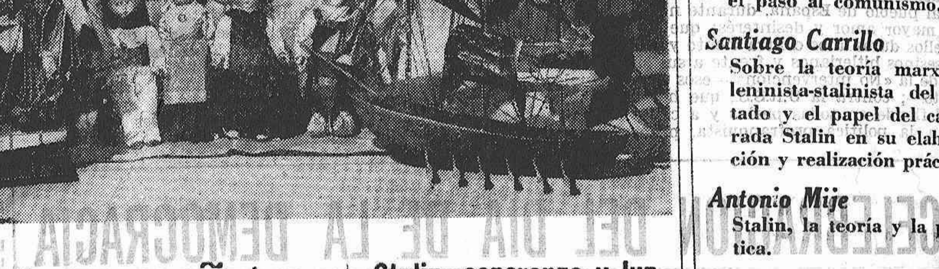
Resumen de cartas de felicitación de otros países: Chile, México, España, etc.