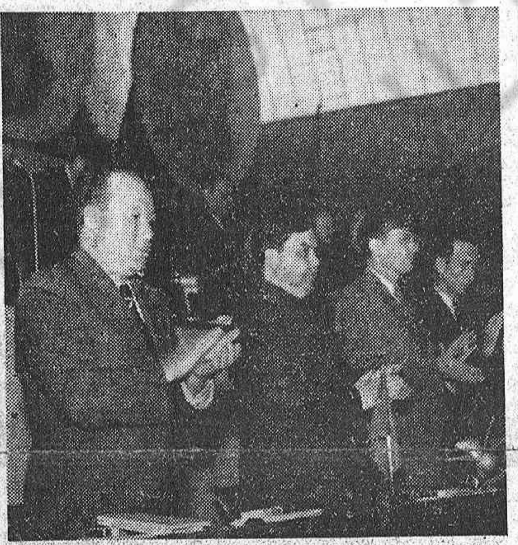
La delegación del P. C. (b) de la U.R.S.S. De izquierda a derecha: F. F. Yudin, S. N. Malenkov y N. S. Suslov.