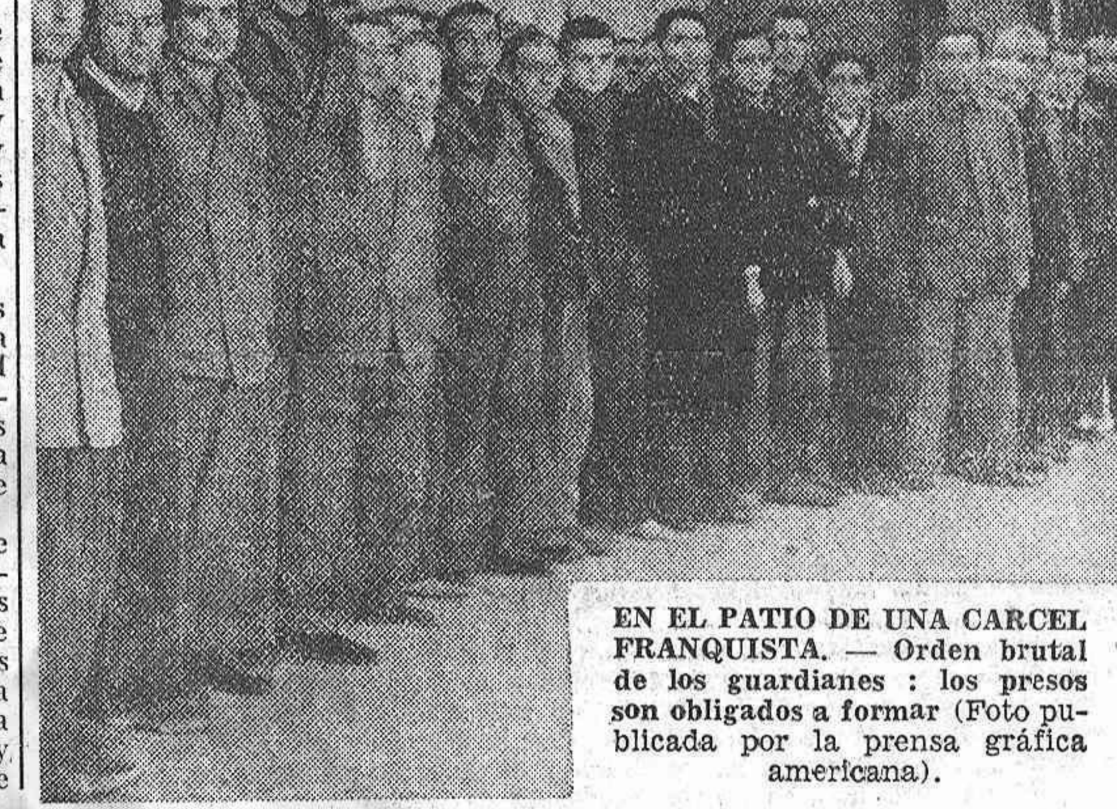
EN EL PATIO DE UNA CARCEL FRANQUISTA. — Orden brutal de los guardianes: los presos son obligados a formar.

En la asamblea fué puesta de manifiesto esa responsabilidad y se decidió pedir la ejecución de las obras de regadío que habían sido iniciadas bajo la República e interrumpidas por el franquismo.