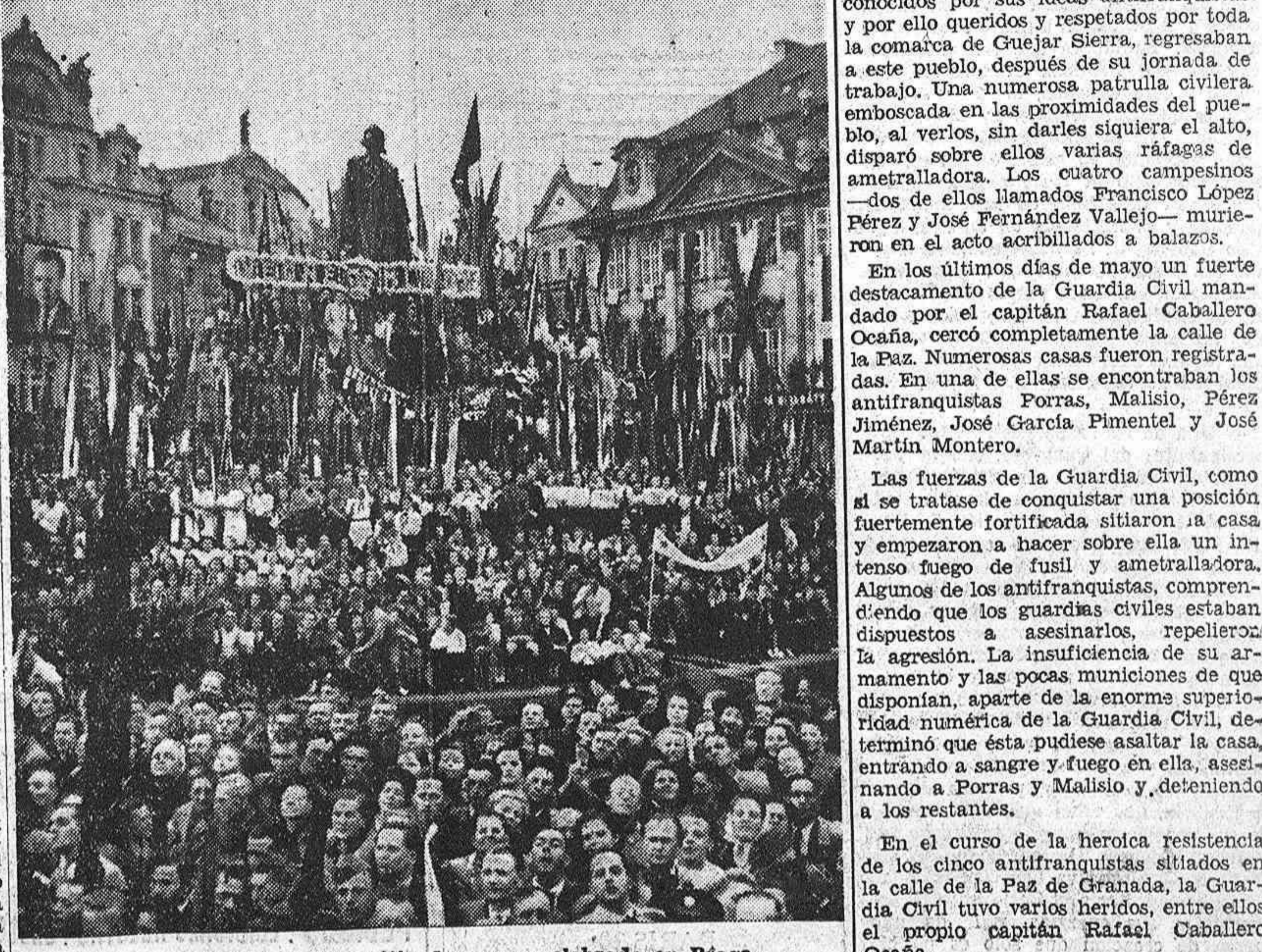
Un aspecto del gran mitin de masas celebrado en Praga.