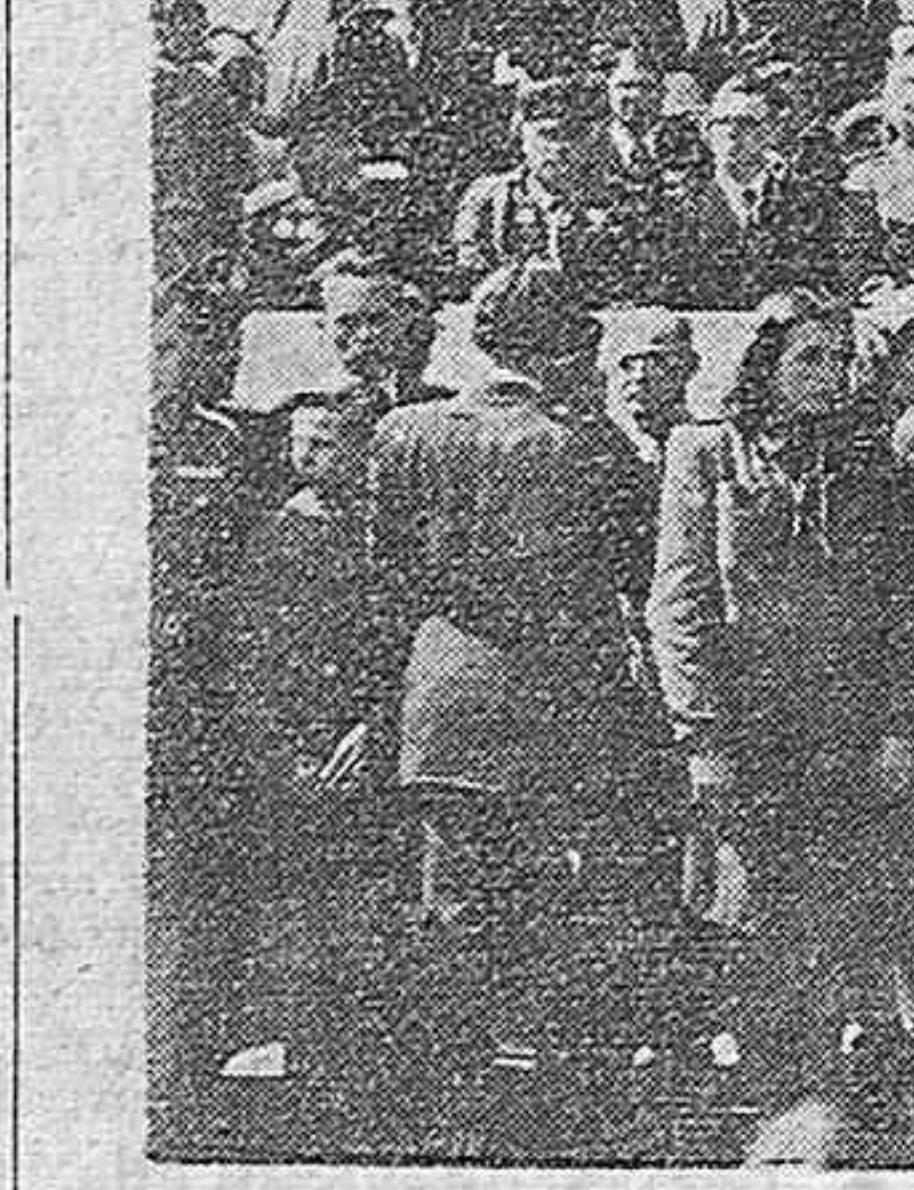
Después del Congreso Guerrillero, la presidencia del mitin de clausura en Praga. Se encontraban en ella el general Sbovoda, ministro de Defensa y jefe del Ejército checoslovaco, el capitán Sínuki, secretario general del Partido Comunista, presidente de la Federación Guerrillera checoslovaca, el general mayor Koupak, de Ucrania, el general Tejtek, ministro sin cartera de Bulgaria, el coronel Zúlas, organizador de ELAS, y el general mayor búlgaro Terpevov y el coronel Yulovskí Krdzic.

—Después, ¿has estado en Yugoslavia? —Sí, he estado en Yugoslavia un momento de emoción indescriptible.