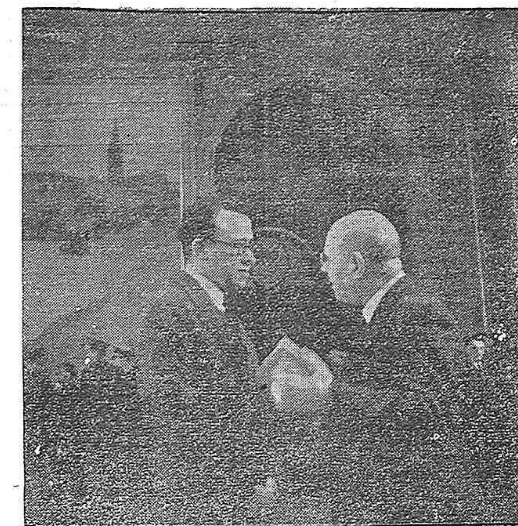
El 13 de junio, la Alcaldía de Toulouse ofreció, en la Sala de los Ilustres del Capitol una recepción a Pablo Casás. Nuestro camarada Santiago Carrillo, que representó al Gobierno de la República conversando con el genial artista.