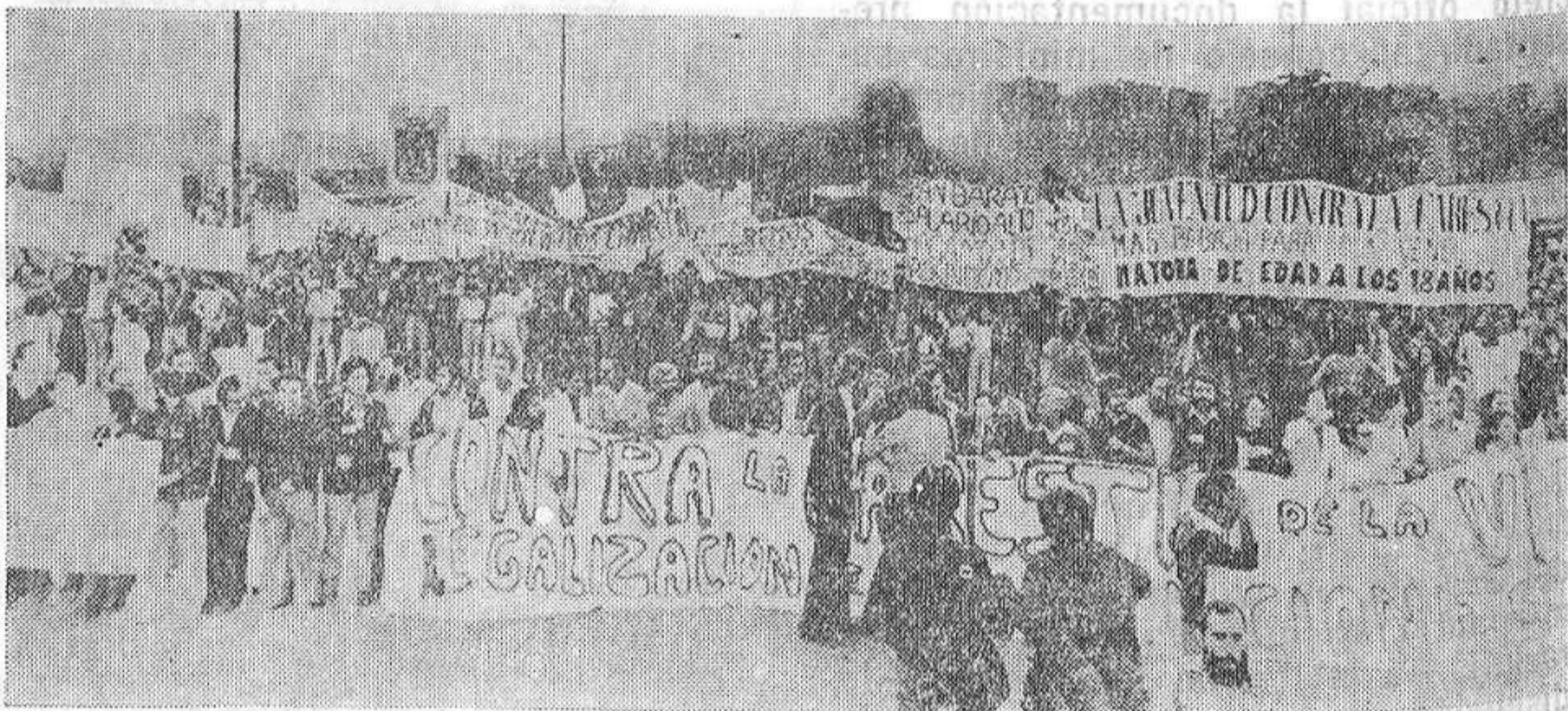
125.000 personas se manifestaron en la barriada madrileña de Moratalaz contra la carestía de la vida. El «otoño caliente» ya está en marcha.

El Comité del P.C.E. en los países de Benelux acuerda realizar un esfuerzo extraordinario para llevar a las organizaciones y a las masas emigradas la información y discusión que de todo lo expuesto se desprende, con el objetivo de compenetrarnos lo mejor posible con la nueva situación de España e impulsar TODAS las actividades regulares de Partido en los países del Benelux.»