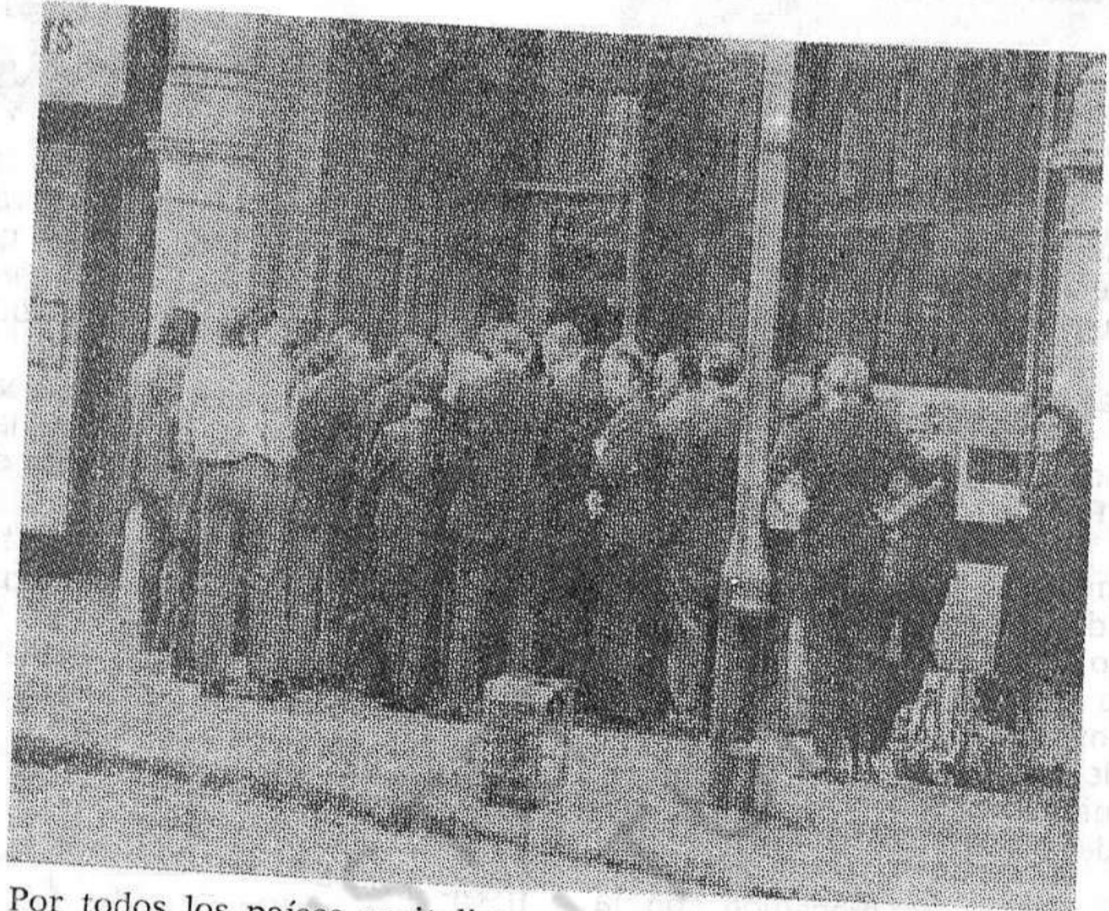
Por todos los países capitalistas, colas interminables de obreros parados esperando empleo. Y sobre todo, emigrados.

Un mejoramiento no puede producirse, ha dicho Canónica, si los trabajadores no pueden participar en la gestión y control democrático de las empresas, y de la economía del país.