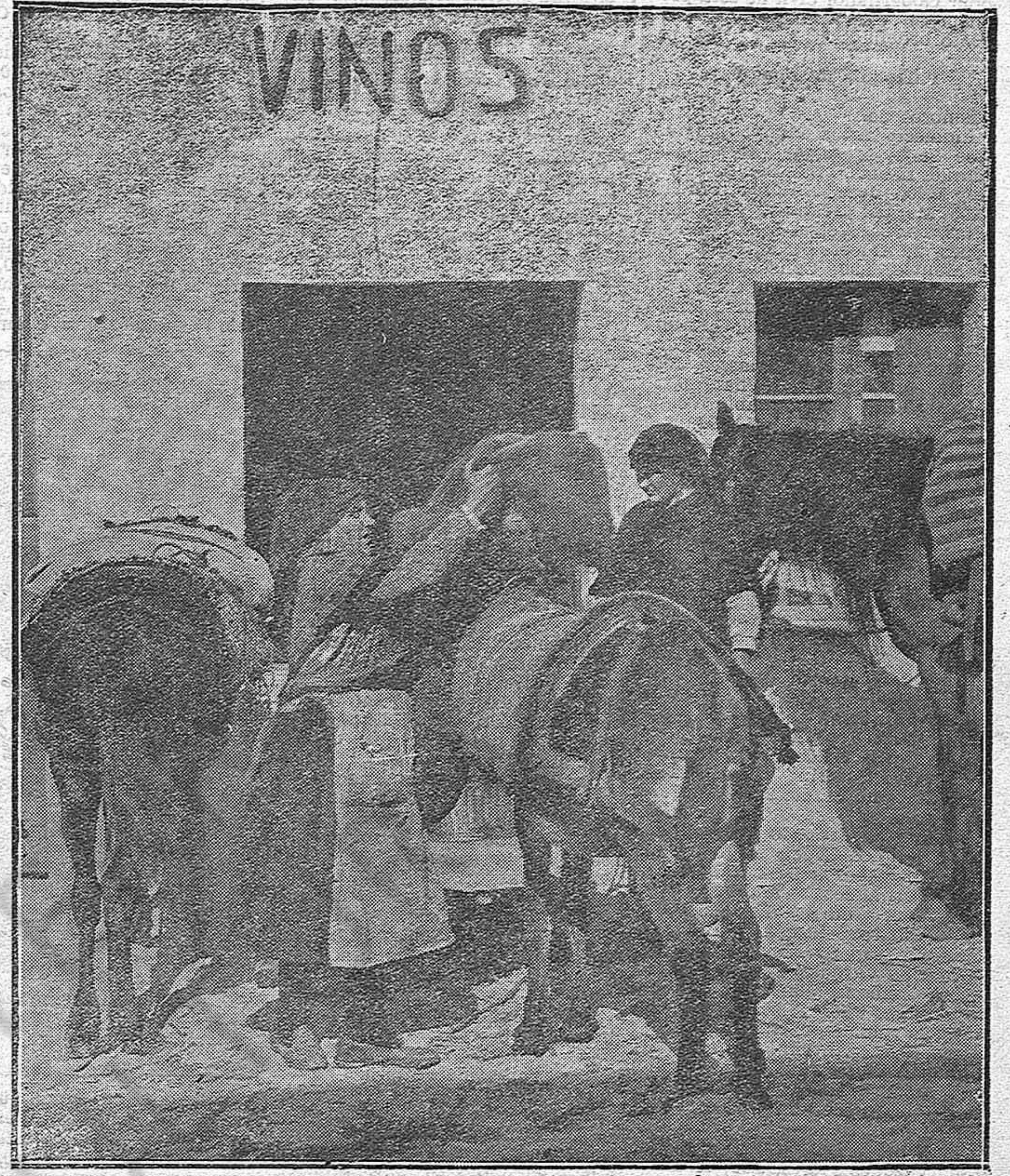
Escenas típicas del día de hoy en Lugo

En el día de la Octava del Santo, después de las Horas Canónicas de la mañana, la reliquia es conducida nuevamente con igual solemnidad a la Capilla del Pilar, donde se celebra misa solemne con asistencia del ilustrísimo Cabildo.