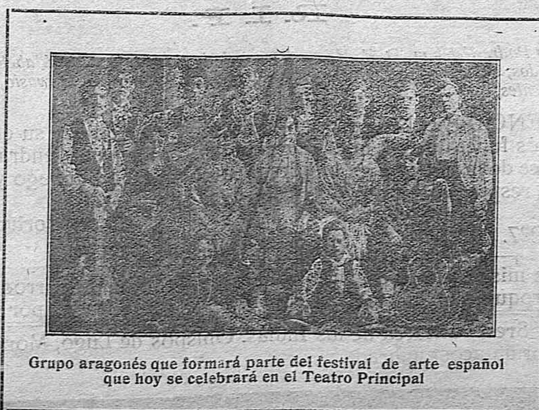
Grupo aragonés que formará parte del festival de arte español que hoy se celebrará en el Teatro Principal

Se me dirá que este plan previsor es fácil de seguir en las capitales; pero no así en pueblos y en aldeas. No es cierto; en las poblaciones rurales se