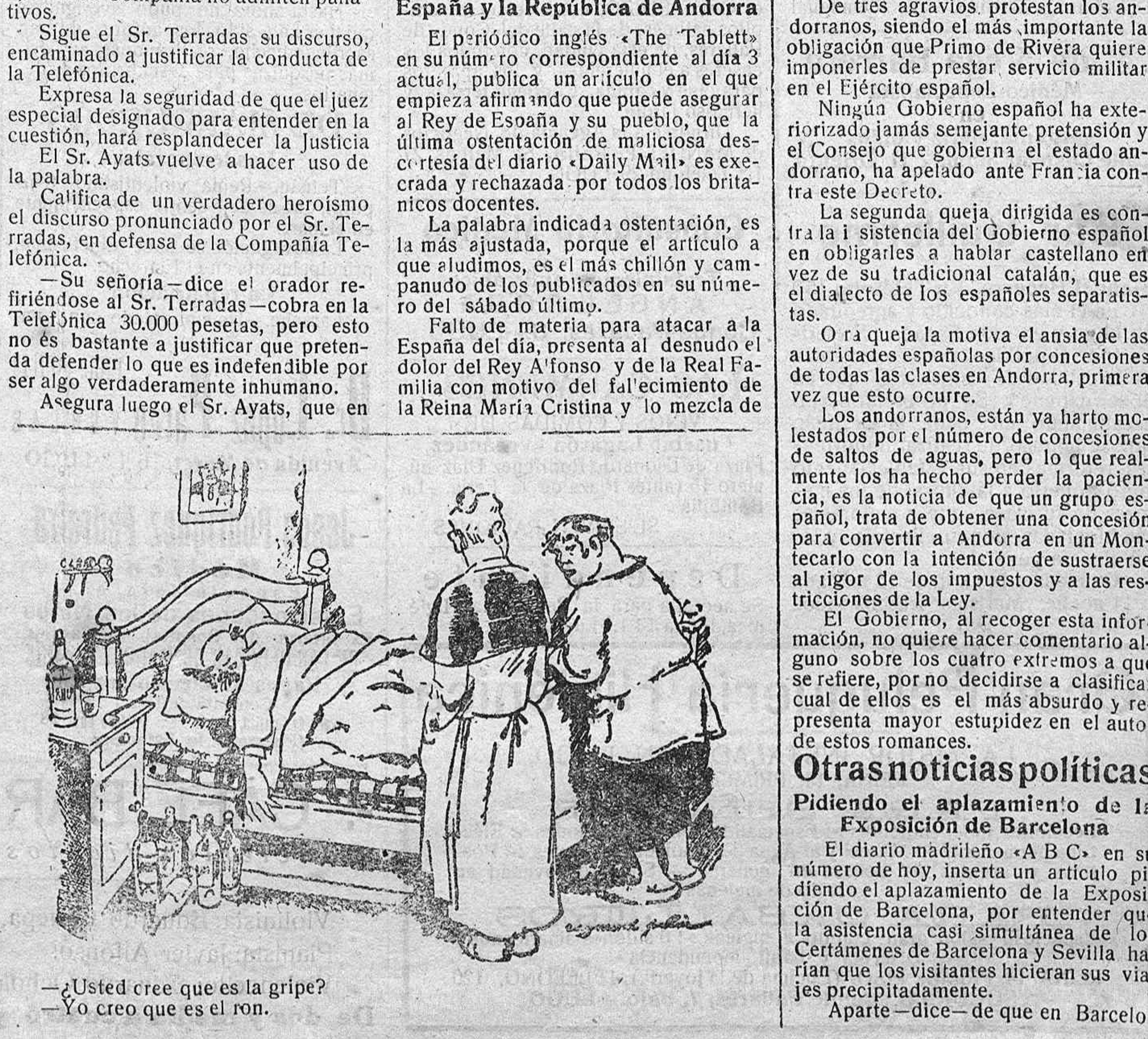
—¿Usted cree que es la gripe? —Yo creo que es el ron.