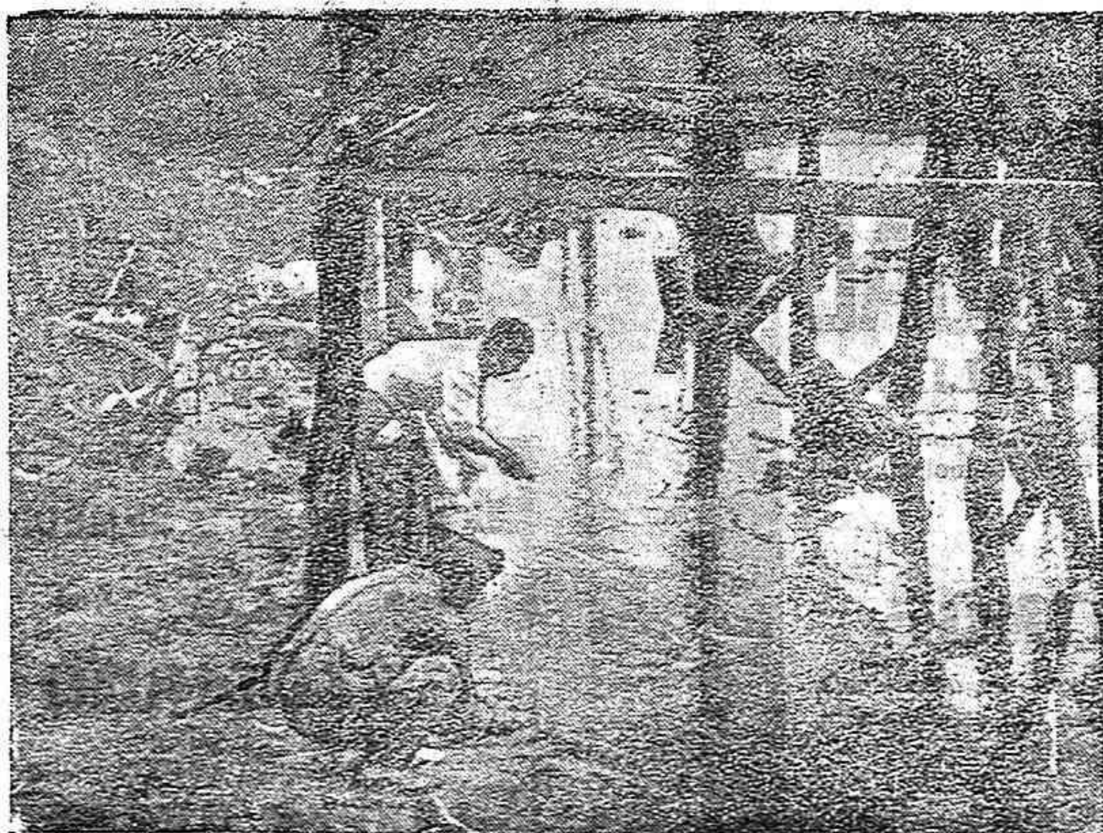
Soldados haciendo su toillet al regreso de las trincheras