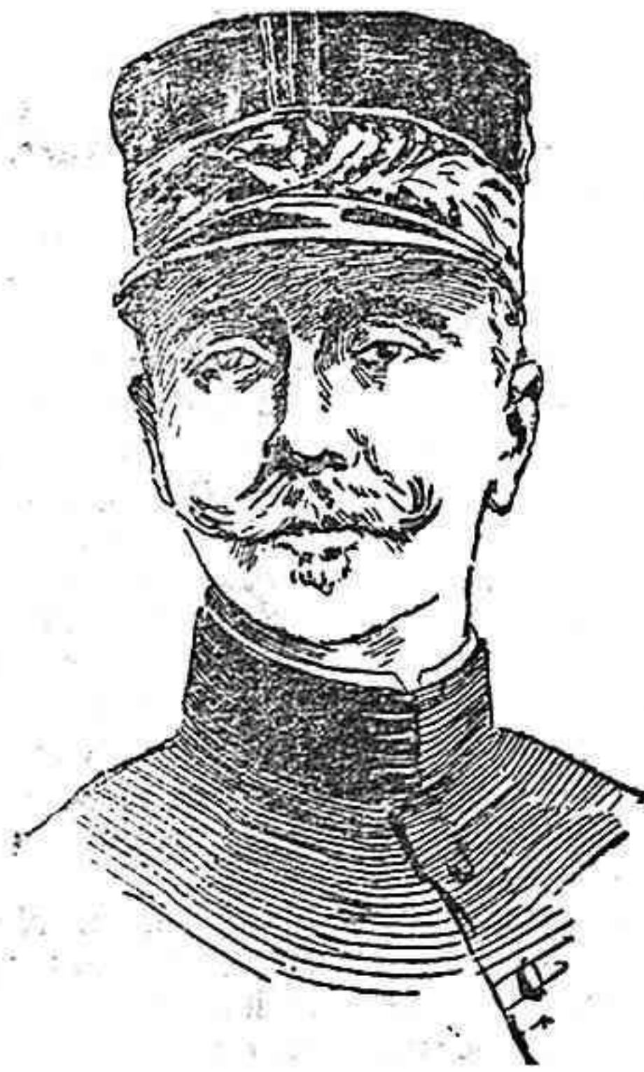
General Gerard, comandante del ejército francés de la frontera del Este