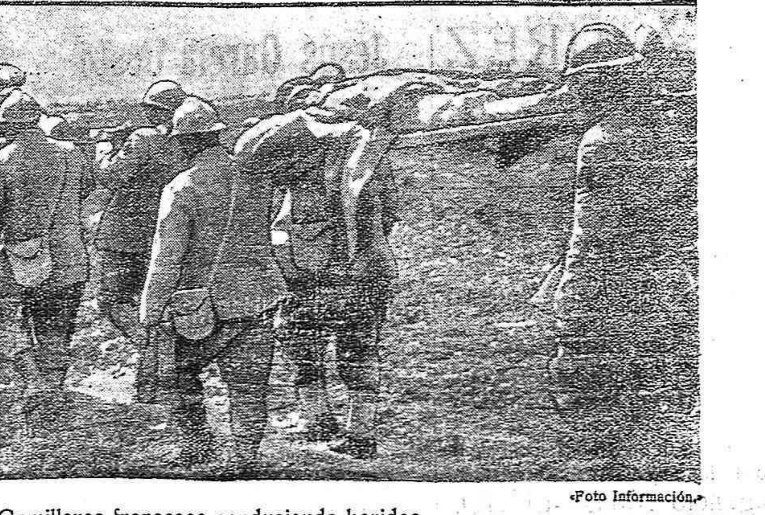
Camilleros franceses conduciendo heridos