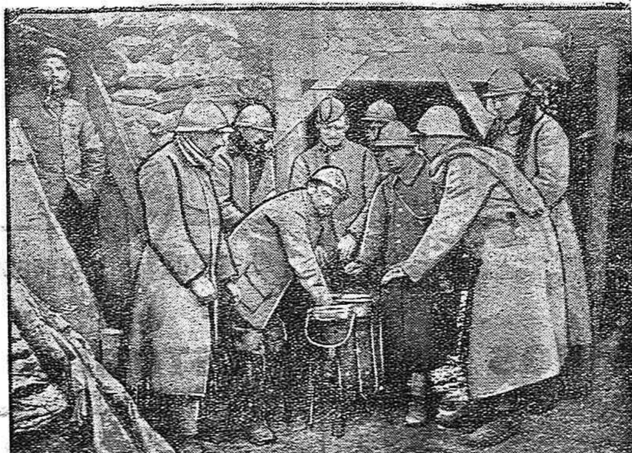
De la guerra.—El rancho en las trincheras