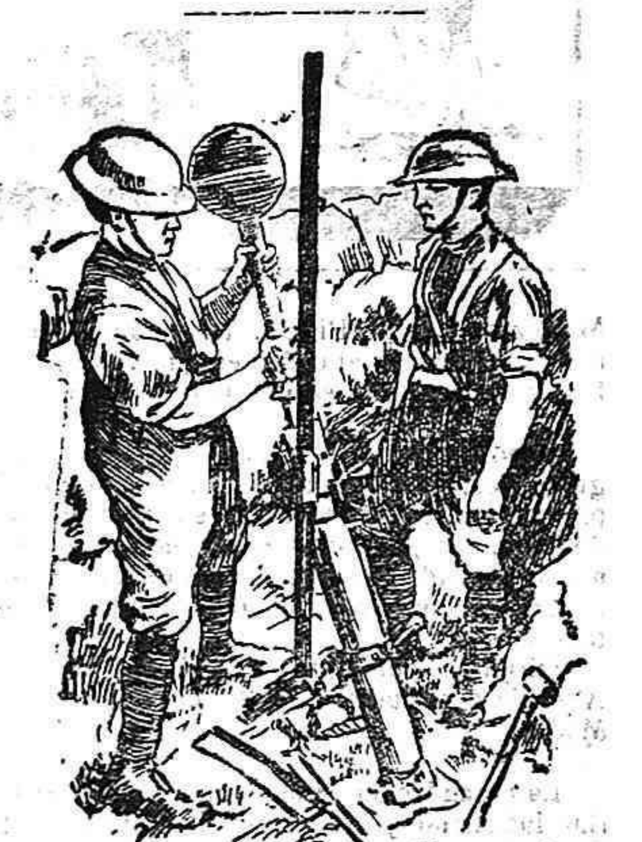
SOLDADOS INGLESES DEL EJERCITO DE MACEDONIA, CARGANDO UN MORTERO DE TRINCHERA.