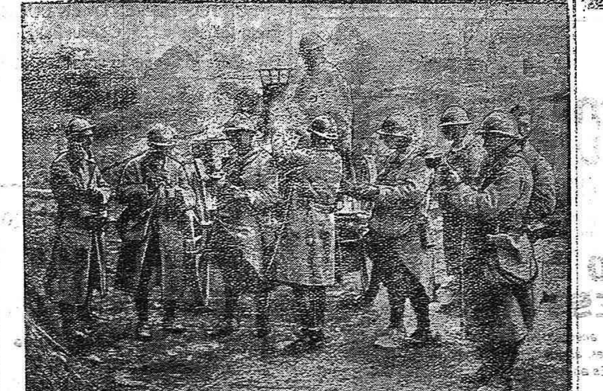
De la guerra.—Cocina de campaña