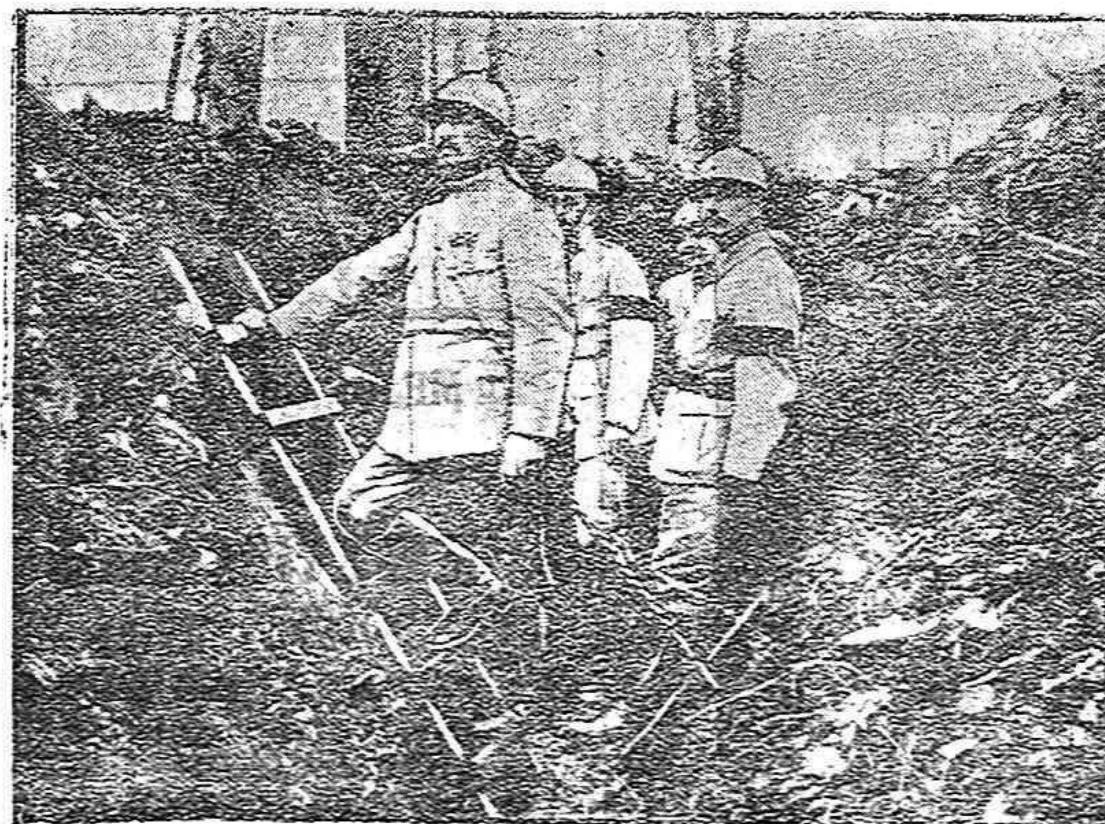
De la guerra.—Antes del ataque

Termina la citada circular excitando a todos los Ayuntamientos de España a enviar al ministro un telegrama o comunicación apoyando caudorosamente la justa súplica del Sindicato, la cual nos parece altamente plausible.