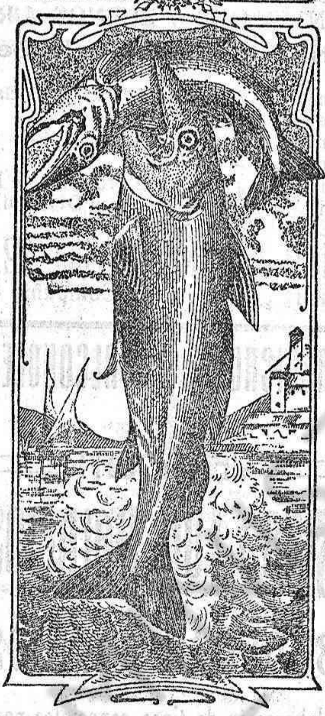
La última palabra

Emulsión "Dos pescados" (Marca registrada.)