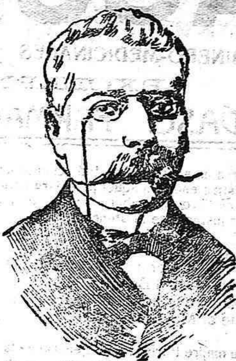
Zaimis, presidente del Consejo de ministros de Grecia.