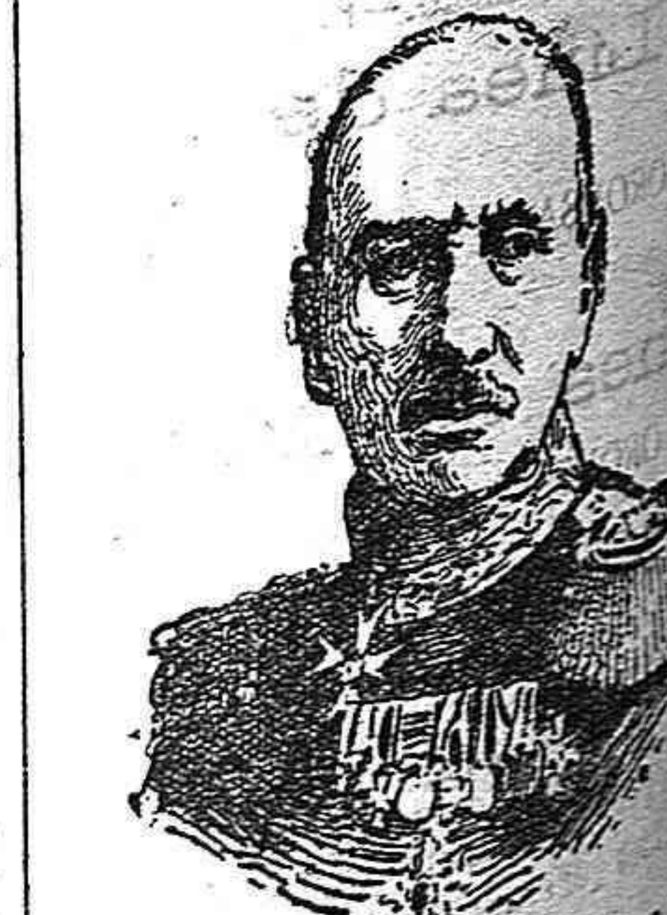
General von Molke falleció en consecuencia de un ataque de epilepsia en los funerales del general Goltz.