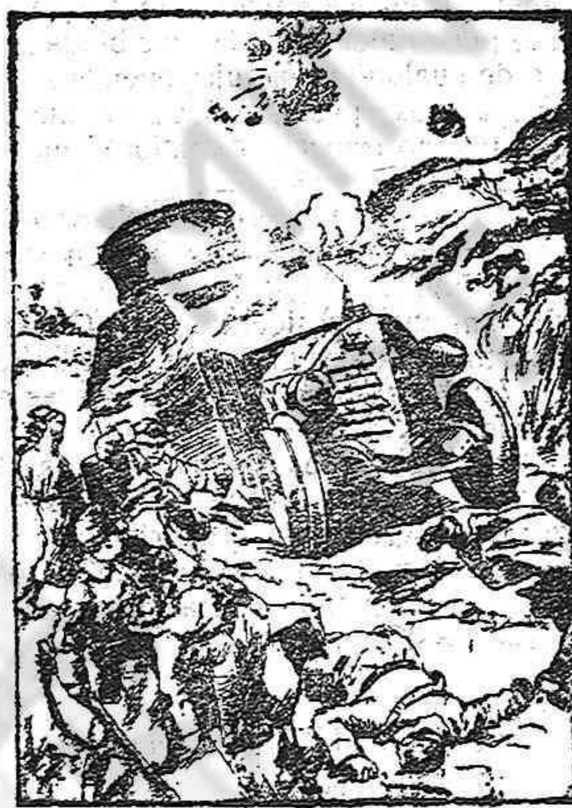
Sorpresas de un grupo de exploradores austriacos, por un auto blindado italiano.