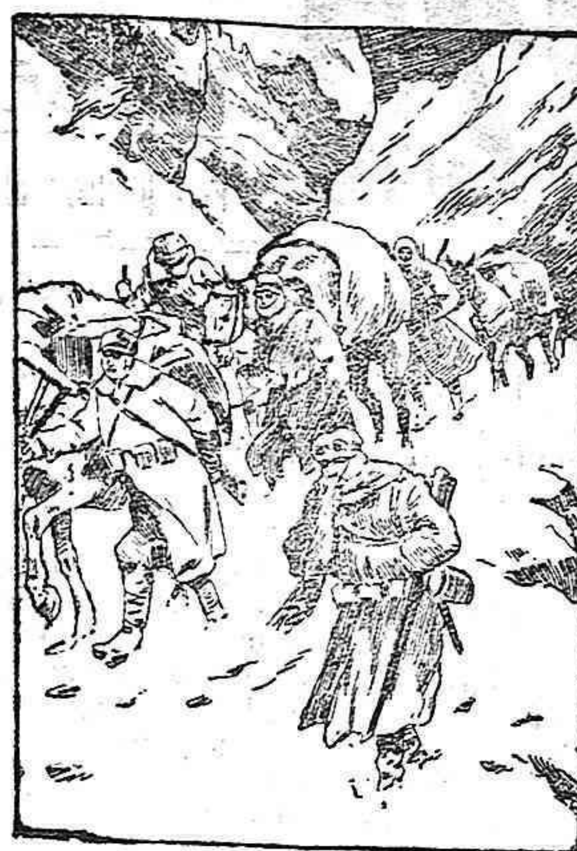
Una columna austriaca de aprovisionamiento