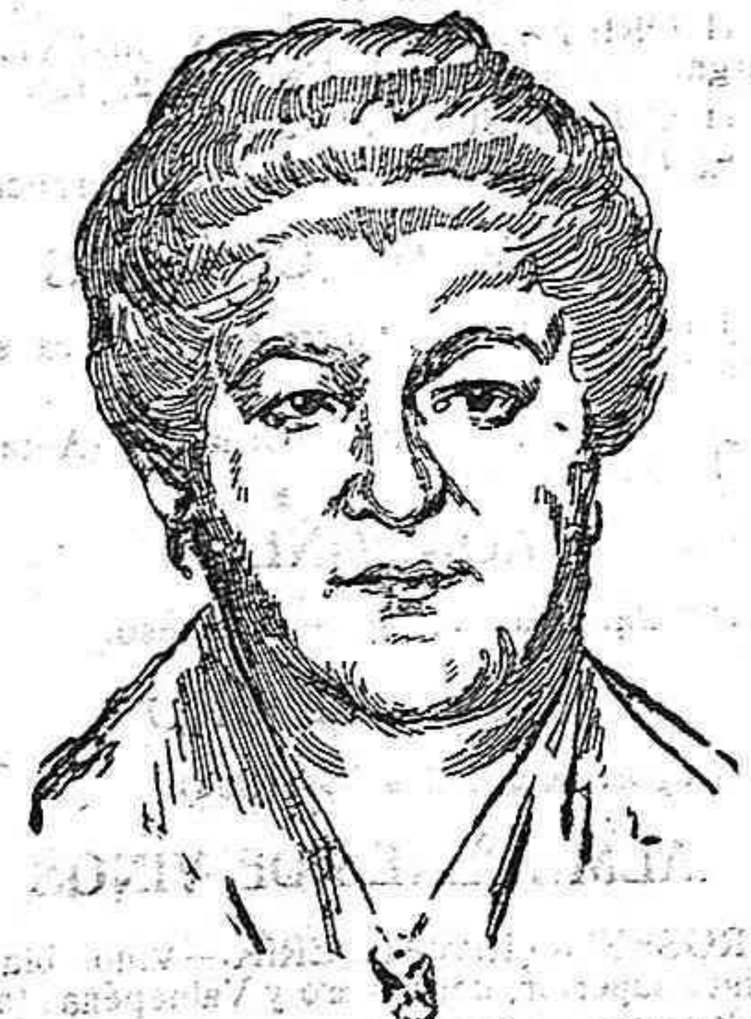
La insigne escritora, D. a Emilia Pardo Bazán, nombrada para desempeñar la cátedra de Literatura de la Universidad Central.