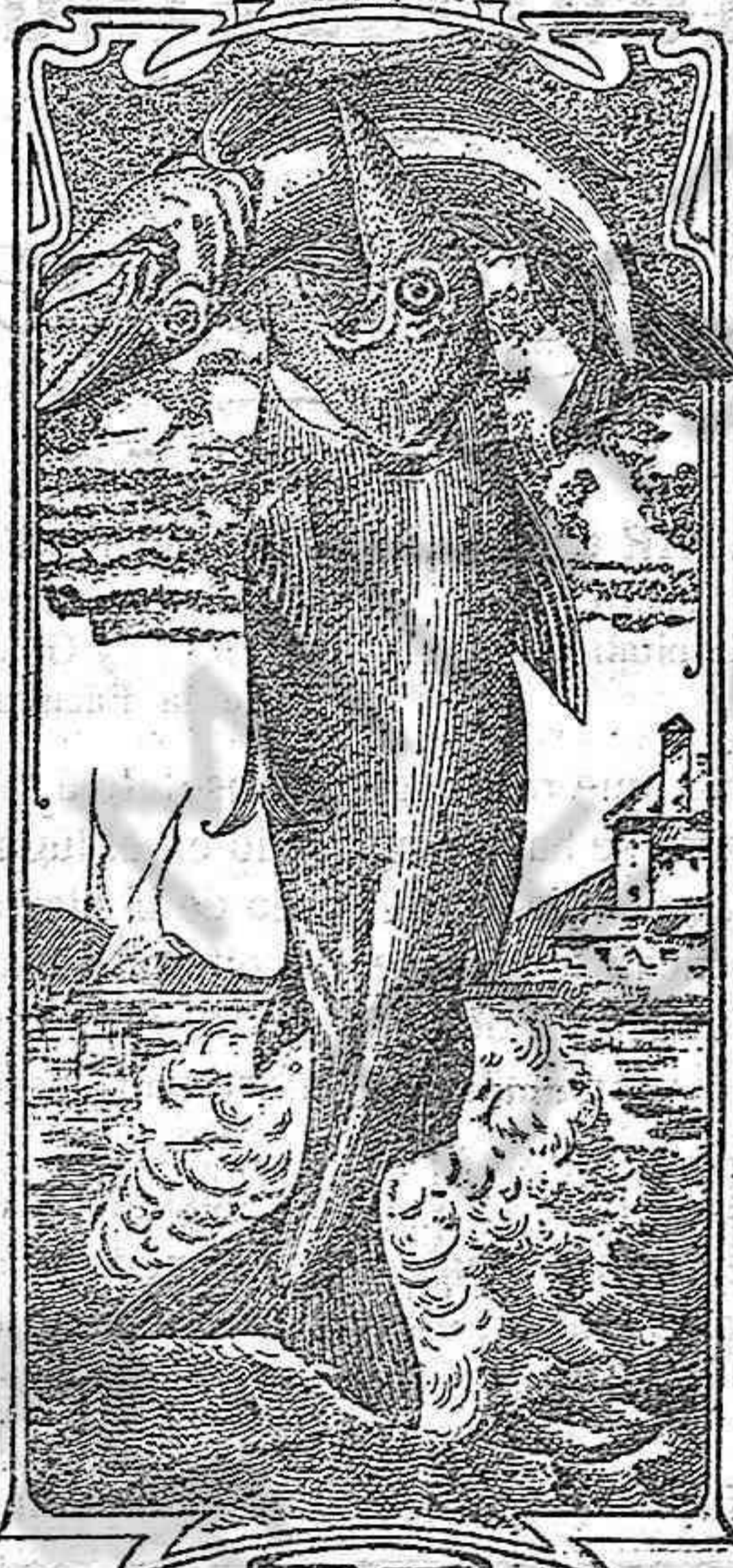
La última palabra

Emulsión "Dos pescados" (Marca registrada.)