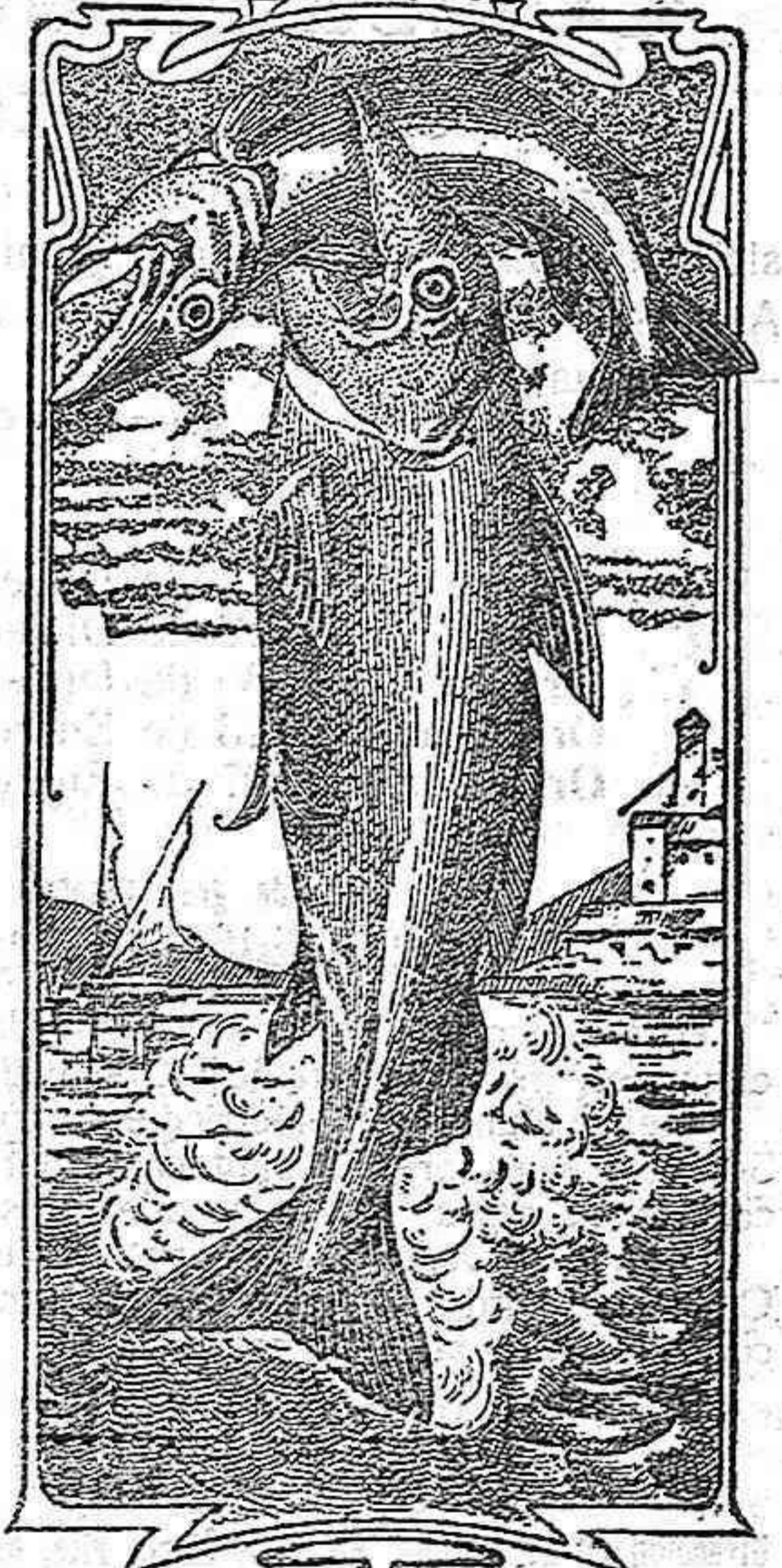
La última palabra

Nos referimos a una nueva y excelente preparación de Emulsión «DOS PESCADOS» (marca registrada) la que compete con todas, las extranjeras y españolas, tanto en calidad como en precio.