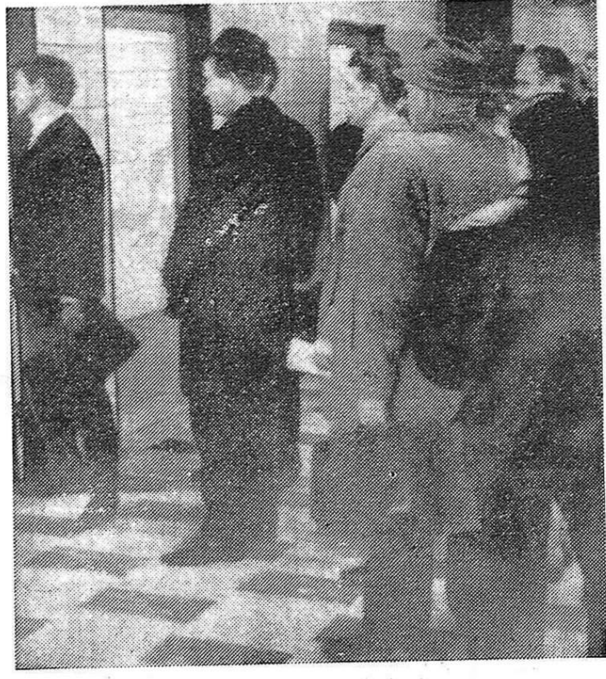
Un espectáculo que, desgraciadamente, tiende a multiplicarse en Alemania, Holanda y otros países europeos: las colas de parados en las puertas de las oficinas de mano de obra.

MARIN. — El cierre de minas en Holanda se debe también a esa concurrencia, tras el descubrimiento y explotación. Hace dos o tres años, de yacimientos de gas natural. Y el paro en las minas ha influido en la crisis fluvial, que era el medio principal de transporte holandés. La concurrencia agrava también la crisis agrícola, cuya producción es de las principales del campo y, está estancada, por no aumentar la exportación. Los capitalistas han llamado a los holandeses, a comer más pollo, ¡por favor! (Continúa en pág. 6).