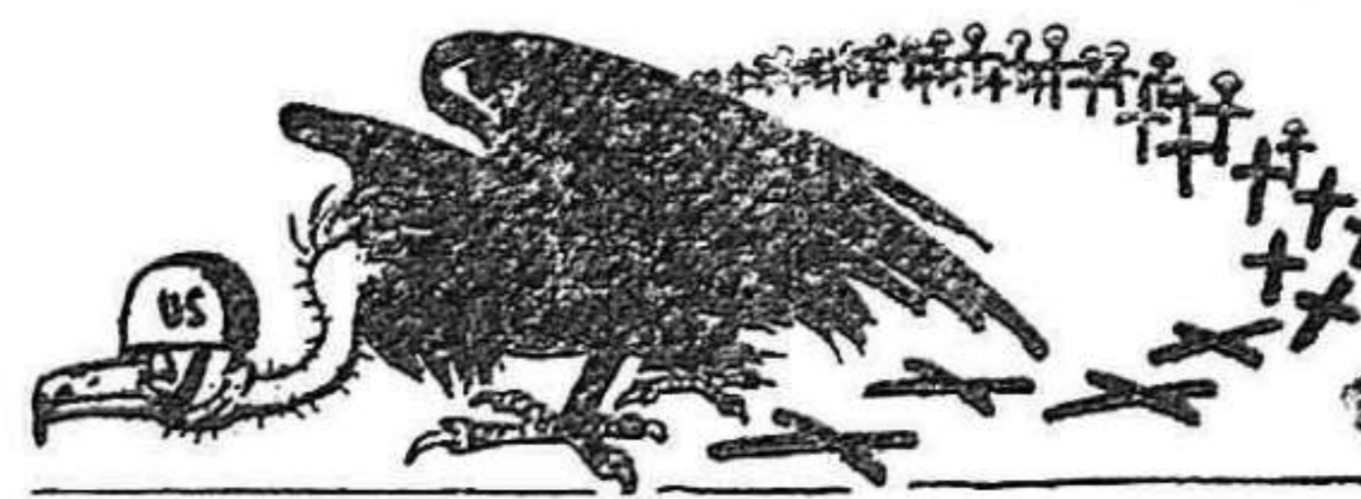
(Del dibujante ruso Abramov.)