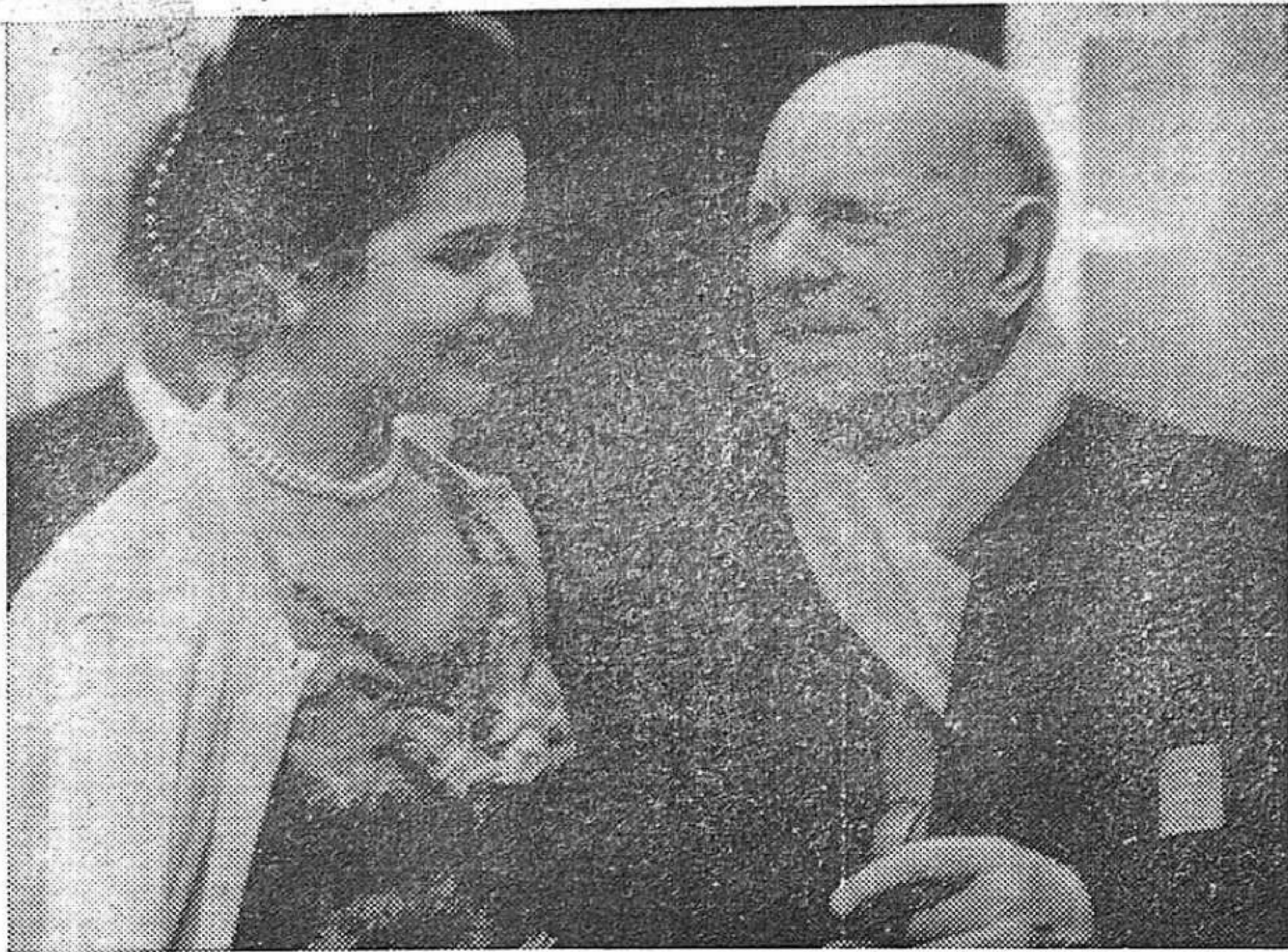
El artista con su joven esposa.