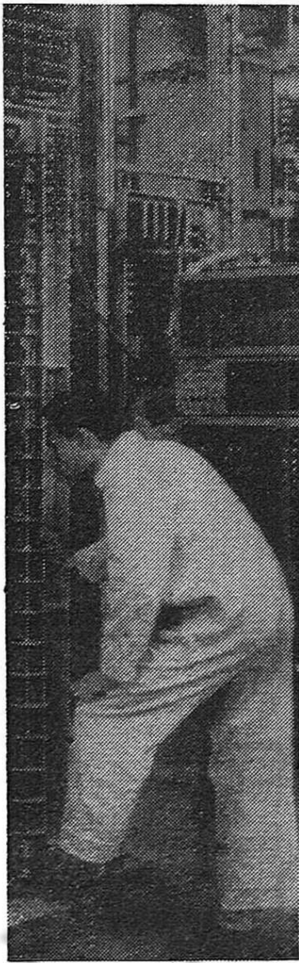
Obrero madrileño de la construcción eléctrica, en la Marconi

En Barreiros, 7.000 trabajadores ocuparon los talleres el viernes por la noche. Las auto-