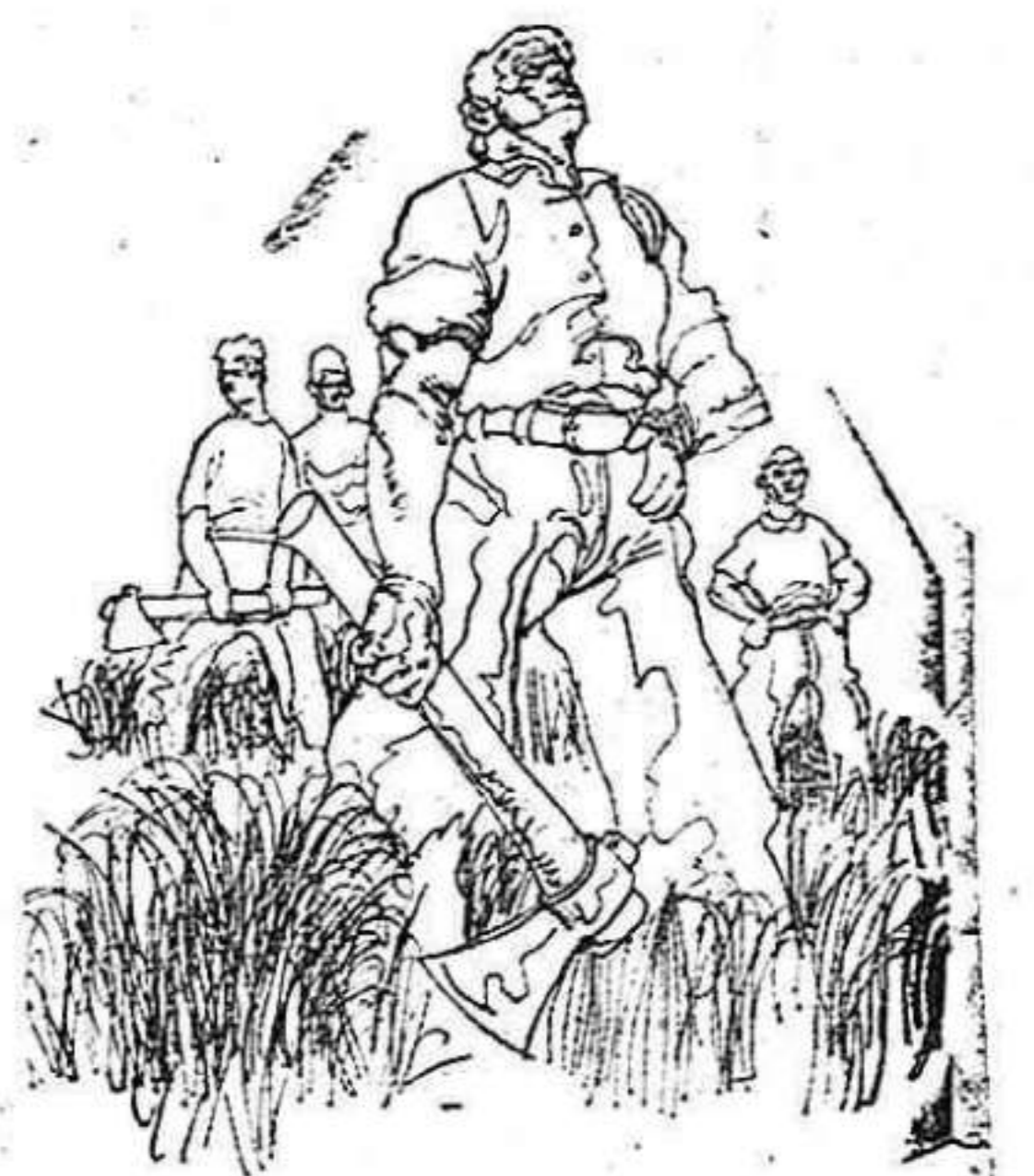
Dibujo de Gayeira (Munich).

« Las consecuencias de la grave situación de nuestra agricultura, quienes más la sufren somos nosotros, los trabajadores y nuestras familias. Si emigramos toda la familia, tenemos que vivir como parias, por esos mundos desconocidos, para hacer una vida, en muchos casos, poco digna de una familia decorosa. Si emigramos sin la familia, tenemos que andar de unos lugares a otros, solos, como nómadas errantes y la familia en el pueblo, en espera del incierto giro que pueda