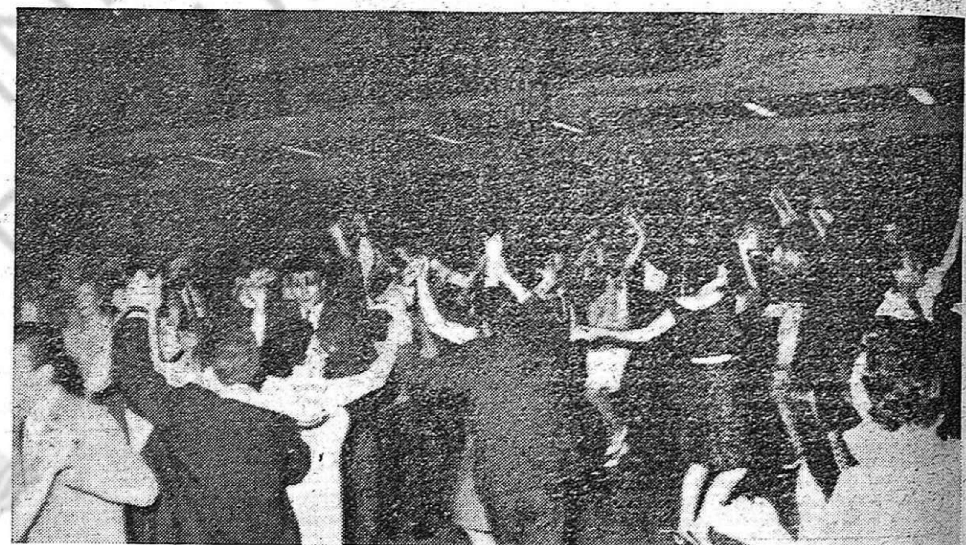
Alegre baile hasta la madrugada...