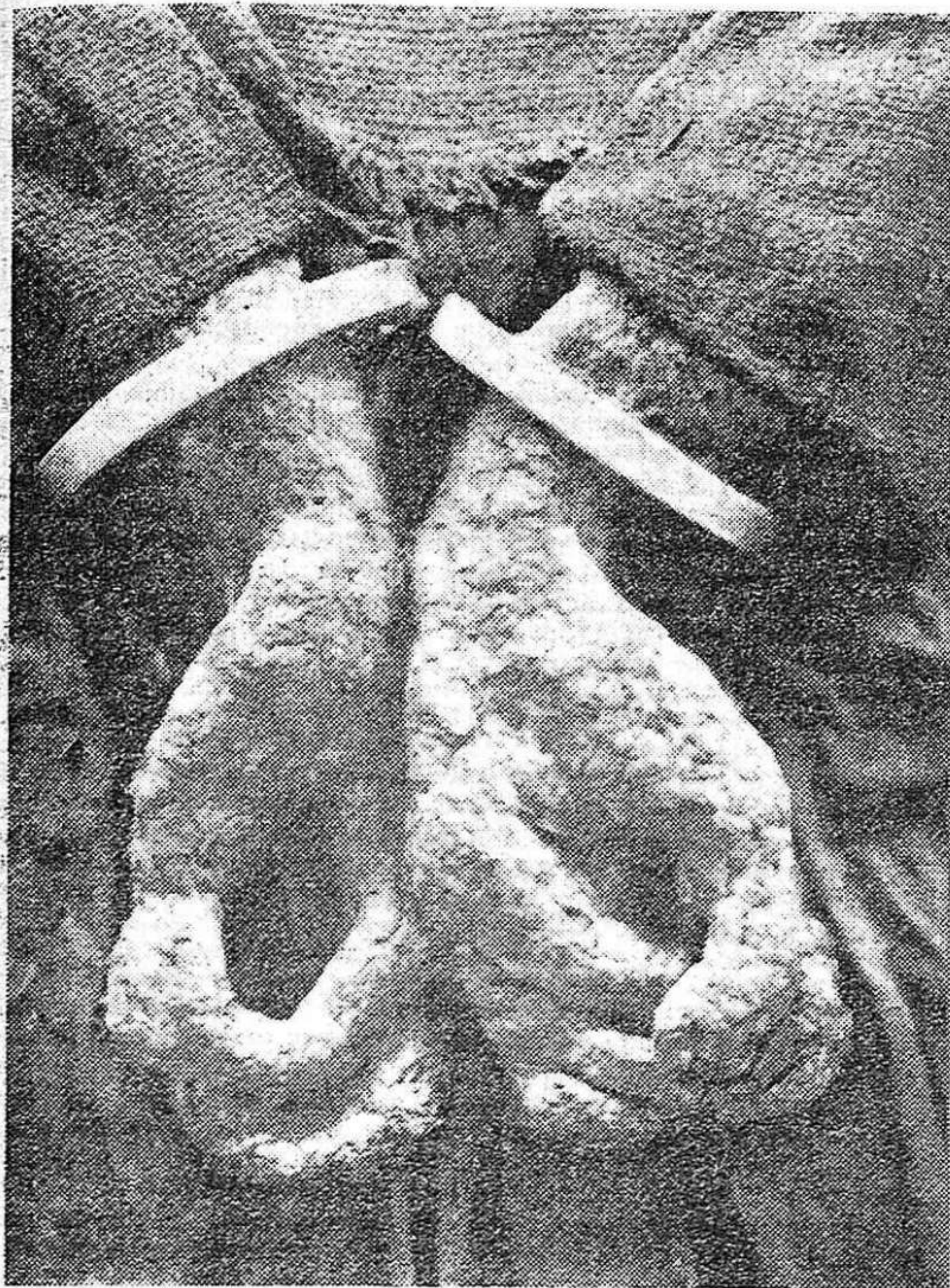
El Preso (fragmento), de Genovés.