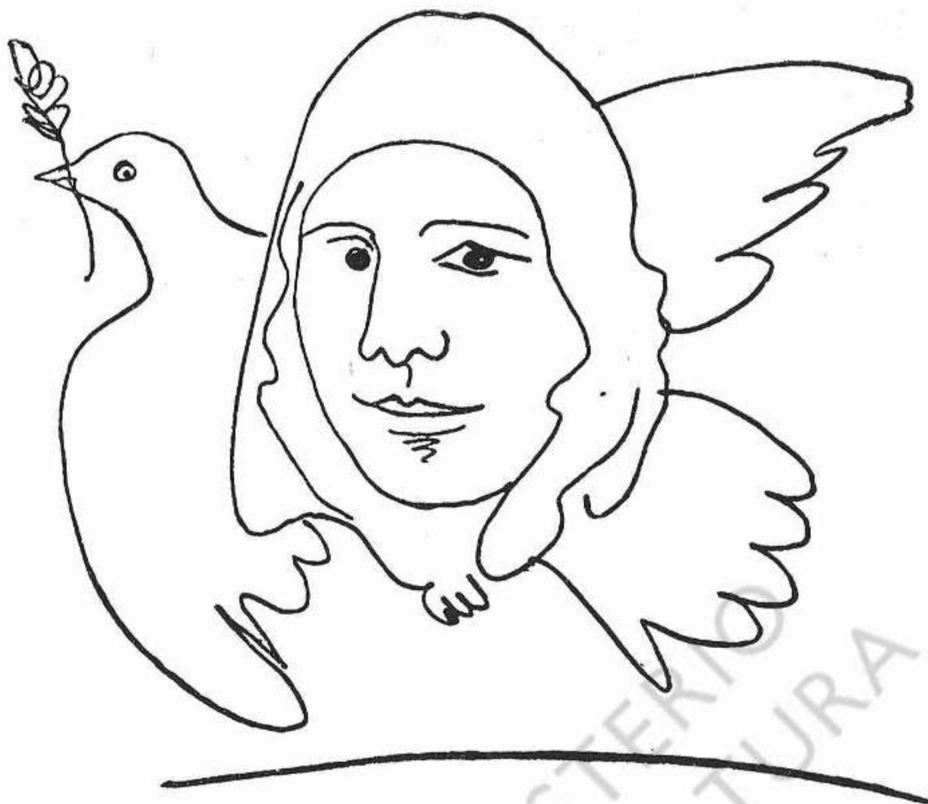
Dibuix de Picasso sobre el vol al cosmos de Iuri Gagarin.

veritables valors humans tinguin plena capacitat per a desenvolupar lliurement llurs potencialitats. I això és impossible d'atényer si en el centre mateix d'aquesta estructuració social no hi ha la preocupació primera pel valor home, si els criteris de valoració propis de la societat mercantilitzada no són substituïts pels criteris de mèrit personal, de sentit de responsabilitat, de respecte mutu, de consciència dels propis deures envers la col·lectivitat, de comprensió lliure dels límits de la pròpia llibertat.