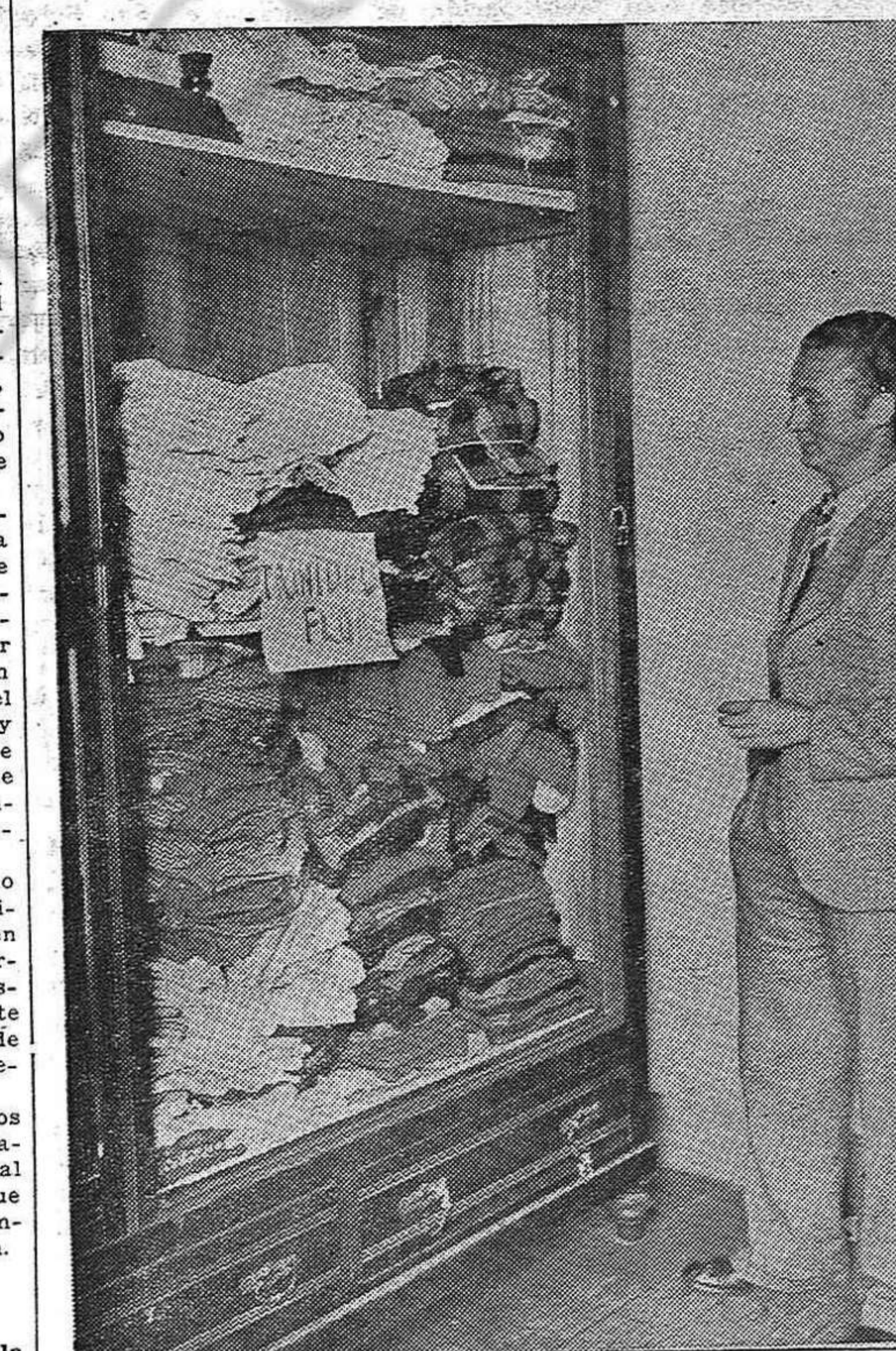
También los Comités Femeninos de Trinidad han enviado su aporte para los niños españoles. La foto muestra una parte de los equipos llegados a la Comisión de Damas

Tiene Millares de Presos Diariamente se hacen las ejecuciones