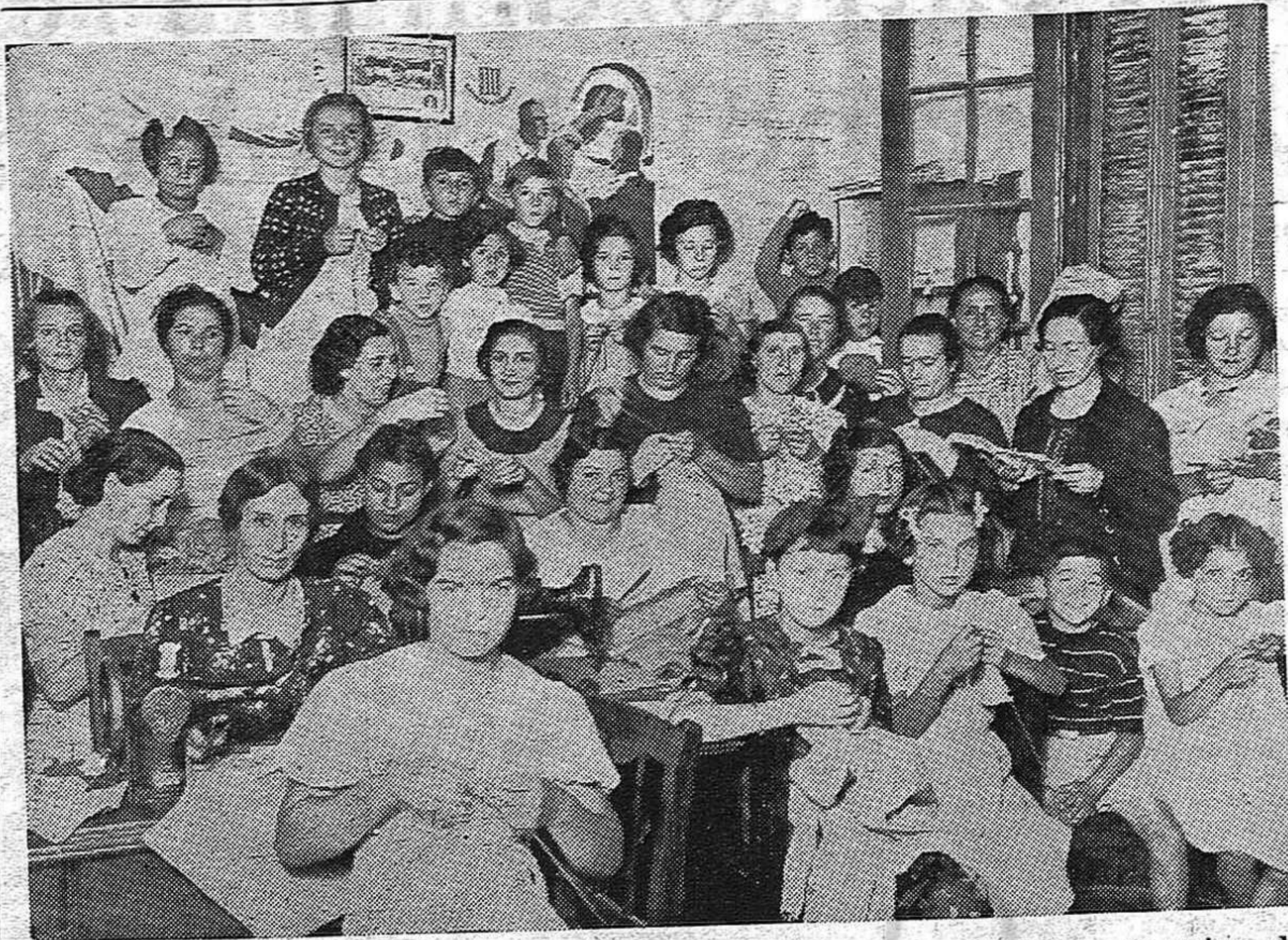
Una vista del costurero del Comité Femenino de "La Espada", uno de los núcleos femeninos de Montevideo que más se han destacado en la labor de ayuda de los niños españoles. Estas valerosas mujeres se mantienen firme en su trabajo solidario y más aún, lo han intensificado ante la necesidad urgente de ayuda que tienen los niños, refugiados en Francia.