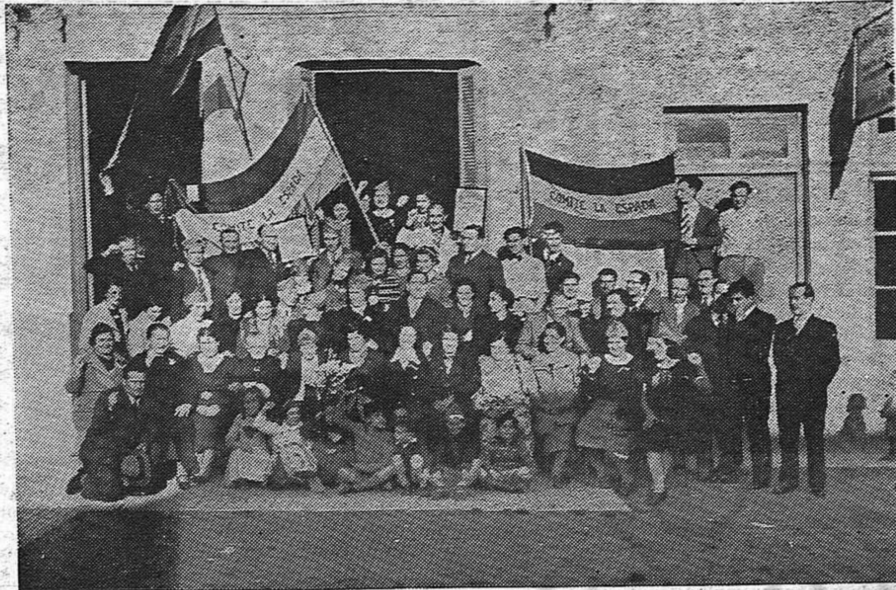
Foto de la mayoría de los integrantes de los Comités Masculino y Femenino del barrio "La Espada", que han desarrollado una intensa acción en ayuda al pueblo español desde el primer día de la guerra. Esta edición de "ESPAÑA DEMOCRÁTICA" está dedicada a este activo Comité, que ha contribuido a financiarla con su tesonero trabajo