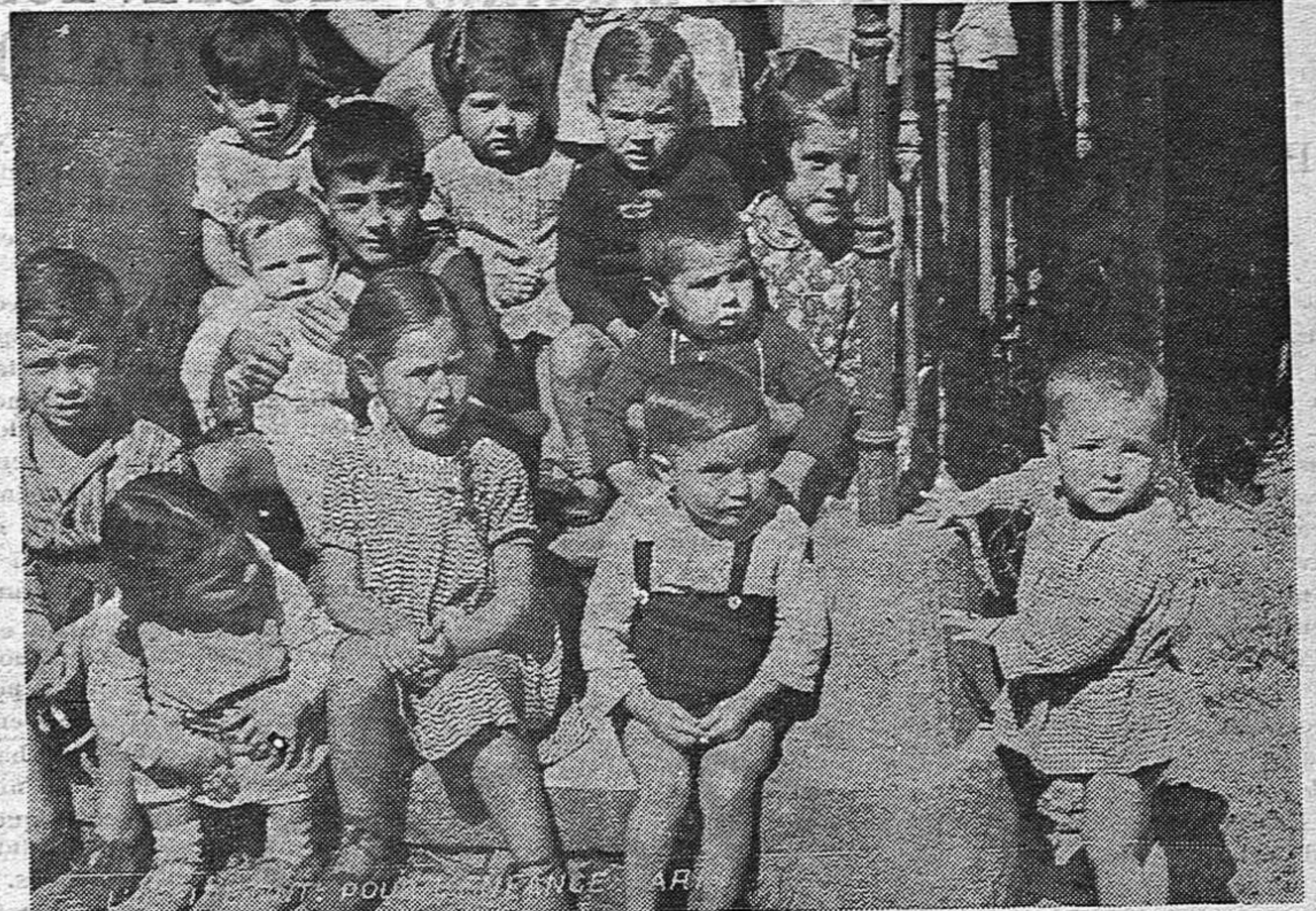
Niños españoles refugiados en el campo de Rion Landes, apadrinado por el British Youth Peace Assembly de Londres. Ropa, calzado y alimentos hay que enviarle a estos niños, inocentes víctimas de la agresión sufrida por el pueblo español. Todo demócrata no puede dejar de contribuir a salvar a estos niños españoles que sufren en los campos de Francia.