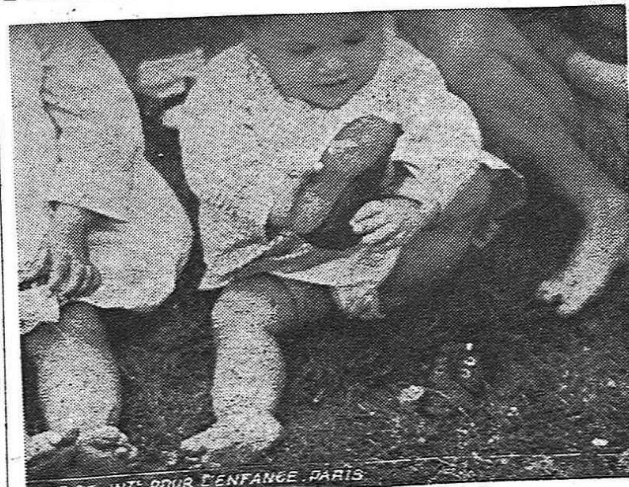
Pequeños refugiados del campo de Penlan - Morbihan en Morbihan en el momento en que reciben calzado de la ayuda internacional. Es una de las necesidades más inmediatas de los niños españoles refugiados, el recibir ropa y calzados pues deben soportar un nuevo invierno, y no ya en los refugios sino en los campos de concentración adonde han sido trasladados.