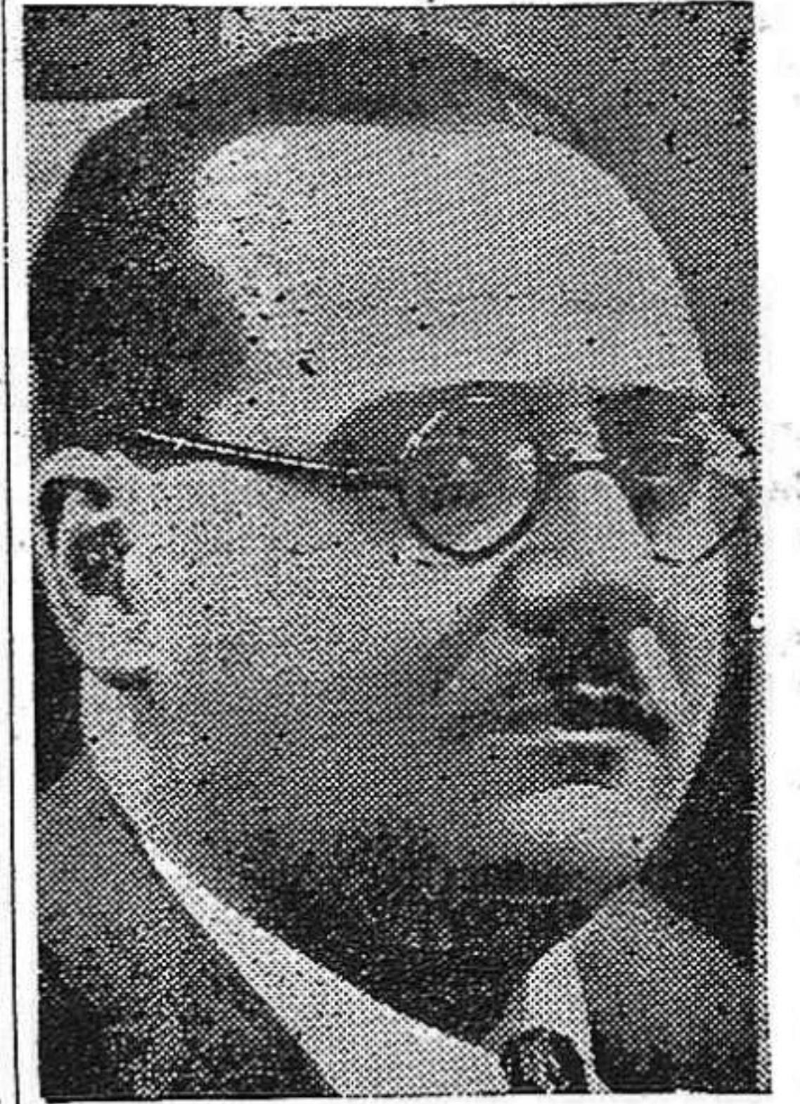
Dr. Juan Negrín, que acaba de ofrecer sus servicios al gobierno de Francia

El campamento, como los demás, es regido por los métodos militares. La alimentación es abastecida por el Ministerio de Guerra y distribuida por hombres escogidos entre los refugiados. Cada mañana varios centenares de coches van al lugar del aprovisionamiento para traer los viveres. En realidad, cada campo es una ciudad militar en miniatura con su correo, su estación de primeros auxilios, su cuartel de bomberos, los centros de lectura y de entrenamiento, los talleres, campos de deportes y servicios de alumbrado y sanitarios. En Barceles, se levantaron más de 8.000 chozas, que dan alojamiento a esos veteranos. Los cuarteles son oficiales o suboficiales republicanos, mientras que los "vigilantes" que custodian las "calles" son veteranos. A esas funciones se de-