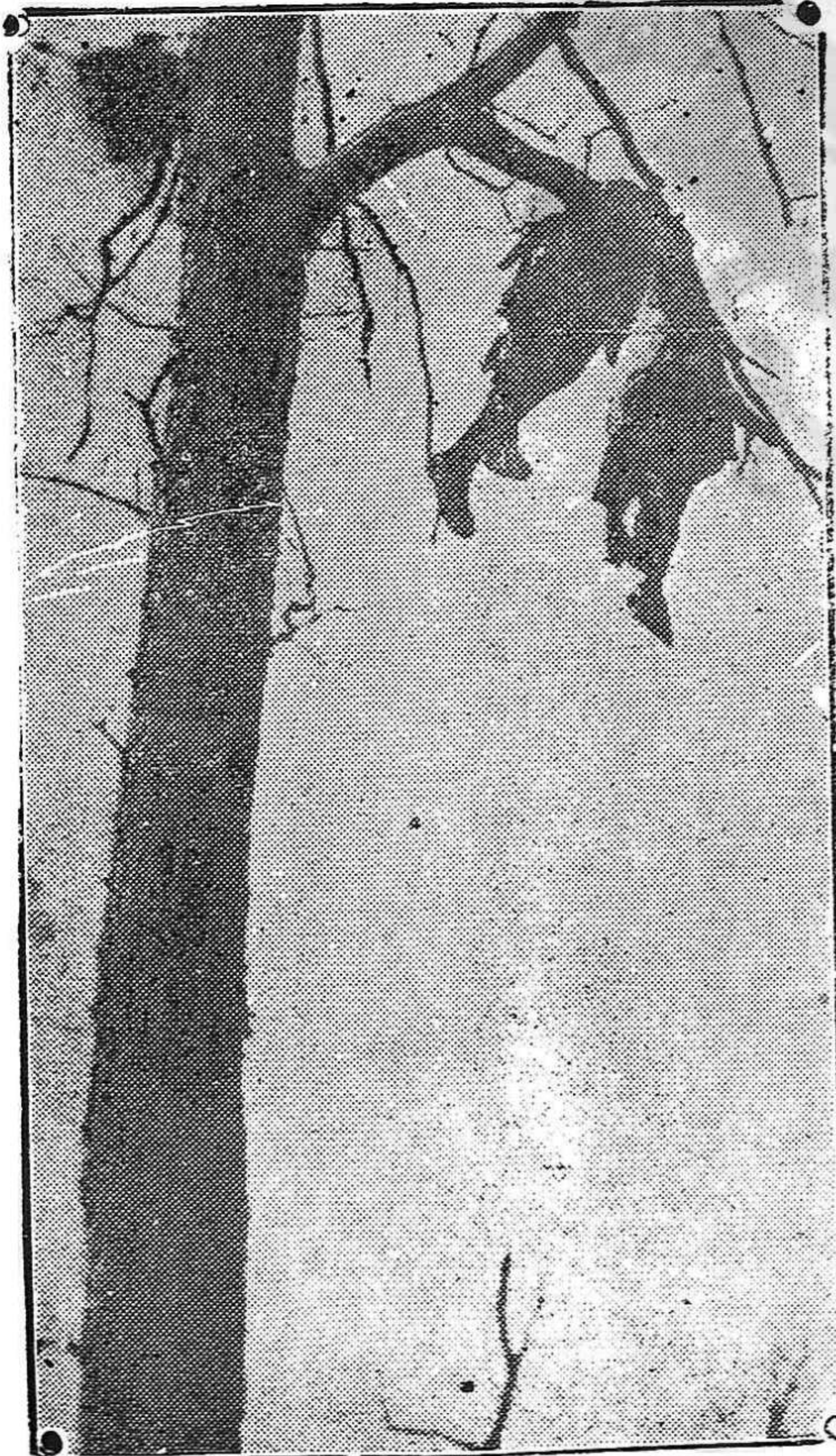
Esta nota representa el cuerpo de un soldado francés proyectado sobre un árbol por la explosión de un obús. ¿Lograrán la insensibilidad del dictador nazi que el mundo vuelva a ver estas escenas?