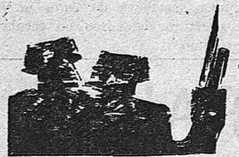
(Viene de la página 1)

han sido las masas las que han hablado de fracaso. Esta idea absurda ha podido cocerse en la mollera de algunas gentes que, a fuerza de estar desligados de los trabajadores, se hallan de espaldas a la realidad y desconocen completamente la evolución ininterrumpida que se viene produciendo en la conciencia de grandes masas de obreros.