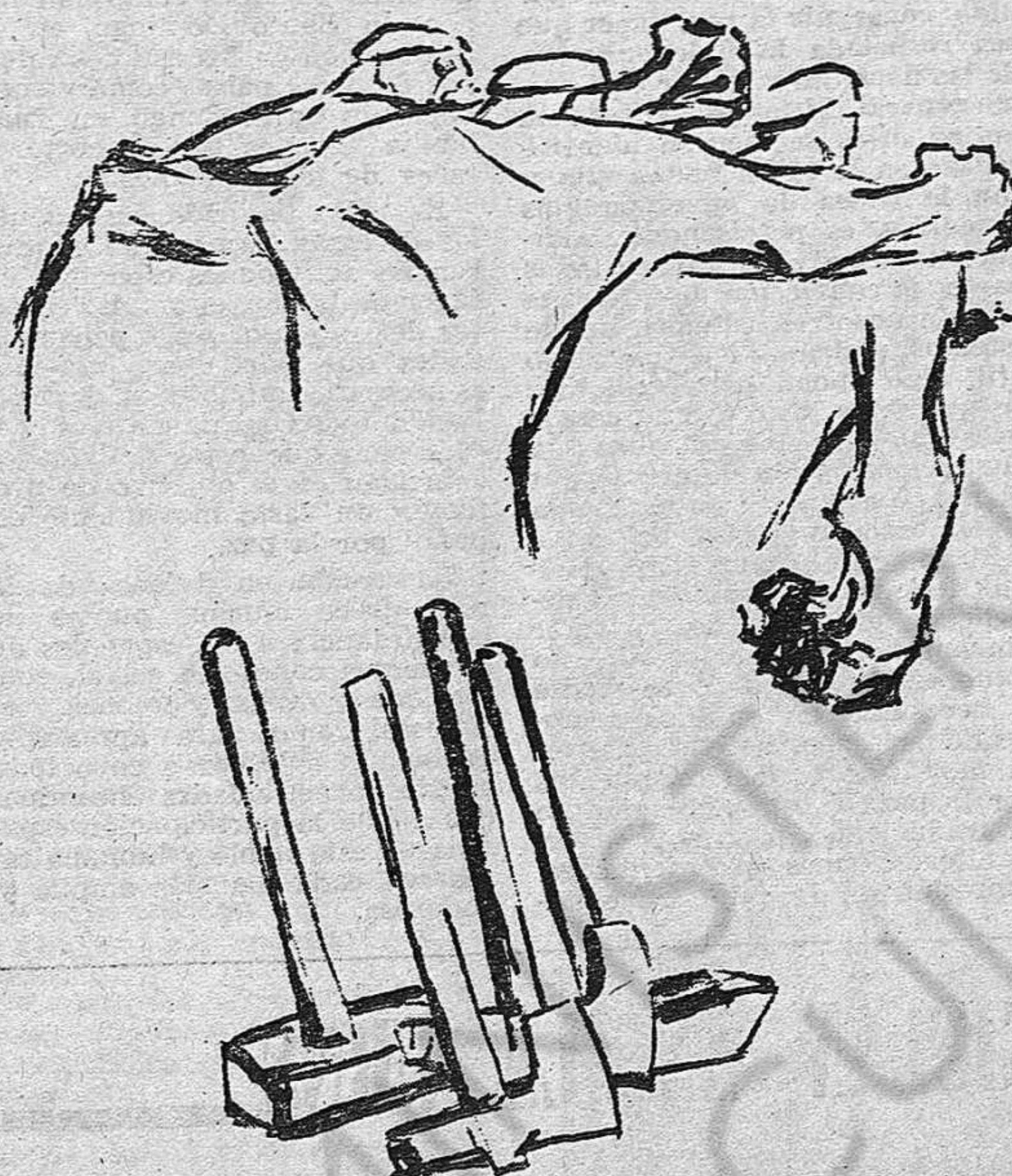
libertad sindical, sindicato de clase, derecho a la Huelga, Paz, salario móvil, etc.

Es por eso que nuestra agitación ha de huir tanto de las