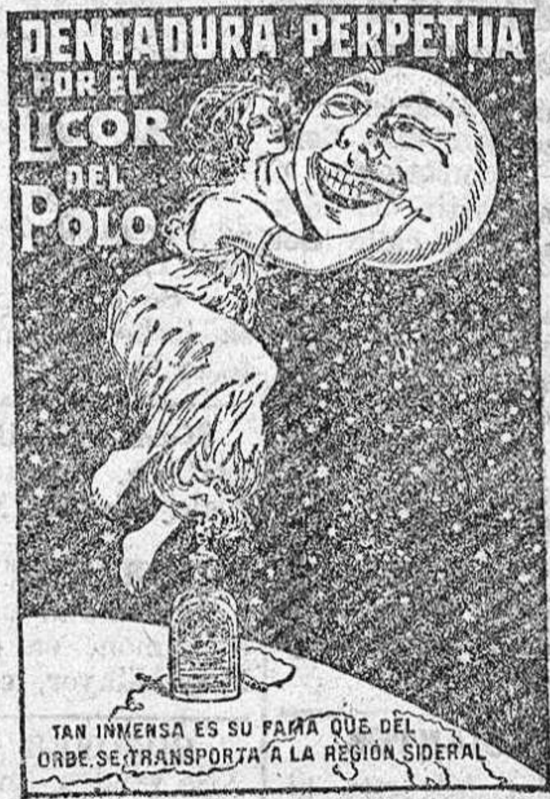
TAN INMERSA ES SU FAMA QUE DEL ORBE SE TRANSPORTA A LA REGION SIBERIAL