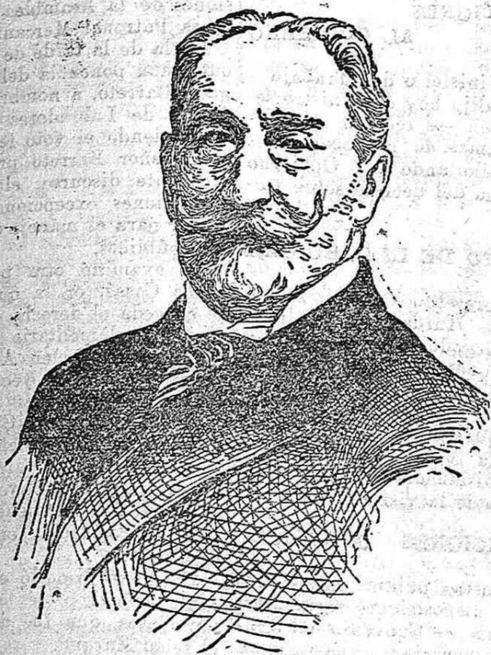
† Excmo. Sr. D. Amós Salvador y Rodríguez

dáver desde la Casa mortuoria al Palacio Consistorial, que tendrá lugar a las nueve de la mañana, y a la conducción al Cementerio, a las tres de la tarde.