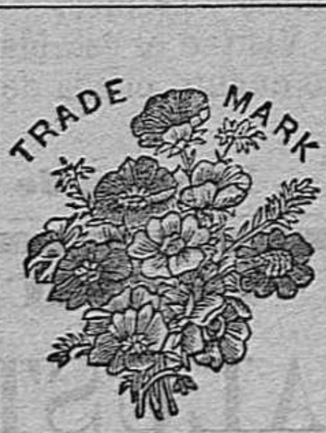
Flor de la Sabana de SEQUAH