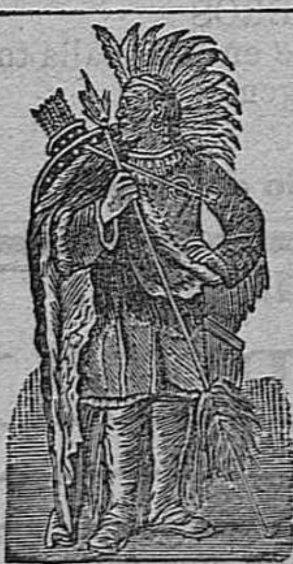
ACEITE DE SEQUAH MARCA REGISTRADA

No contienen ninguna substancia nociva. Los muchos millares de certificados de personas que deben la curación de sus enfermedades á estos dos preparados y los brillantes elogios de varias corporaciones científicas del mundo entero, son el mejor elogio que pueda desearse.