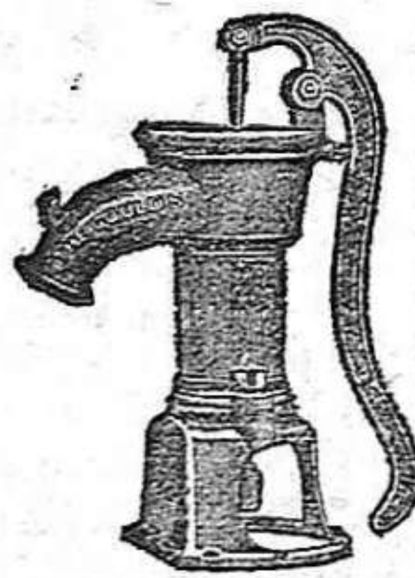
BOMBA PARA RIEGOS

Construye con solidez, economía y adelanto.