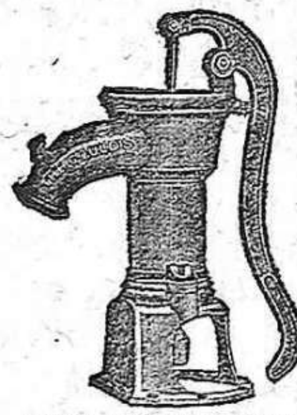
BOMBA PARA RIEGOS

Construye con solidez, economía y adelanto.