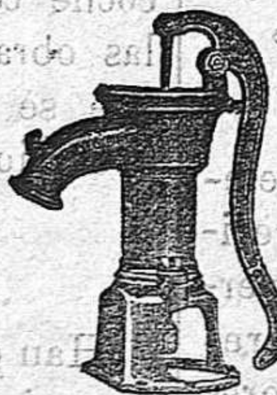
BOMBA PARA RIEGOS

Construye con solidez, economía y adelanto.