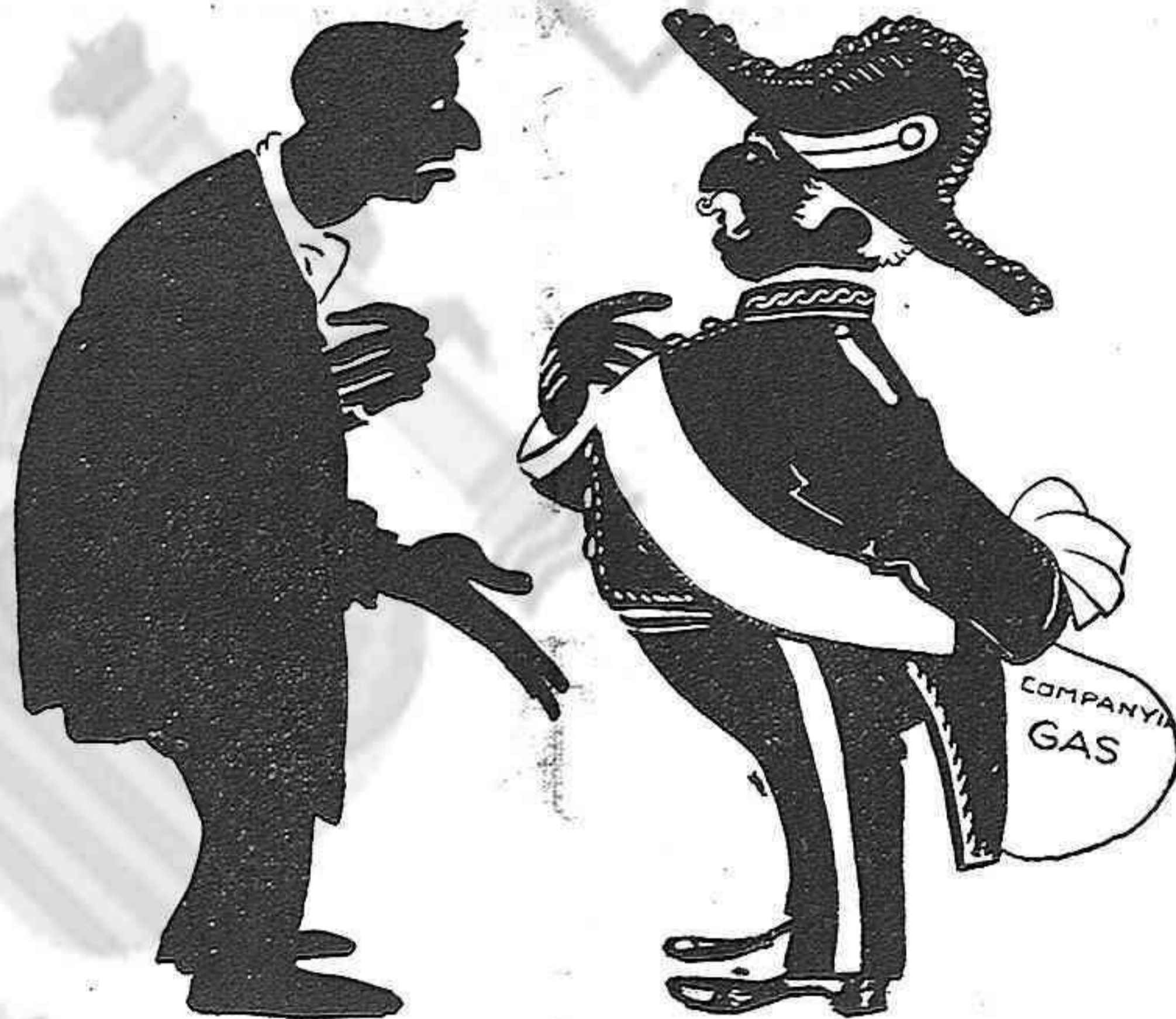
—¿El gas?... El gas no l'he carregat tant, pera que pugui resistir millor la competencia estrangera.