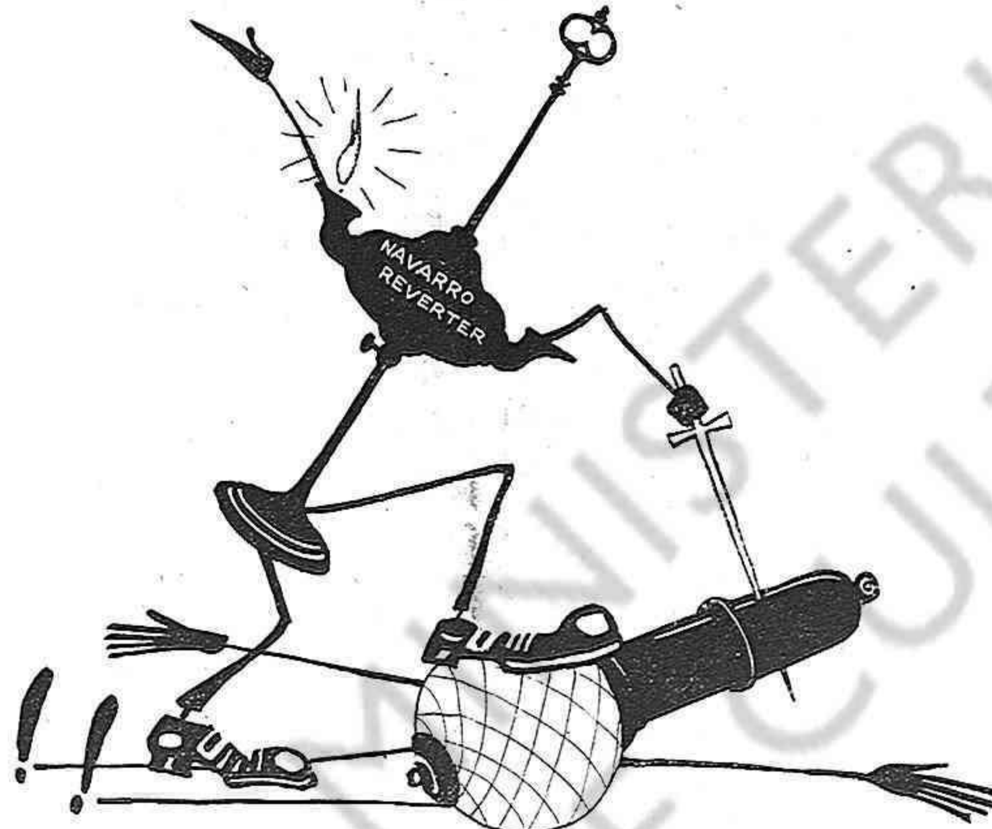
—¿Es dir que'm tractes d'obscurantista?... Me la pagaras... a raó de 8 centims el kilowatt.