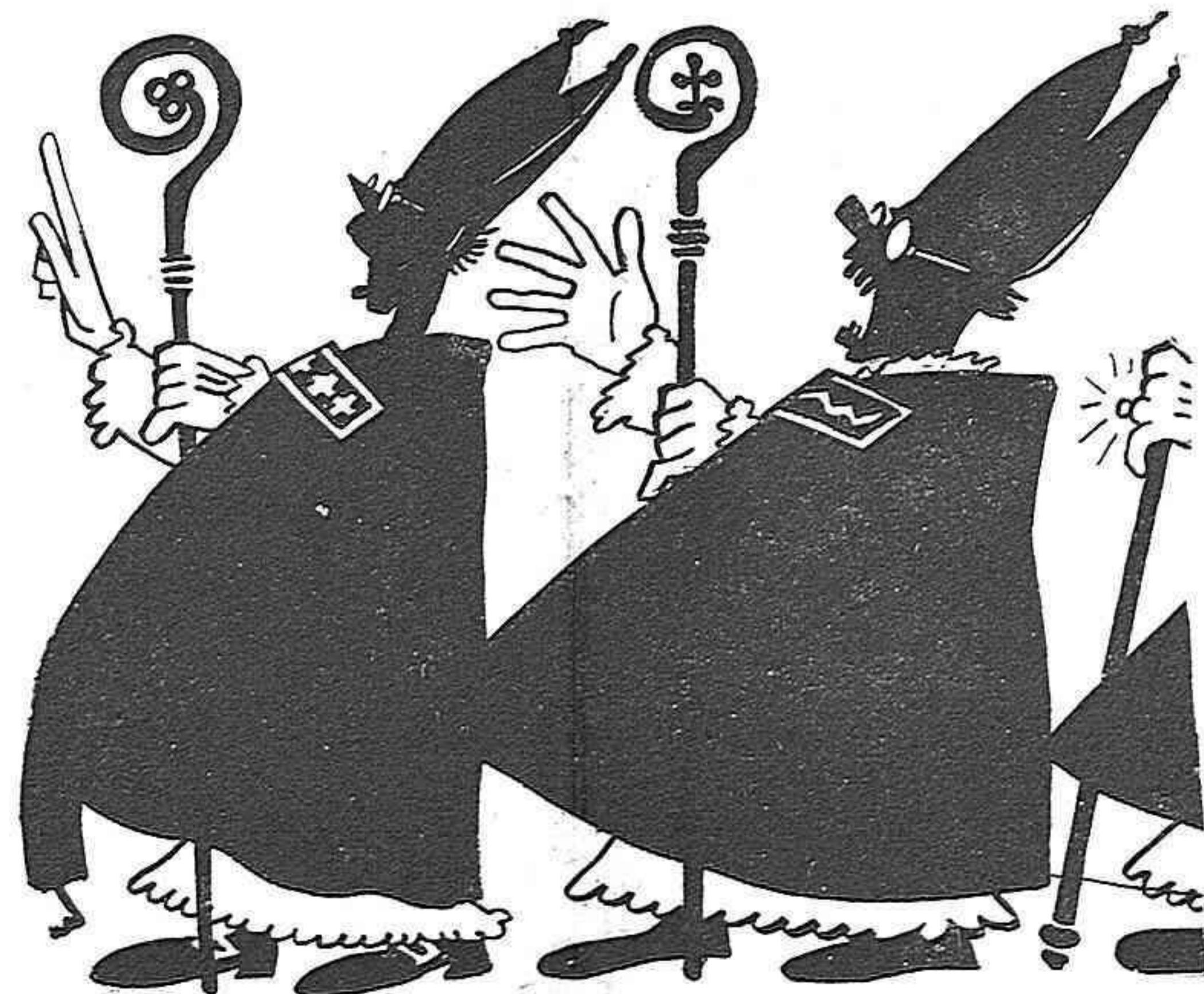
—¿Ara que havíem posat bombetes en tantes iglesies!... Nada. Tornarem a la cera.

fitar les circumstancies. Serviria pera empre-sari de teatres.