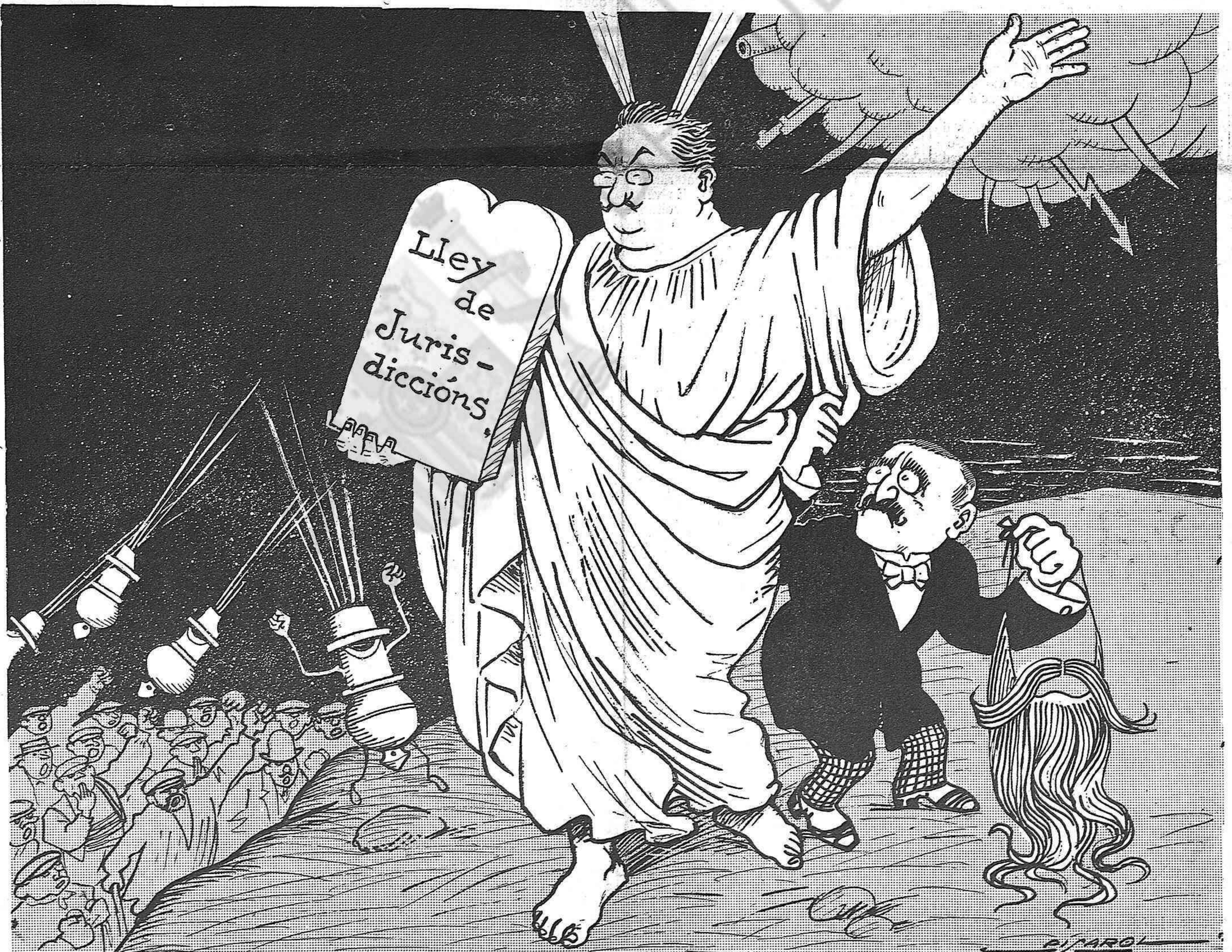
CANALEJAS (en vèu baixa):—Lacandro, creume, pòsat les barbes. Aixís al menos no't coneixeran.