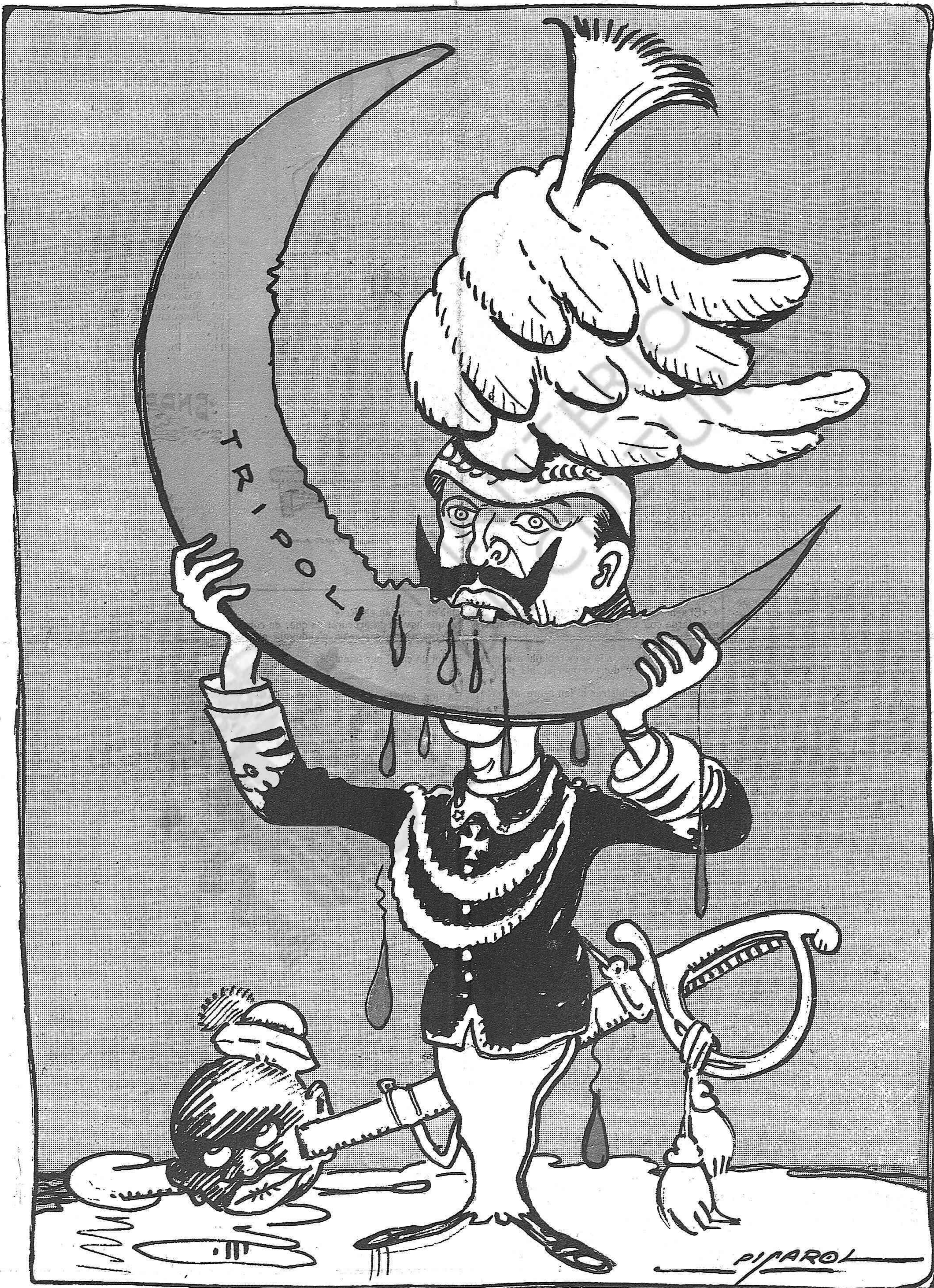
—¡M'ha ben enganyat!... ¡Tan dolça que semblava que havia de ser!...