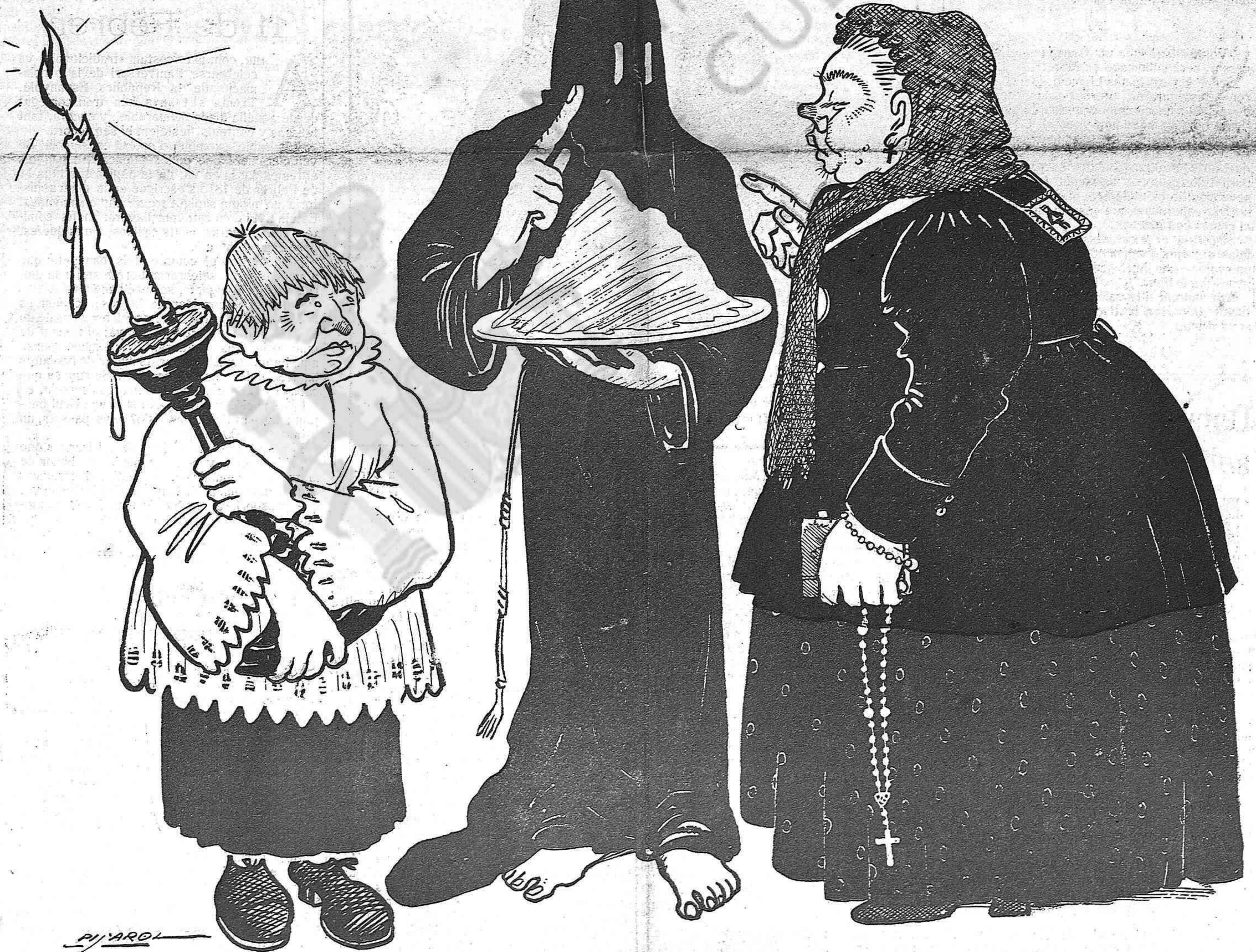
— Que troba que hi ha massa cendra, diu?... Es que aquest any ne tenim ab molta abundancia. No veu que pel Juliol varen ferne tanta provisió?...