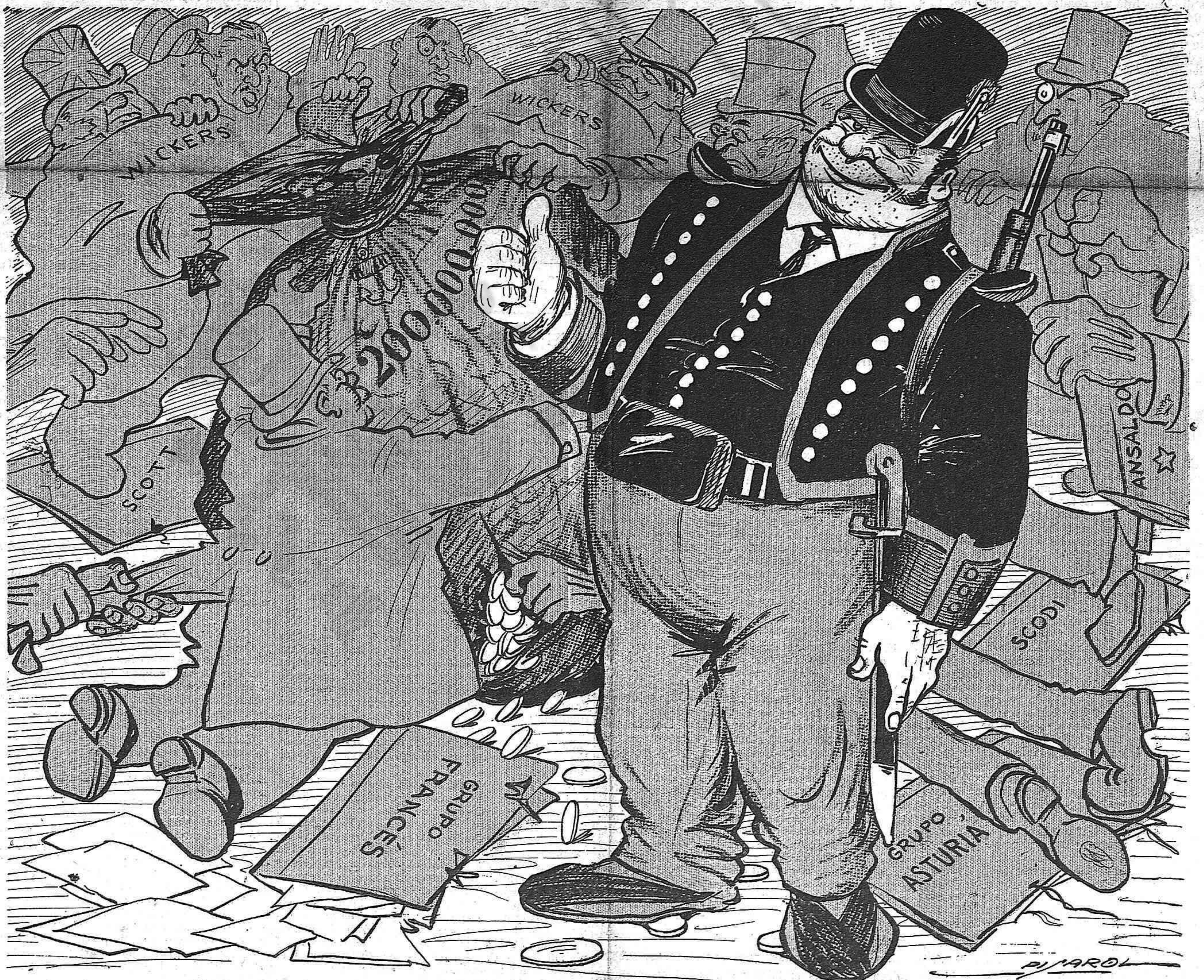
—Veyám si al últim ab aixó de la subasta de la esquadra hi haurán d' intervenir els mossos de la idem.