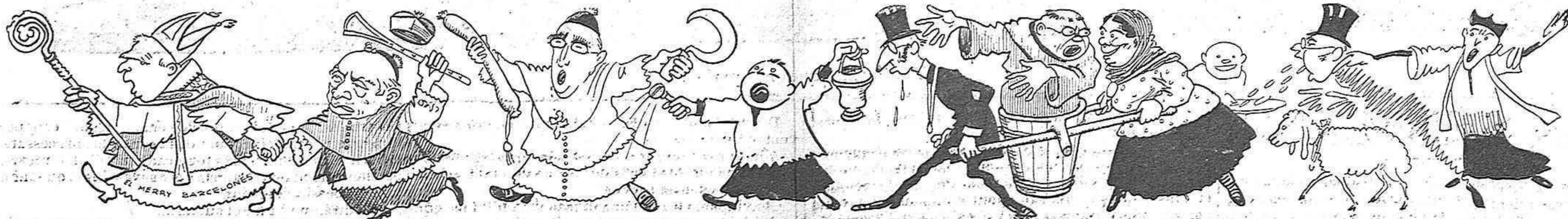
Dos, eriaturas, quatre velles, — un frare, tres capellans, — el bisbe, el seu secretari; — total: mil manifestants.