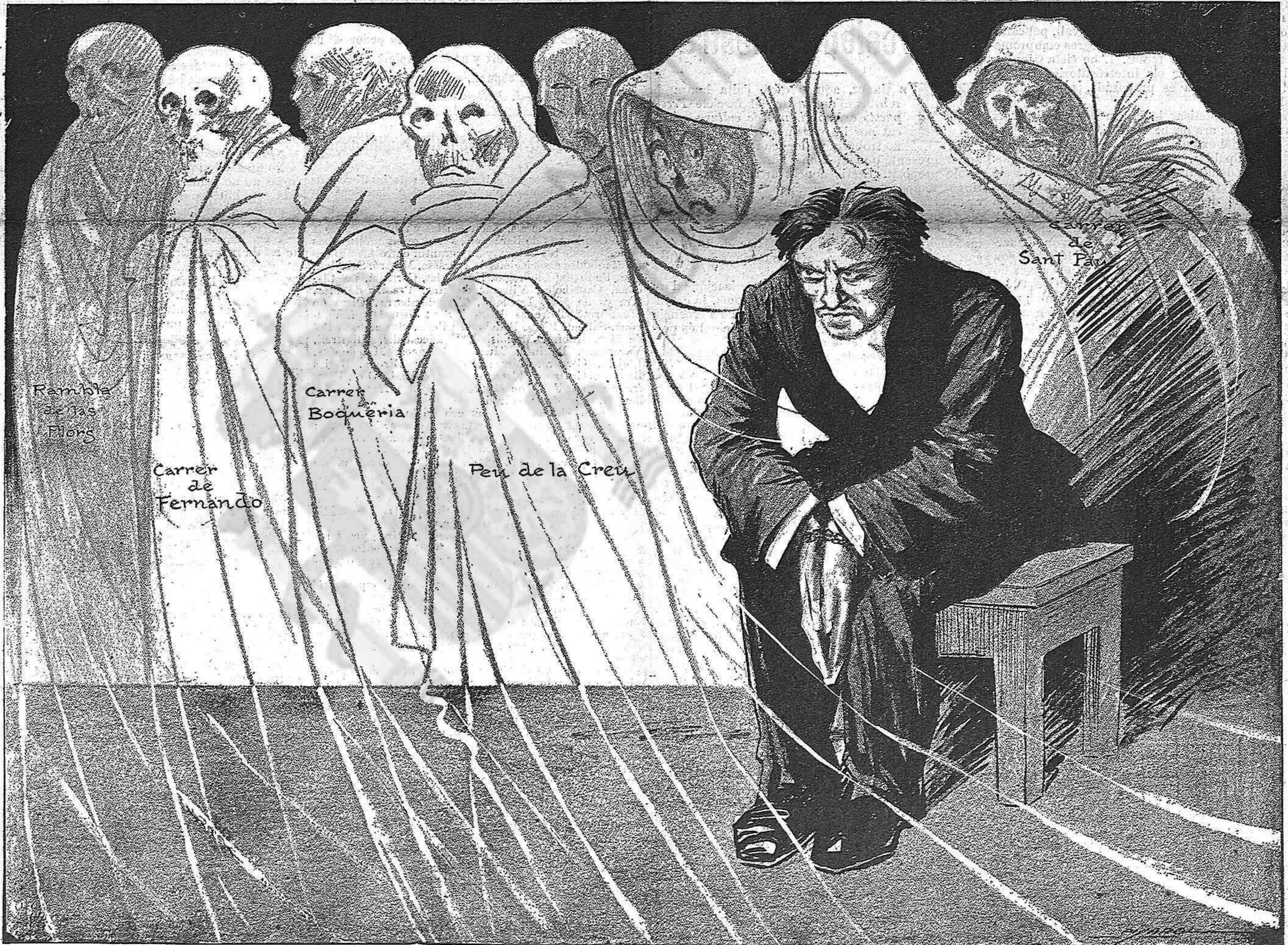
Testimonis que no parlan.