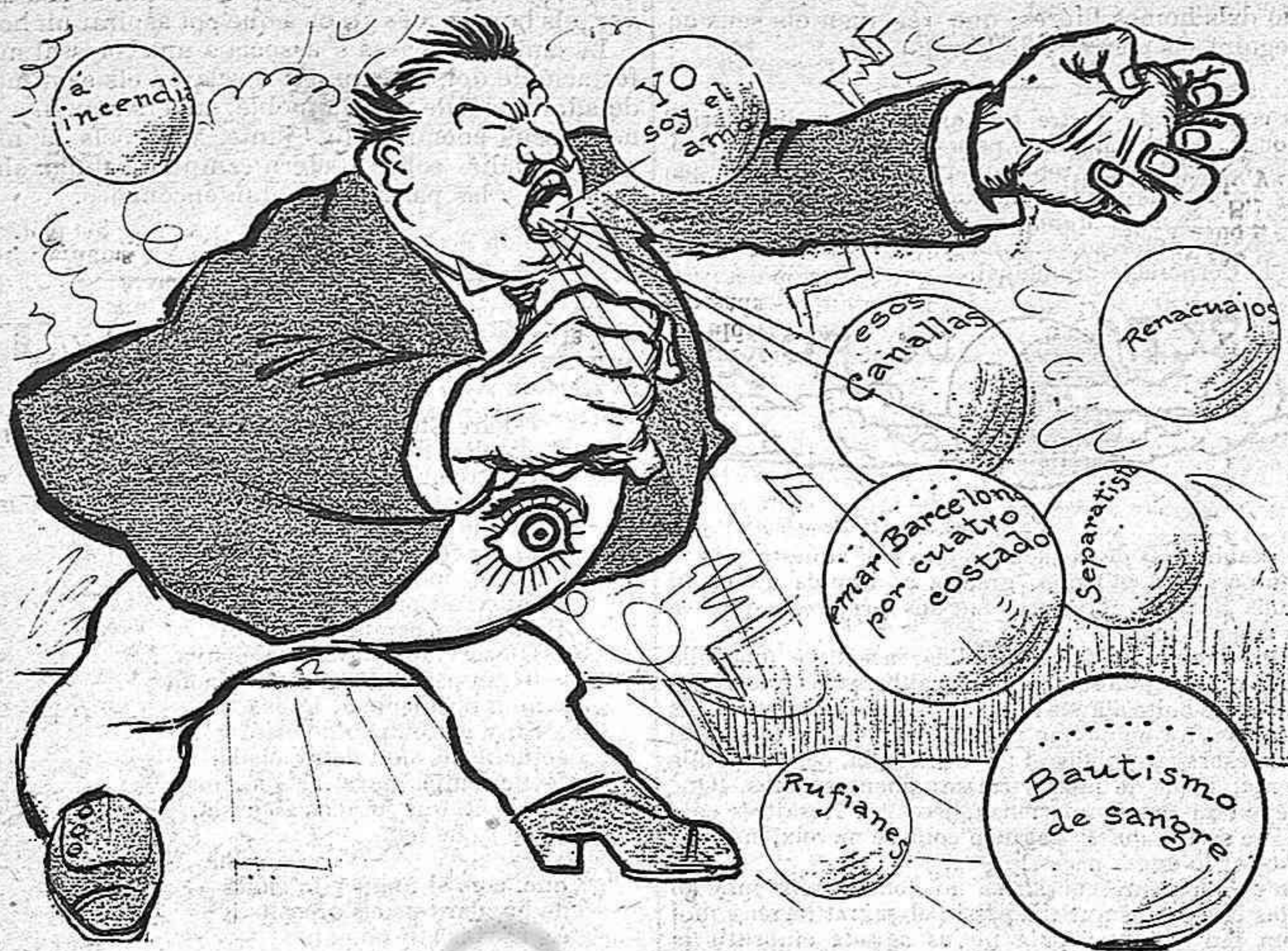
ELL, en el temps en que 's creya ser l' amo de Barcelona.