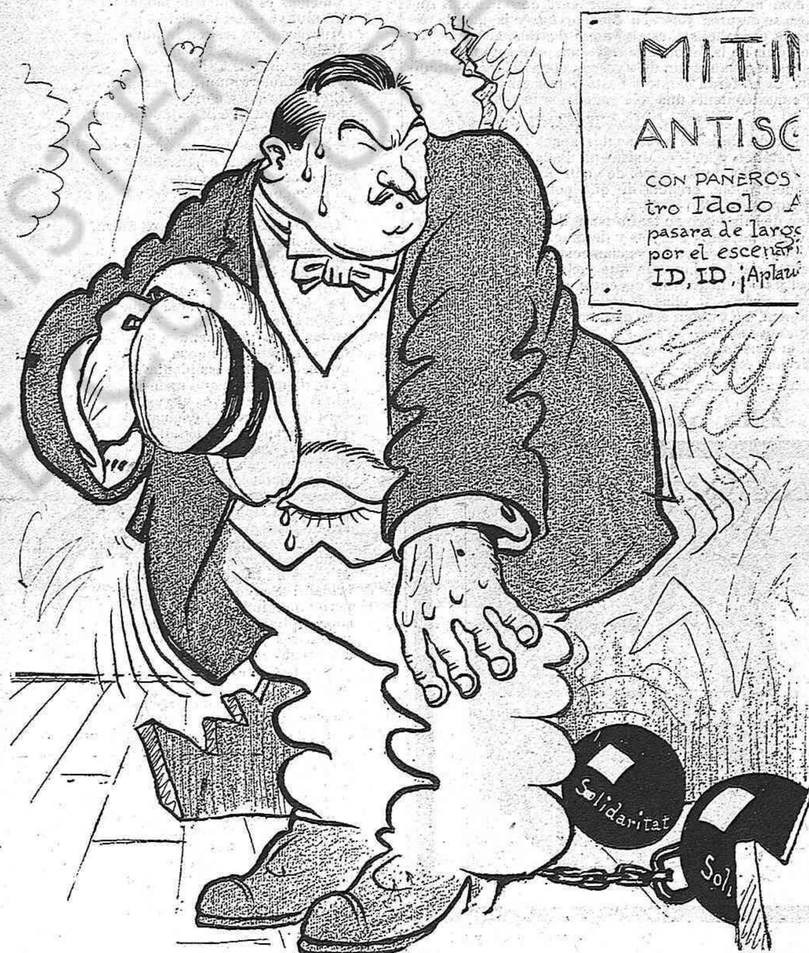
ELL, desde que la criada se li ha tornat respondona.

MITI ANTISC CON PAÑEROS tro Idolo pasara de largo por el escenari ID, ID ¡Aplau!