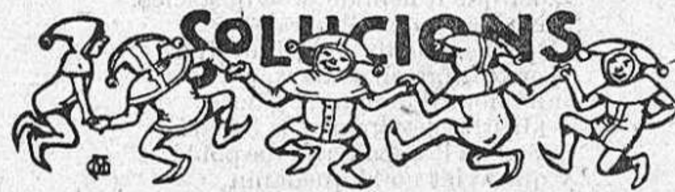
A LO INSERTAT EN L' ÚLTIM NÚMERO