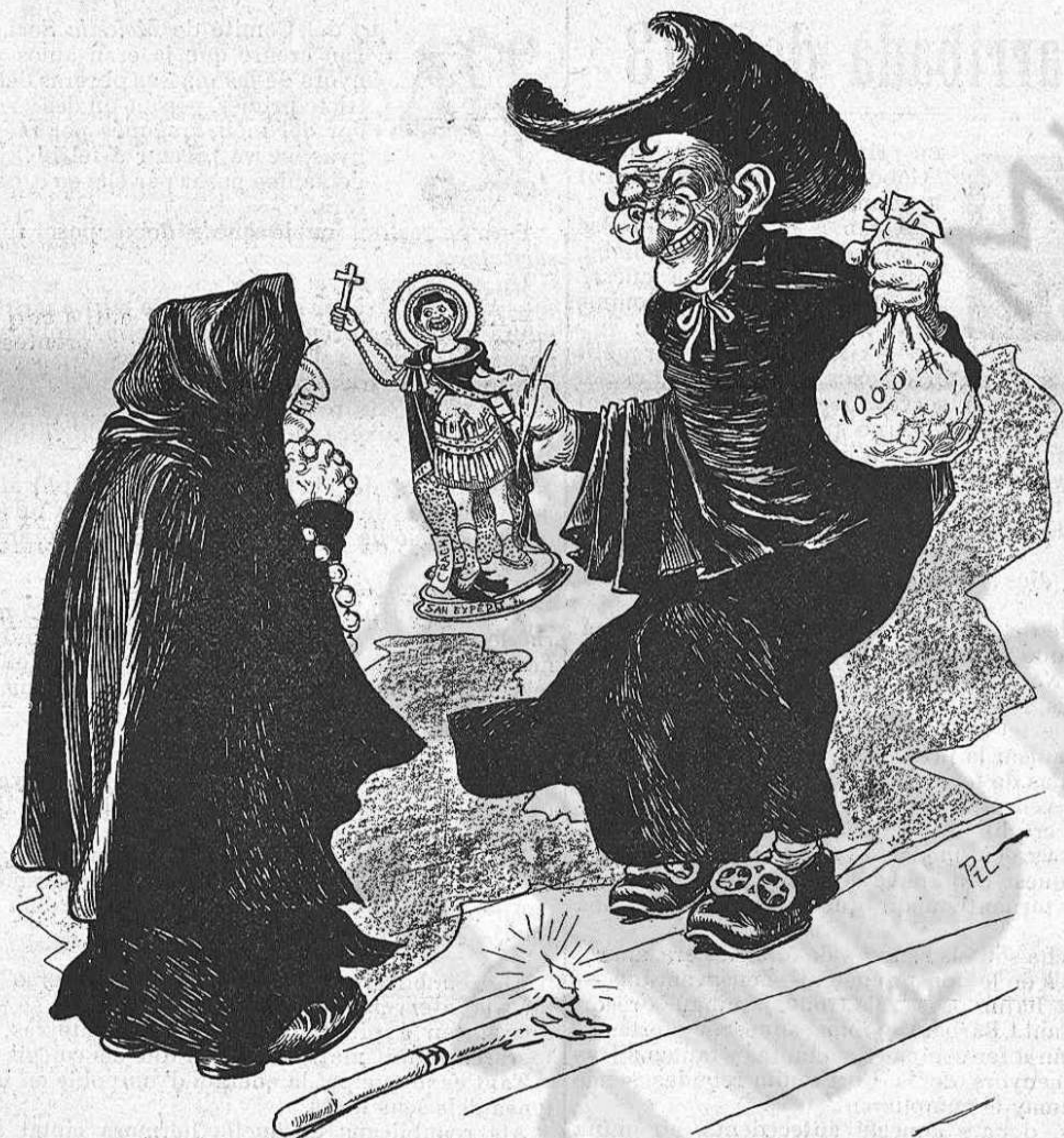
EL PLET DE SANT EXPEDIT

—Dice el arcalde que cómo es que ha hecho tanta destrossa. —Díguli qu' es una manera com un' altra de comensar la reforma de Barcelona.