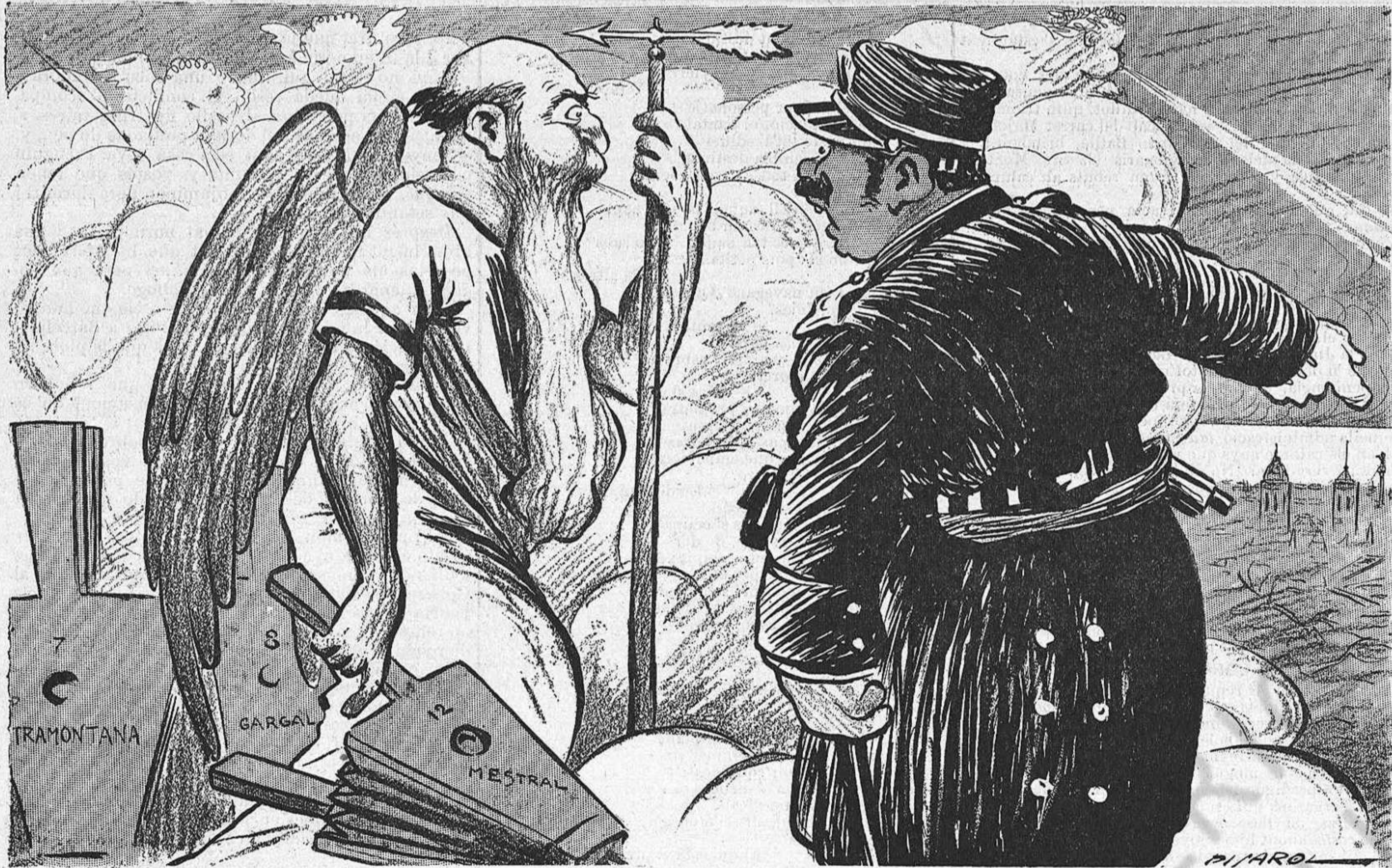
DESPRÉS DE LA VENTADA

—Dice el arcalde que cómo es que ha hecho tanta destrossa. —Díguli qu' es una manera com un' altra de comensar la reforma de Barcelona.