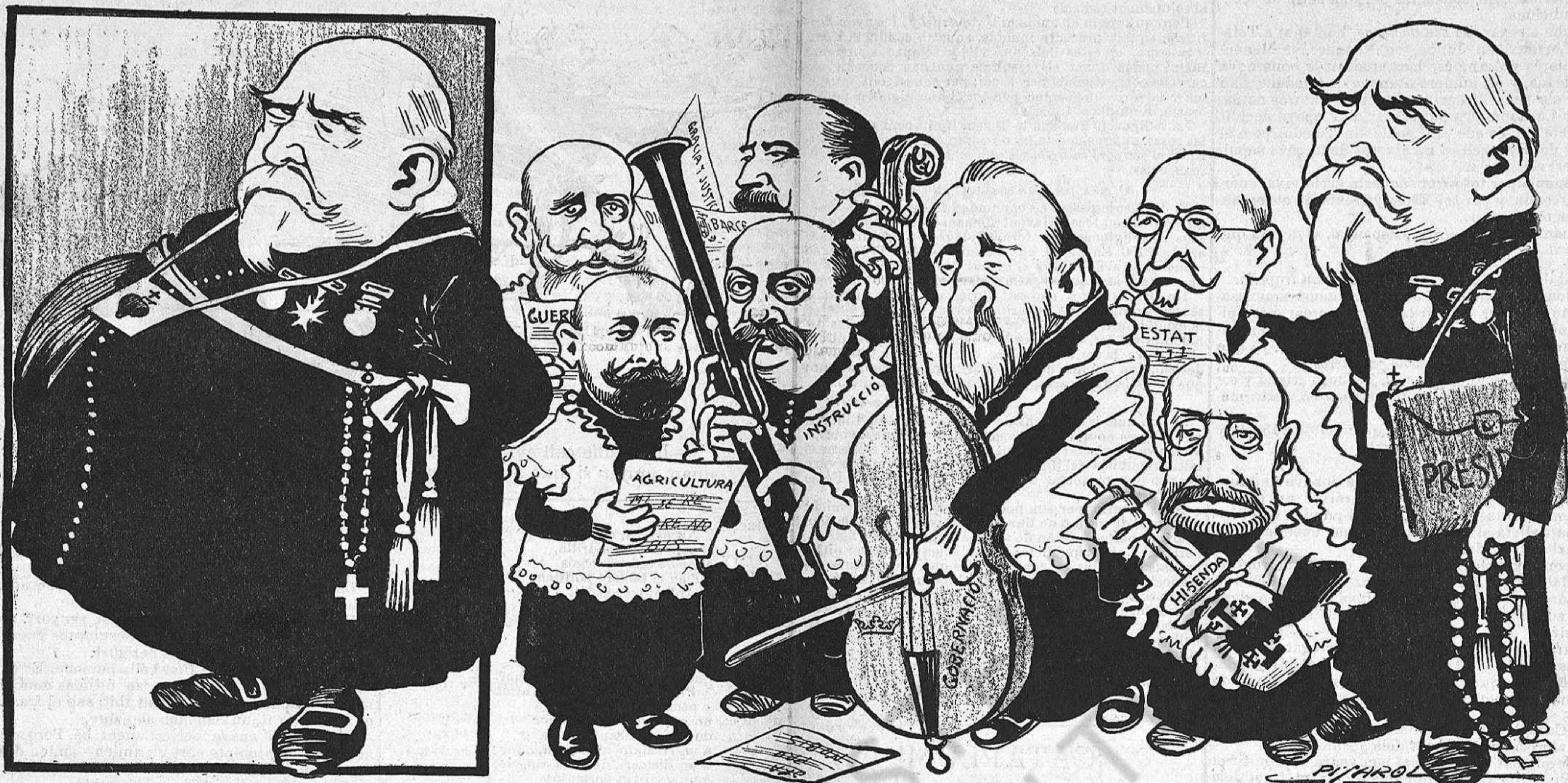
Avans del part tothom deya: —¿Qué deura sé aixó, germans?