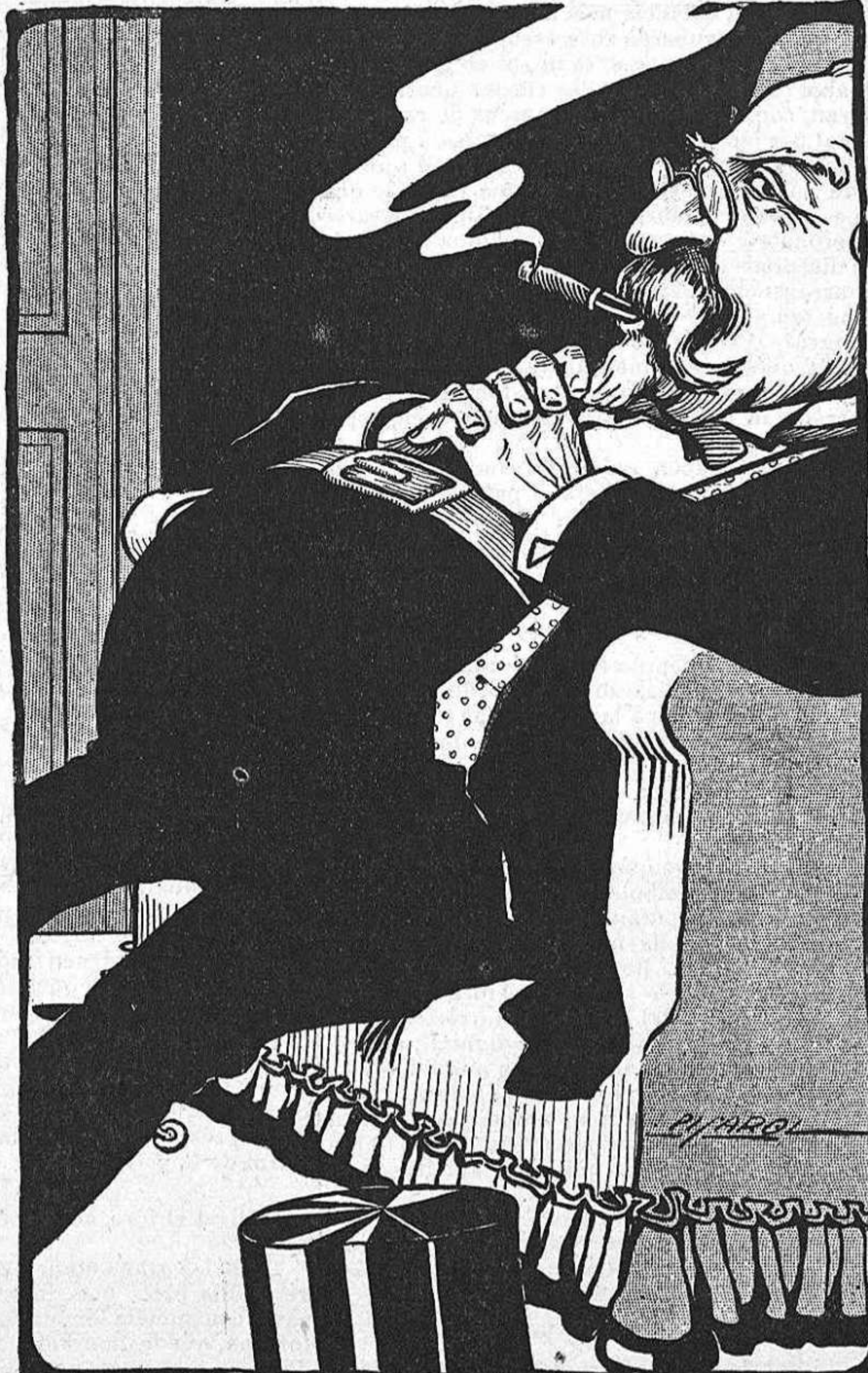
En Combes á las 24 horas de ser excomunicat.