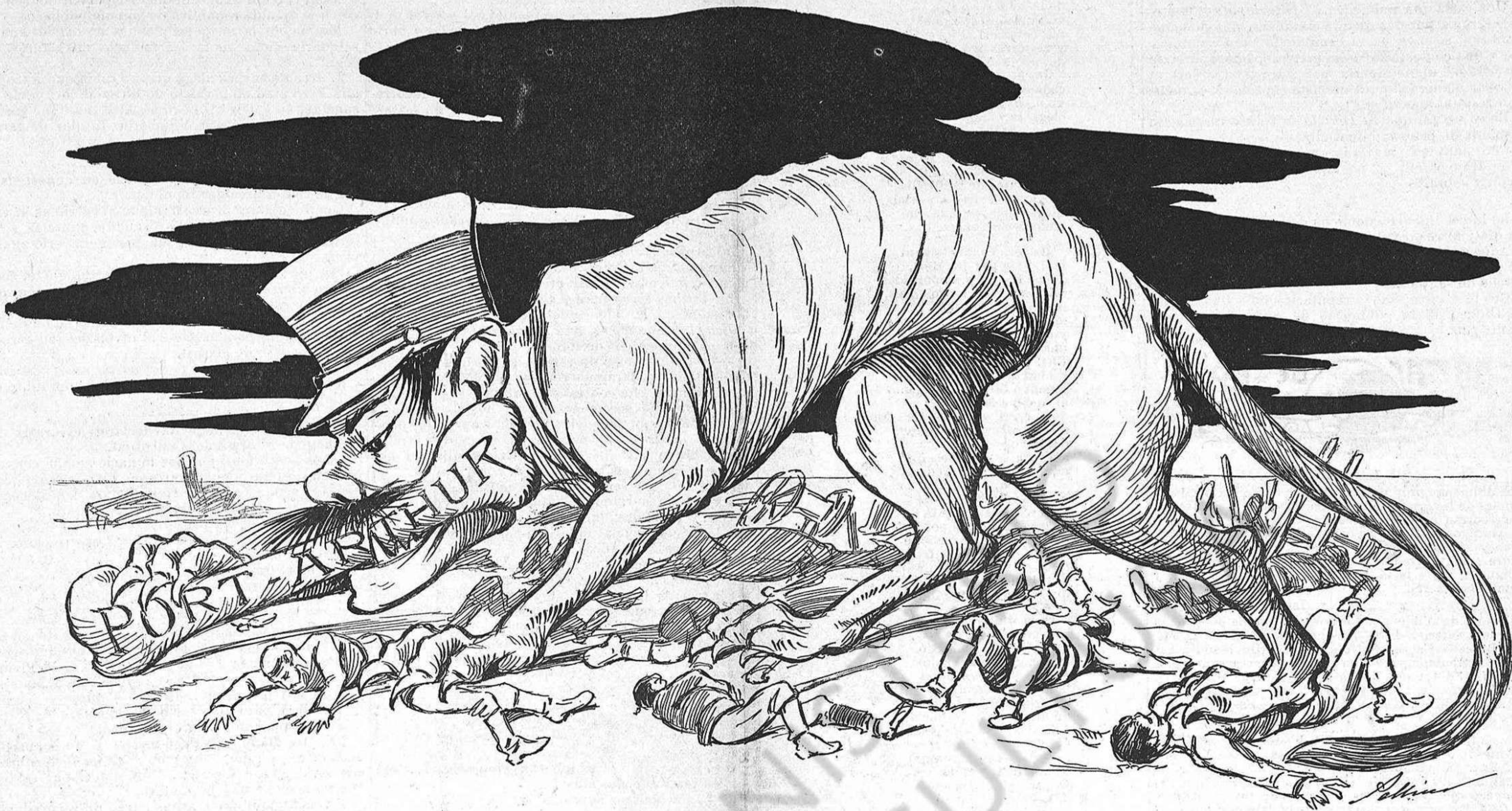
De feyna 'l gos ja 'n fa, pero l' os jes tan dur de rosegá!

se passejava amunt y avall del quarto, y bé 's pot dir que patia tant com ella. La partera, al notar el seu neguit li digué: —Vaja, home, no t'apuris... de tot això no 'n tens pas tú la culpa.