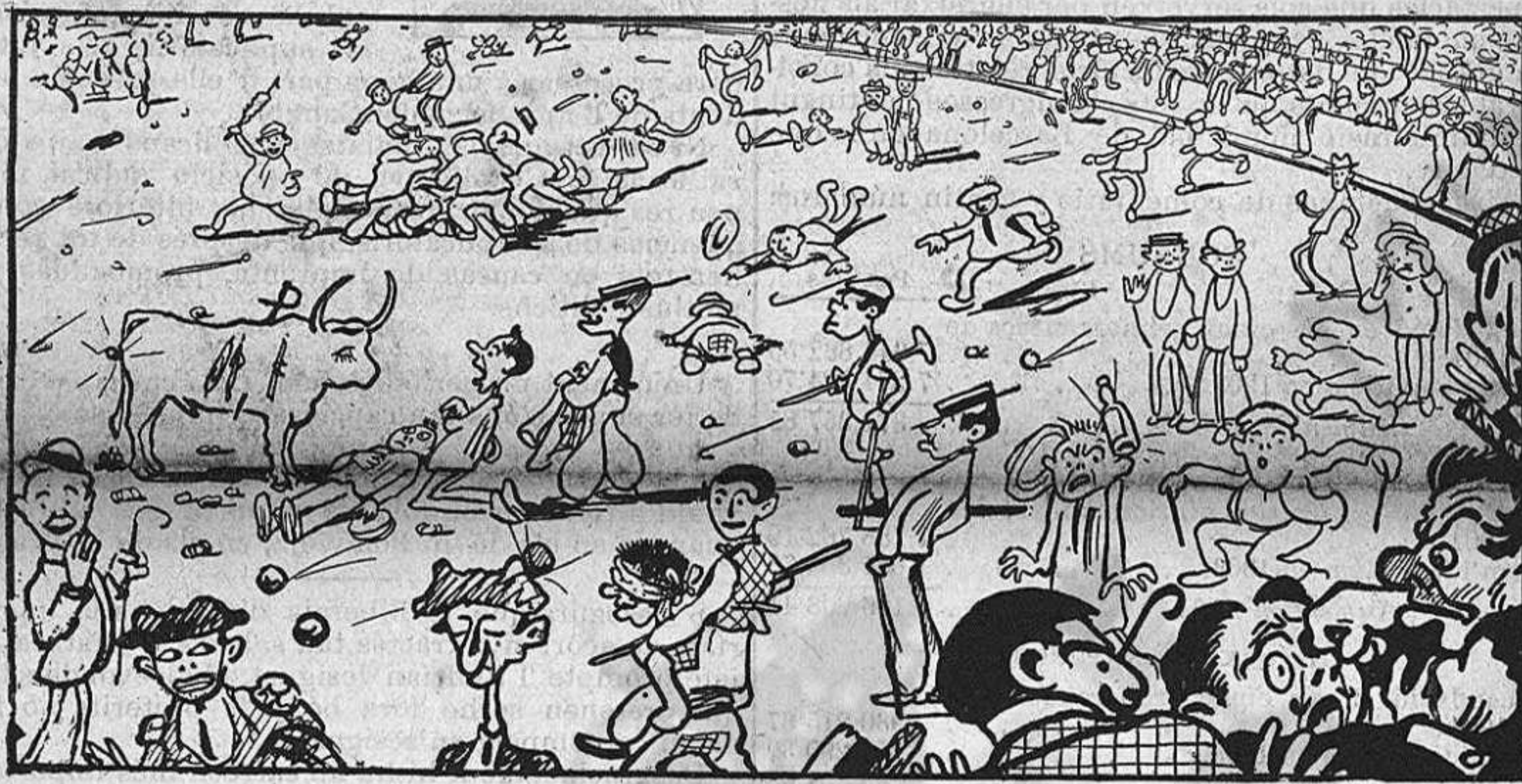
Accidents de una corrida que va ser molt discutida.