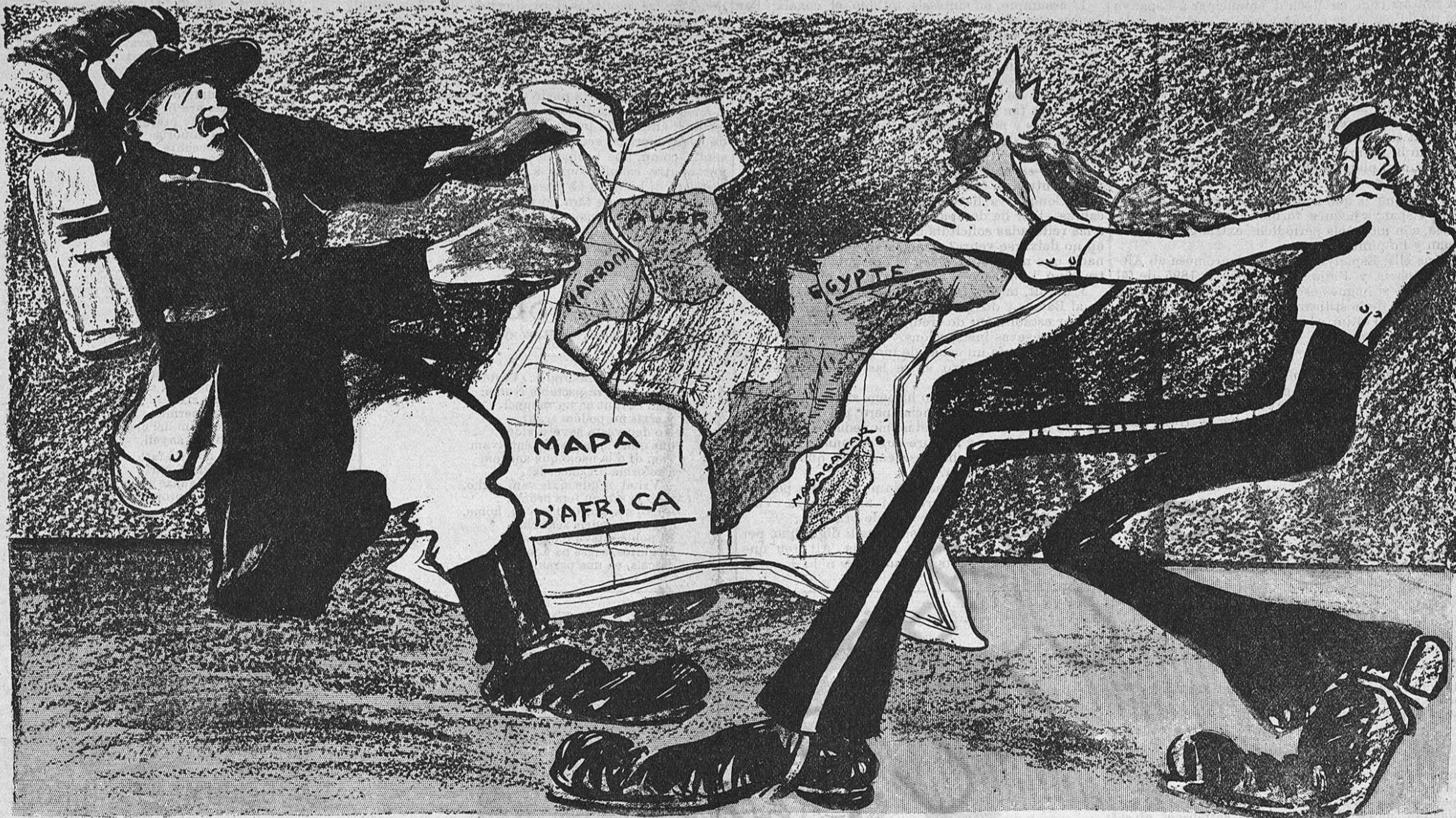
L' Africa ja no 'ls divideix. Ara son ells els que se la divideixen.

Ara, per lo que respecta a lo demés, ens acullim als beneficis promeors en la fulla al «cristiano que la publicare.» Que 'ls nostres lectors la llegeixin y la guardin, segurs de que quan la dona 'ls vagi de part, posantli la carta (ja poden suposar ahont) podran prescindir dels serveys del metje y de la llavadora, lo qual sempre es un adelantó.