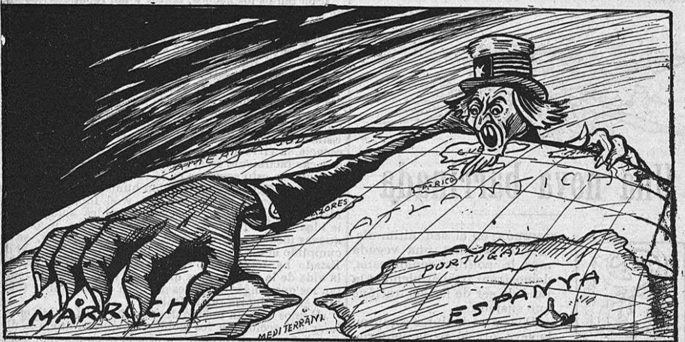
En John Bull, molt avispat, ja las unglas ha ensenyat.