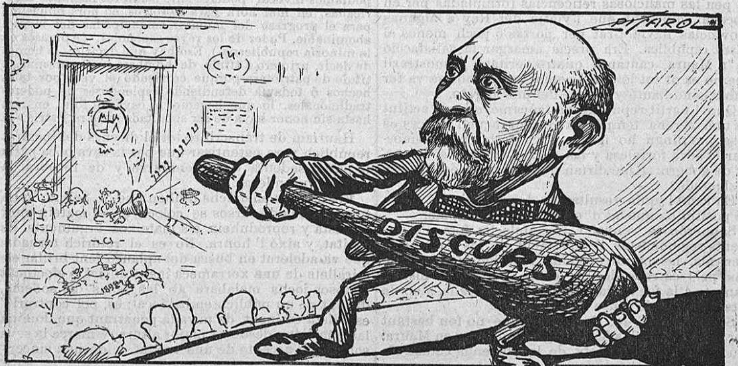
En el Congrés tot ho ensorra, aquest, ab un cop de porra.